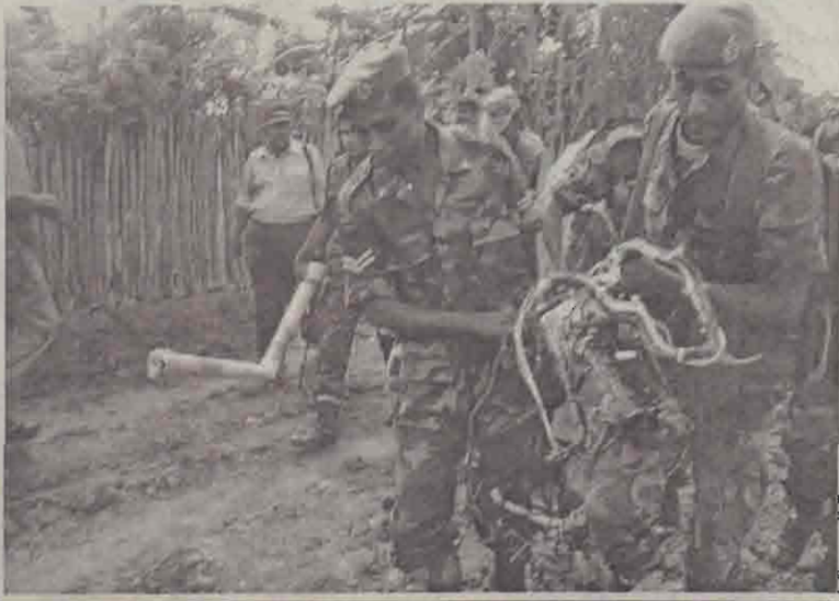
அளவெட்டி அதிரம்புலம் தோட்டப் பகுதியில் விழந்து நொறுங்கிய ஆளில்லாத வேவுவிமானத்தின் சீதைவுகளை படைவீரர் மீட்டு வருவதைப் படங்களில் காணலாம். (மேலும் படங்கள் 2ஆம் பக்கத்தில்)