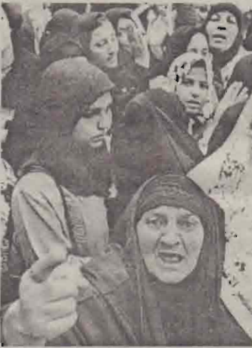
சதாமின் படத்தை தாங்கியவாறு பக்தாத்தில் உள்ள ஜ.நா. அலுவலகம் முன் அமெரிக்க எதிர்ப்பு ஆர்ப்பாட்டத்தில் ஈடுபடும் ஈராக்ஐகப் பெண்கள்.

ஈராக்ஐகின் பேரழிவு ஆயுதங்கள் இருக்கின்றன என்பதற்கு உள்வாங்கக் கூடியவர்கள் இருக்கின்றன. எனவே, ஈராக் மீதான அருத்தங்கள் அதிகரிக்கப்பட வேண்டும் என்று பிரிட்டனுக்கு பிரதமர் பிளையர் தெரிவித்துள்ளார். லண்டன்