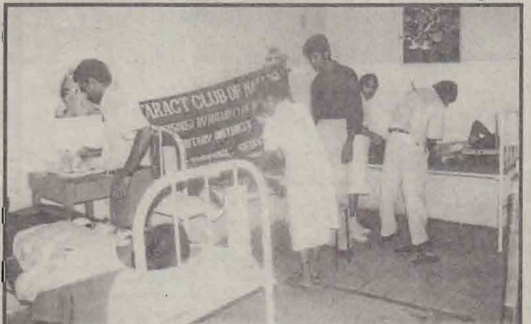
நல்லூர் நோட்டரகட் கழகத்தினால் அண்மையில் யாழ்ப்போதனாவைத்தியசாலையில் நடத்தப்பட்ட கிரகத்தான ஸ்கூல் ஸ்டூடென்ட்ஸ் பட்டம் கிது.

வலி.கிழக்கு, ஜன. 23 யாழ். தேசியக் கல்விப்பயிற்சி கல்வியறிவு வளாகத்தில் விநாயகர் ஆலயம் ஒன்றை நிறுவ லண்டனிலுள்ள சிவயோகம் அறக்கட்டளை நிதியம் 3 லட்சத்து 50 ஆயிரம் ரூபாயை வழங்கியுள்ளது. தெரிவிக்கப்பட்டது. (9-180)