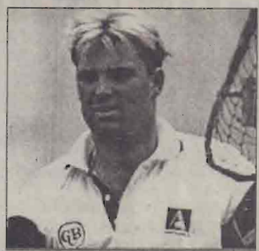
யோரில் மேற்கிந்தியத் தீவுகளின் கொன் ஹால்ஷ், 132 போட்டிகளில் 519 விக்கெட்டுக்களை வீழ்த்தி முதலிடத்தில் உள்ளார். ஷேன்வோர்ன் இரண்டாவது இடத்தில் இருக்கிறார். இதேவேளை, வி.பி. கிண்ணத்திற்கான ஒருநாள் தொடரின் இறுதிப் போட்டிகள் இன்று ஆரம்பமாகவுள்ளன. முற்று போட்டிகள் கொண்ட இச்சுற்றில் தம்மால் பங்குபற்ற முடியுமென ஷேன்வோர்ன் நம்பிக்கை தெரிவித்துள்ளார்.

உலகக் கிண்ணப் போட்டிகளுக்குப் பின் நான் முன்னுரிமையளிக்க வுள்ள விடயம், ஆஸ்திரேலியாவுக்காக டெஸ்ட் போட்டிகளில் பங்குபற்றுவதே. அதற்கு இடையூறு ஏற்படுத்தக்கூடிய எதையும் நான் செய்யமாட்டேன். "தேசிய தேர்வுக் குழுவின், பயிற்றுநர், புச்சானன், ஆஸ்திரேலிய அணித் தலைவர் ரிக்கி பொன்ரிங், மருத்துவ ஆலோசகர்கள் ஆகியோருடன் கலந்தாலோசனை நடத்திய பின் இத்தீர்மானத்தை மேற்கொண்டுள்ளேன்" - இவ்வாறு ஷேன்வோர்ன் கூறினார். 1991 முதல் ஆஸ்திரேலியாவுக்காக விளையாடி வருகிறார் ஷேன்வோர்ன். இதுவரை 191 ஒரு நாள் போட்டிகளில் 288 விக்கெட்டுக்களையும் 107 டெஸ்ட் போட்டிகளில் 491 விக்கெட்டுக்களையும் கைப்பற்றியுள்ளார். முன்னாள் உப தலைவரான அவர், 11 ஒருநாள் சர்வதேச போட்டிகளில் அணித்தலைவராகக் கடமை யாற்றியுள்ளார். டெஸ்ட் கிரிக்கெட்டில் ஆகக்கூடுதலான விக்கெட்டுக்களை வீழ்த்தி