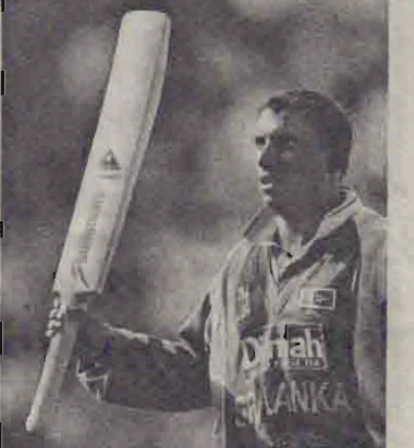
வில் 11ஆயிரத்து 616 ஓட்டங்களைக் குவித்து முதலிடத்தில் உள்ளார். இந்திய அணியின் முன்னாள் வீரரான முஹமட் அஸாருதின் 334 போட்டிகளில் 9ஆயிரத்து 378 ஓட்டங்களைப் பெற்று இரண்டாம் இடத்தில் உள்ளார். (ஒ-5)

இலங்கைக் கிரிக்கெட் வீரர் அரவிந்த டி சில்வா, ஒருநாள் சர்வதேச போட்டிகளில் 9 ஆயிரம் ஓட்டங்களைக் கடந்துள்ளார். வி.பி. கிண்ணக் கிரிக்கெட் தொடரில் நேற்றுமுன்தினம் நடைபெற்ற ஆஸ்திரேலியாவுடனான போட்டியில் 27 ஓட்டங்களைப் பெற்றபோது அரவிந்த ஒருநாள் சர்வதேச போட்டிகளில் பெற்ற மொத்த ஓட்ட எண்ணிக்கை 9 ஆயிரமாக உயர்ந்தது. நேற்றுமுன்தினம் மெல்பேர்னில் நடைபெற்ற இப்போட்டியில் 73 பந்து வீச்சுக்களில் 44 ஓட்டங்களைப் பெற்றார் அரவிந்த. 37 வயதான அரவிந்த டி சில்வா, இதுவரை 298 ஒருநாள் போட்டிகளில் பங்குபற்றி 9ஆயிரத்து 17 ஓட்டங்களைக் குவித்துள்ளார். ஒருநாள் போட்டிகளில் 9ஆயிரம் ஓட்டங்களைக் கடந்த மூன்றாவது வீரர் அரவிந்த ஆவார். இந்தியாவின் சச்சின் டெண்டுல்கர் 303 போட்டிக