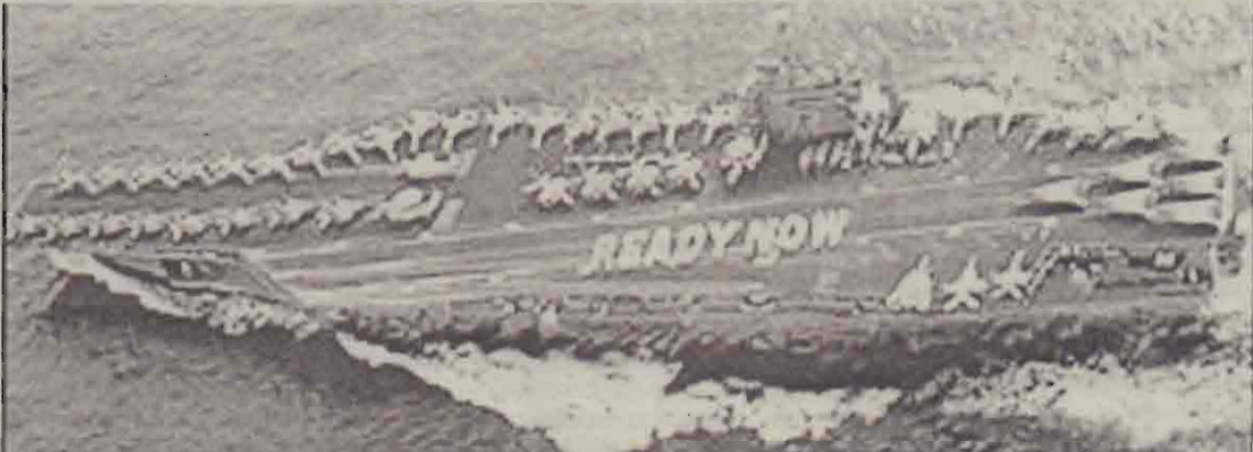
யு.எஸ்.எஸ். ஆபிரகாம் லிங்கன் விமானந்தாங்கிக் கப்பல் வளைகுடாநோக்கி ஸ்பாண்டுள்ளது. தாம் போருக்குத் தயார் எனத் தெரிவிக்கும் வகையில் கப்பலில் உள்ளவர்களால் 'இப்போது தயார்' (Ready Now) என்று எழுதப்பட்டுள்ளது.

பேர்லின், ஜன. 23 ஈராகைத் தாக்குவதற்கு தான் ஒரு போதும் ஆதரவு தெரிவிக்கப் போவதில்லை என்று ஜேர்மனி திட்டவாட்டமாக தெரிவித்துள்ளது. ஈராக் மீது அமெரிக்கா போர் தொடுப்பதற்கு ஜனாபாதுகாப்புச் சபையின் பிரேரணைகொண்டு வரப்பட்டால் ஜேர்மனி அதனை ஆதரிக்காது என்றும் அது தெரிவித்துள்ளது.