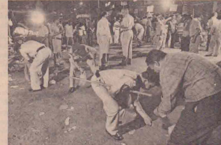
இந்தியாவின் வந்தககத் தலைநகரான மும்பாயில் திங்கட்கிழமை 27 பேர் காயமடைந்தனர். வித்யோர சந்தை ஒன்றில் சனக்கூட்டம் அதிகம் இருந்த நேரத்தில் கித்தக்குண்டு வெடித்ததால் அதிக எண்ணிக்கையானோர் காயமடைய நேரிட்டதாகப் பொலீஸார் தெரிவித்தனர். சம்பவம் நடைபெற்ற இடத்தில் தேடுதல் நடத்தும் பொலீஸாரைப் படத்தில் காணலாம்.

வடகொரியத் தலைவரை சந்தித்துப் பேசவும் அவர் எண்ணியுள்ளார். இதேவேளை, அணுவாயுதப் பிரச்சினை வடகொரியாவுக்கும் அமெரிக்காவுக்கும் உள்ள பிரச்சினை. இதில் ஐ.நா.வோ, மற்ற நாடுகளோ தலை யிடவேண்டிய அவசியம் இல்லை என்று வடகொரியா கூறியுள்ளது. மூன்றாம் தரப்பினர் இதில் தலையிடுவதற்கு காரணமோ நிபாயமோ இல்லை என்றும் வடகொரியா குறிப்பிட்டுள்ளது. இந்த விவகாரத்தில் அனைத்திலக அணுசக்தி நிறுவனம் பங்காற்ற முடியும் என்று அதன் தலைவர் எப்போதும் கவனப்பதாக வடகொரியாவின் ஆளும் கட்சிப் பத்திரிகை கூறியது. (ம)