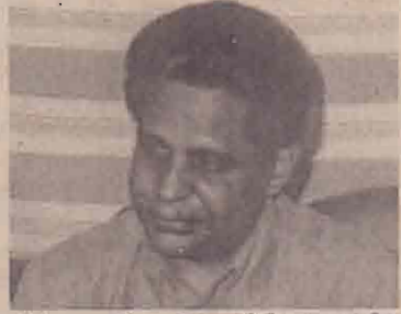
தில்லை. இவர் இந்த நிதியை கட்சிக்கும் கொடுப்பதில்லை.