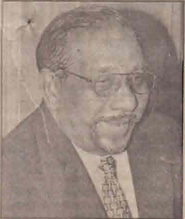
பொது நூலகத்தை ஆளந்தசங்கரியே திறப்பார்

யாழ்ப்பாணம், ஜன. 29 புனர்மைக்கப்பட்டிருக்கும் யாழ்ப்பாணம் நூலகம் எதிர்வரும் பெப்ரவரி 10ஆம் திகதி திறந்து வைக்கப்பட உள்ளது. தமிழர் விடுதலைக் கூட்டணியினர் தலைவரும் நாடாளுமன்ற உறுப்பினரான வி.ஆனந்தசங்கரி நூலகத்தை திறந்து வைப்பார் என்று அறிவிக்கப்பட்டுள்ளது. (விவரமான செய்தி 5ஆம் பக்கத்தில்) (ஐ)