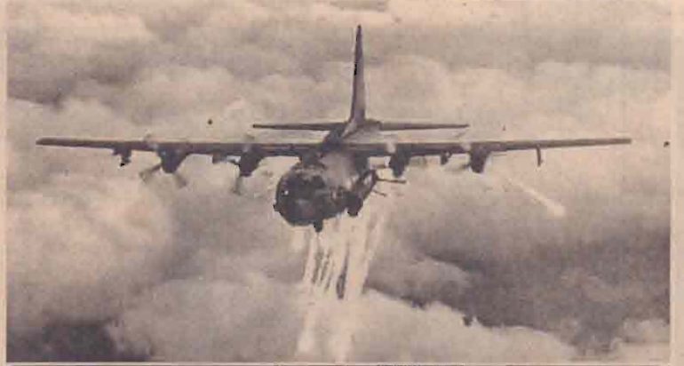
அப்கானில் நிலைகொண்டுள்ள அமெரிக்க மற்றும் பன்னாட்டுப் படைகளுக்கும் தீவிரவாதிகளுக்கும் கிடையே பாகிஸ்தான் எல்லையோரத்தில் உள்ள மலைப் பகுதியில் கடும் சண்டை கிடம்பெற்றுள்ளது. அமெரிக்க குண்டுவீச்சு விமானங்கள் மலைப் பகுதிகளில் கண்டுபிடிக்கப்பட்ட குண்டுத் தாக்குதல்களை நடத்தின. 200 அமெரிக்கப்படையினரும் நூற்றுக்கணக்காக பன்னாட்டுப்படையினரும் கிந்தத் தாக்குதலில் பங்குபற்றின. அமெரிக்காவின் 9.5 - 130 போர் விமானம் மலைப்பகுதியில் தாக்குதல் நடத்துவதைப் பத்தல் காணலாம்.