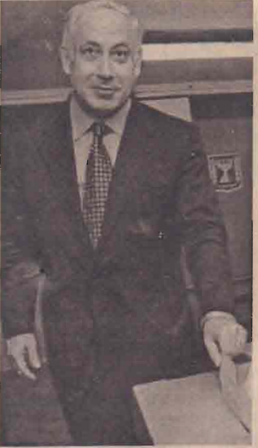
கிஸ்ரேல் பொதுத் தேர்தல் வாக்களிப்பு பலத்த பாதுகாப்புக்கு மத்தியில் நேற்று நடைபெற்றது. கிந்தத் தேர்தலில் தற்போதைய பிரதமர் ஷாய்ம் பெரேஸ் மீண்டும் பெருவெற்றி பெற்று பிரதமராவார் என வாக்களிப்பின் பின்னான கருத்துக்கணிப்புக்கள் தெரிவித்தன.