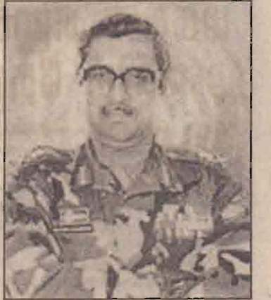
வளைகுடாவில் யுத்த மேகம்!