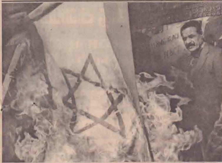
சராக் தலைநகர் பக்தாத்தில் உள்ள ஐ.நா. அலுவலகம் முன்பாக போர் எதிர்ப்பாளர்கள் நடத்திய ஆர்ப்பாட்டத்தின் போது இஸ்ரேலிய தேசியக் கொடித் தூட்டி எரிக்கப்படுவதை சராக்சியர் ஒருவர் பார்ப்பதைப் படத்தில் காணலாம்.