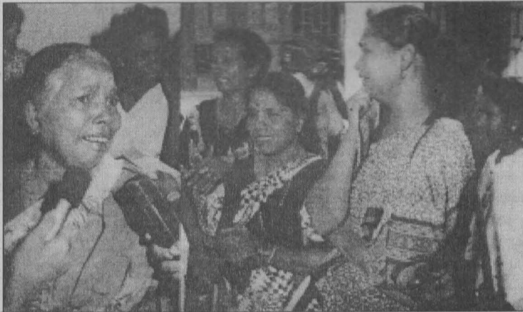
வடக்கில் காணாமல் போனோரின் தாய் மாறும் மனைவிமாறும் கதறி அழும் காட்சி.

நிரப்பப்பட்ட நிலப்பகுதிகளைக் கொண்ட புதைகுழிப் பிரதேசமாகவே காணப்படுகின்றன. இதன் பொறுப்பு தாரிகள் யார்? இவர்கள் கூறப்போகும் பதில் தான் என்ன? காணாமல் போனவர்களுக்கும் புதைக்கப்பட்டவர்