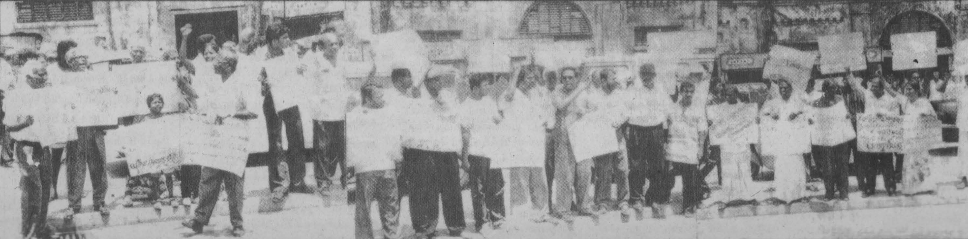
மார்ச் 24ம் திகதி வெள்ளாவத்தை சந்தை வளாகத்தில் வலிவடக்கில் 12ஆயிரம் ஏக்கர் நிலம் ராணுவப் பறிப்புக்கு உள்ளாகுவதை எதிர்த்து புதிய இடதுசாரி முன்னணி நடாத்திய ஆர்ப்பாட்ட மறியல் போராட்டம்.