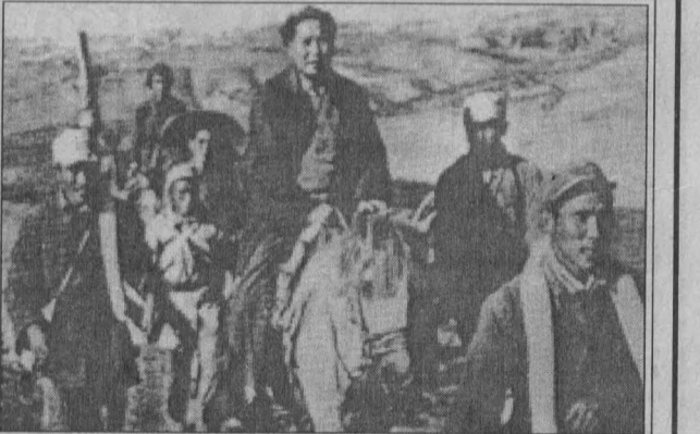
நீண்டபடை நடப்பின் போது விடுதலைப் படையுடன் மா.ஓ

சீனாவின் அயற் கொள்கை பற்றி நாம் கவனிக்க வேண்டிய முக்கியமான சில விடயங்கள் உள்ளன. நாடுகளிடையே பஞ்ச சீலம் என்ற, சமத்துவ அடிப்படையிலான உறவு சீனாவால் உறுதியாகக் கடைப்பிடிக்கப்பட்டுவந்துள்ளது. பிற நாடுகளின் உள் விவகாரங்களில் குறுக்கிடாமை நாட்டின் அளவு, சனத்தொகை, வலிமை போன்றவற்றைக் கணிப்பில் எடாத சமத்துவம் என்பன சீனாவின் அந்திய உதவியிலும் காணப்பட்ட ஒரு முக்கிய பண்பாகும். உதவி பெறும் நாட்டின் தேவைகளை மதித்து நடப்பது பற்றிய சீன அரசின் கொள்கை சீன நிபுணர்கள் உட்பட அயல் உதவி ஊழியர்களாலும் கடைப்பிடிக்கப்பட்டது. போகும் நாட்டின் வாழ்க்கைமுறைக்கும் வாழ்க்கைத் தரத்திற்கும் ஏற்ப வாழ்வதும் எளிமையும் அனைத்தையும் வெளிவெளியாகக் கலந்து பேசுவதும் மிகவும் முக்கியமாகக் கடைப்பிடிக்கப்பட்டன. இதனாலேயே சீன உதவியும் சீன நிபுணர்களும் கியூபா தவிர்ந்த பிற நாட்டு உதவியினின்றும் நிபுணர்களினின்றும் வேறுபட்டோராகக் காணப்பட்டனர்.