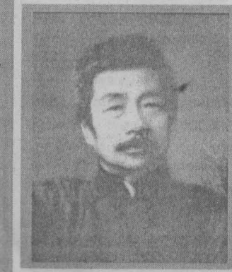
தமிழாக்கம் க. நடசபாபதி