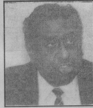
பதவிக்காக ஜே.வி.பிக்குப் பின்னால் அலைகிற ஒரு 'இடது சாரியாரால்' புதிய இடதுசாரி முன்னணியின் நேர்மையான கட்சிகளை விட அவருக்கு நெருக்கமாக இருக்க

அவருடைய அரசியல் நேர்மையும் தைரியமும் தயக்கமற்ற செயற்பாடும் அவருடைய வலிமைகள். அதே வேளை ஒரு தனி மனிதராகச் செயற்படுவதன் விளைவான அகச்சார்பான அரசியல் நோக்கும் தனிமனித முரண்பாடுகளுக்கு அளிக்கப்படும் மிகையான முக்கியத்துவமும் அவருடைய அரசியற் பலவினங்கள். தமிழ்த் தேசிய இனத்தின் மீதான ஒடுக்குமுறை மீது குவிக்கப்பட்ட அவரது கவனம் அந்த