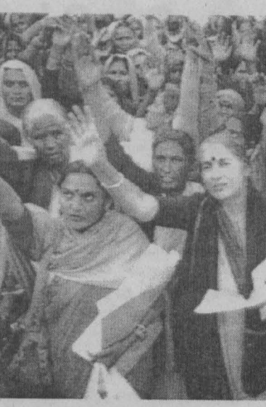
வழிகள் மூலம் அவர்களது சம்பளத்தில் குறைப்புகள் செய்யப்படுகின்றன.

என்பதாலும் சிரமப்படுகின்றன அதிகரித்த நிலையில் இருப்பதாலும் கூலி விவசாயிகளாகப் பெருமளவில் பெண்களே இருந்து வருகின்றனர். கடுமையான வேலைகளில் ஈடுபடும் கூலி விவசாயப் பெண்களுக்கு வழங்கப்படும் சம்பளம் ஆண் கூலி விவசாயிகளுக்கு வழங்கப்படுவதன் மூன்றில் ஒன்றாக அல்லது அதற்கும் குறைவானதாக இருந்து வருகின்றது. மலையகத்தில் பெண் தொழிலாளர் களுக்கு சம சம்பளம் என்பது ஏற்றுக் கொள்ளப்பட்டிருக்கிறது. ஆனால் அங்கேயும் பெண்கள் என்ற காரணத்தால் பல்வேறு குறுக்கு