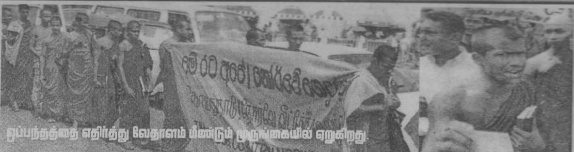
ஒப்பந்தத்தை எதிர்த்து வேதாளம் பிள்ளும் முற்பகையில் ஏறிக்றது.