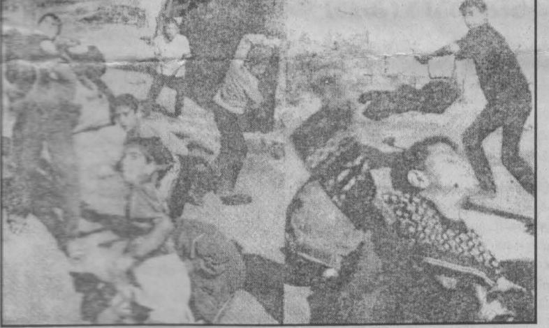
இஸ்ரேலிய பாணவத்தை எதிர்த்து கல்வீசும் பலஸ்தீன சிறுவர்கள்

ஏறத்தாழ மூன்று மாதங்களாக இஸ்ரேல் தனது ஆக்கிரமிப்புப் போரை நுத்தி வெறியாட்டம் போட்ட போதிலும், இஸ்ரேலிய கூட்டமைப்பு நாடுகள் கண்டன அறிக்கை வெளியிட்டதற்கு மேல் வேறெந்த நடவடிக்கையும் எடுக்கவில்லை. பலஸ்தீனத்தின் மீது