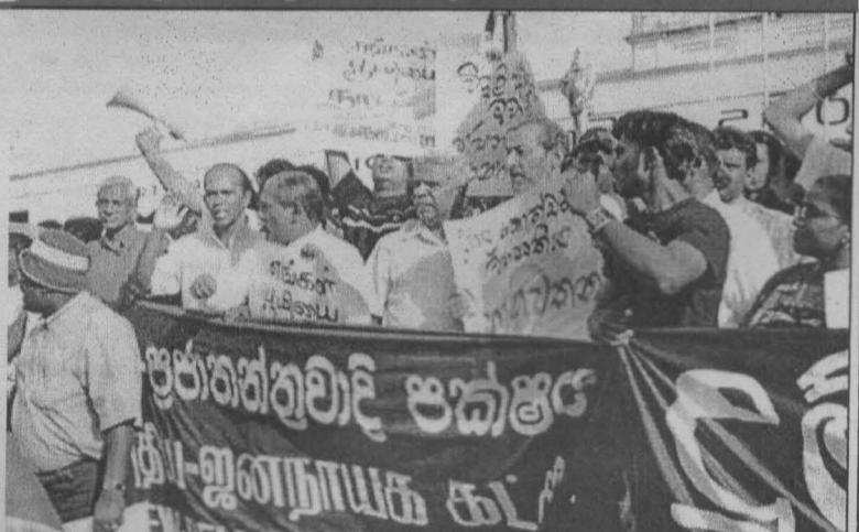
மேல் கொத்தமலை திட்டத்திற்கு எதிரான மக்கள் இயக்கம் கொழும்பு கோட்டை புகையிரத நிலைய முன்பாக நடத்திய மேல் கொத்தமலை திட்ட எதிர்ப்பு ஆர்ப்பாட்டத்தில் புதிய ஜனநாயக கட்சி கலந்து கொண்டமையை படத்தில் காணலாம்.

மே.கொ.எ.ம. இயக்கம் எதிர்ப்புணர்வுகளை ஒருங்கிணைத்து செயற்பட்டு வருகிறது. மே 15 எதிர்ப்பு தினத்தையடுத்து ம. ம. மு அதனை எதிர்த்தது. அதனுடன் தொடர்புடைய ம.இ மன்றத்தின் ஆறு இளைஞர்கள் ஆகஸ்ட் 11 முதல் 14 வரை உண்ணாவிரதப் போராட்டமொன்றை செய்தனர். நீர் பிண்சக்தி அமைச்சர் சுசில் பிரேமஜித்தின் ஊடக செயலாளரினால் வெளியிடப்பட்ட ஊடக அறிக்கையை அடுத்து அவ்வண்ணாவிரதம் கைவிடப்பட்டது.