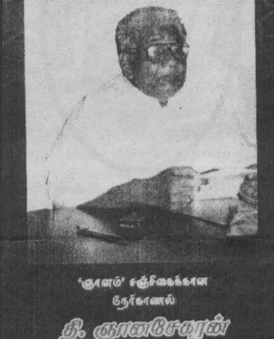
‘ஞானம்’ சஞ்சிகைகளின் நேர்காணல்