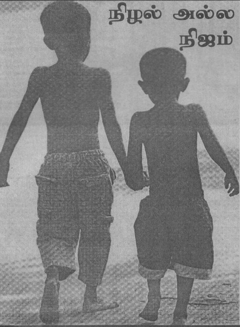
நிழல் அல்ல நிஜம்

எனவே யுத்தமாக்கப்பட்டுள்ள தேசிய இனப்பிரச்சினையில் மிகவும் நிதானமாகவும் தூரநோக்குடனும் முழுநாட்டினதும் அனைத்து மக்களினதும் எதிர்காலத்திற்கு உத்தரவாதம் வழங்கக் கூடிய விதமாக ஜனாதிபதி உறுதியான துணிவான முடிவுகளை மேற்கொள்ளவேண்டும். அத்