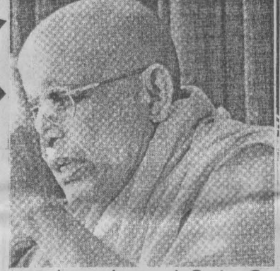
ராஜபக்ஷவால் எதுவும் செய்ய இயலாது.

விடுதலைப் புலிகள் சுத்த ராணுவக் கண்ணோட்டத்திலிருந்து விடுபட்டு வெகுசன அரசியலுக்கு முக்கியத்துவம் கொடுப்பதன் மூலமே அராசாங்கத்தின் பிரித்தானும் சூழ்ச்சிகளுக்கு இரையாகாமல் தமிழ் மக்களையும் அவர்களது விடுதலைப் போராட்டத்தையும் காக்க உதவ இயலும்.