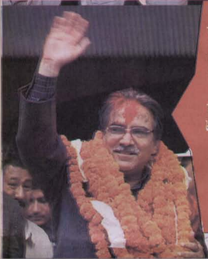
தலைவர் தோழர் பிரசண்டர் தேயாள மாவோஸ்ட்