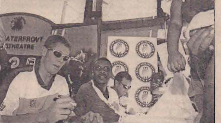
கென்யாவிற்கு அணித் தலைவர் ஷேன் வோர்ன் பிபால் ரசிக்களுக்கு கையியருக்கிறார்.