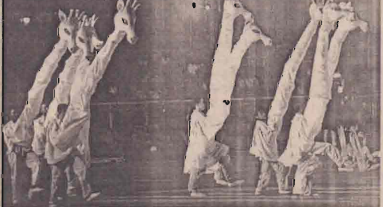
நானை நடைபெறவுள்ள ஆரம்ப நகர்வின் ஒத்தகையில் ஒரு காட்சி