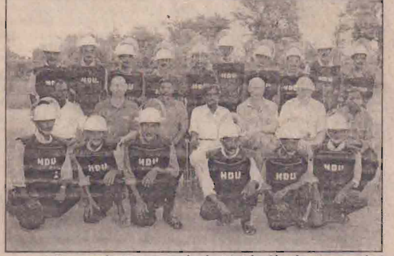
மனிதநேய கண்ணீர்வடி அகற்றும் பிரவின் கீழ் சர்வதேச தரத்தான கண்ணீர்வடி அகற்றும் பயிற்சிபெற்ற 80 பேர் தங்கள் பயிற்சியை முடித்துள்ளனர். இவர்களின் பயிற்சி நிறைவு வைபவம் நேற்று வன்னியில் நடைபெற்றது. பயிற்சி முடித்து வெளியேறியோரையும் பயிற்சி அளித்த பயிற்றுநர்களையும் படத்தில் காணலாம். (22)

என்று விடுதலைப் புலிகள் தெரிவித்திருக்கின்றனர். அந்தப் படகு கடலில் பழுதடைந்து போனதால் அதனை மீட்பதற்காக இரண்டாவது படகு (16ஆம் பக்கம் பார்க்க)