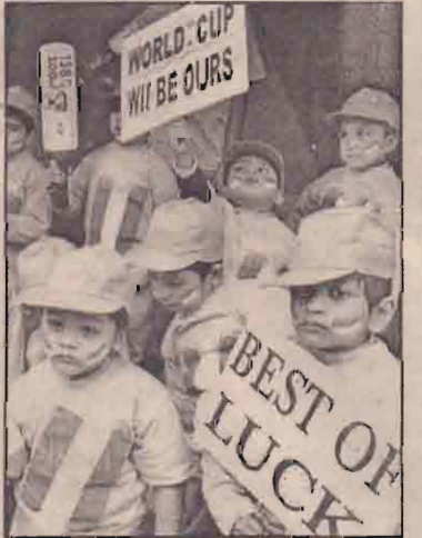
இந்தியாவுக்கு வாழ்த்துக்களும் சீரவர்கள்

ஆனாலும், கடந்த வருட இறுதிப்பகுதியில் இந்தியாவில் நடைபெற்ற டெஸ்ட் தொடரில் இந்திய அணியிடம் தேவ்வியடைந்த போதும் பின்னர் நடைபெற்ற ஒருநாள் ஆட்டங்களில் அபாரமாக விளையாடி 43 என்ற விகிதத்தில் தொடரைக் கைப்பற்றியது. அதுமட்டுமல்லாது இவ்வாட்டங்களில் மேற்கிந்தியத் தீவுகள் அணி விளை (15ஆம் பக்கம் பார்க்க)