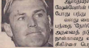
பந்து வீசினார். எனினும் அவரது பந்துவீச்சு நேற்று சோபிக்கவில்லை. 8 ஓவர்களில் 70 ஓட்டங்களைக் கொடுத்தார் அவர்.

ஆஸ்திரேலியாவின் நட்சத்திர சுழல் பந்துவீச்சாளர் ஷேன்வோர்ன் நேற்று நடந்த பயிற்சி ஆட்டம் ஒன்றின் போது பந்து வீசும் கைவிரலில் காயமடைந்தார்.