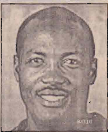
இந்த நிலையில் அணியின் பொறுப்பு சகல துறை ஆட்டக்காரரான கார்ல ஹூப்ரிடம் ஒப்படைக்கப்பட்டது. அதன்பின் மேற்கிந்திய தீவுகள் அணி பெரிய அளவில் எதனையும் சாதிக்காது விட்டாலும் அணியின் பெறுபேறுகள் படுமேசமானதாக இருக்கவில்லை.

1983 ஆம் ஆண்டு இறுதிப்போட்டிக்கு தகுதிபெற்ற மேற்கிந்தியத் தீவுகள் அணி அதன்பின் 6 ஆவது உலகக் கிண்ணப் போட்டியில் அரையிறுதிக்கு தகுதிபெற்றிருந்தது. அதன்பின்னர் இந்த அணி அதிகம் சோபிக்கவில்லை. தொடர்ந்து வர்த்தமையான மல் தூக்கி நிறுத்துவதற்கு பொருத்தமான - காத்திரமான் - ஒரு தலைமை மேற்கிந்திய அணிக்கு தேவைப்பட்டது.