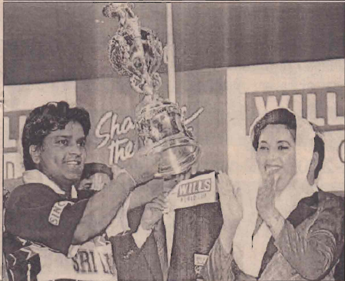
ஆறாவது உலகக் கிண்ணத்தை பாகிஸ்தானிய முன்னாள் பிரதமர் பெனாசி பூட்டோவிடமிருந்து பெரும் மகிழ்ச்சியுடன் பெற்றுக்கொள்ளும் கிலங்கை அணித் தலைவர் ரணதாங்க.