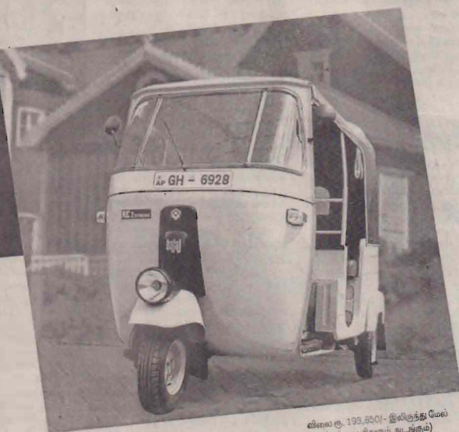
விலை ரூ. 199,850/- இலிருந்து மேல் (எல்லா வரிக்கும் அடங்கும்)

எதிர்காலத்திற்காக முதலீடு செய்வது புத்திசாலித்தனமான செயல். எனினும் அவ்வாறான முதலீட்டை மேற்கொள்ள முன்னர் அதிலுள்ள சாதக பாதகங்கள் பற்றி அறிந்திருக்க வேண்டும். அதிலும் பஜாஜ் முச்சக்கரவண்டிகளில் செய்யும் முதலீட்டானது வியக்கத்தக்க வகையில் முதலீடுசெய்த முதல் தினத்திலிருந்தே பலன்ளிக்கக்கூடியது.