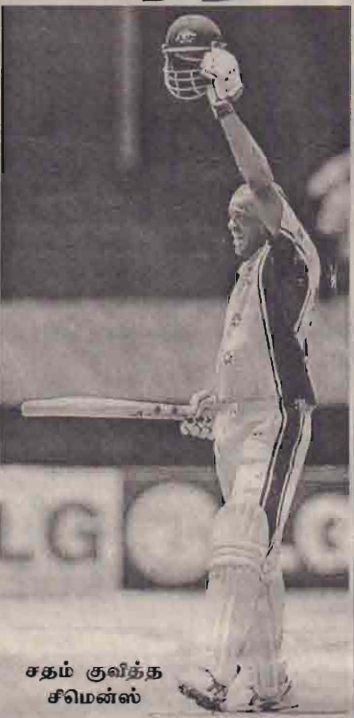
சதம் குவித்த சிமென்ஸ்

நேற்றுமுன்தினம் நடந்த பாகிஸ்தான் - தென்னாபிரிக்கா இடையே யான ஆட்டம் மிகவும் எதிர் பார்க்கப்பட்ட ஒன்று. கடந்த உலகக் கிண்ண ஆட்டத்தில் பாக்.அணி வெகு சலபமாகத் தோற்றதால் இம்முறை அது பழிதீர்க்கும் என்றே கருதப்பட்டது. ஆஸ்திரேலிய அணியும் இந்த ஆட்டம் குறித்து மிகவும் அவதானமாக இருந்தது. எனினும், கடந்த உலகக் கிண்ணம் போன்றே இம்முறையும் கோட்டைவிட்டது பாகிஸ்தான். நானாய்ச் சுழற்சியில் பாகிஸ்தான் வென்றது. ஆஸ்திரேலியாவை துடுப்பெடுத்தாட அழைத்தது. அதிரடி ஆட்டக்காரர் அடம் கில்்கிறிஸ்டும் ஹைடனும் களமிறங்கினர். ஓட்ட எண்ணிக்கை பத்தை எட்டியபோது ஓர் ஓட்டம் மட்டுமே பெற்றிருந்த கில் கிறிஸ்டை பெவிலியனுக்குத் திருப்பினார் அக்ரம். முதல்சுற்று வட்டத்துக்கு வெளியே பந்தை தூக்கி அடிக்க முயன்றார் கில்்கிறிஸ்ட். மட்டை சரியாக பந்தைச் சந்திக்கவில்லை. நேரக் கணிப்பு சறுக, பின்னே நகர்ந்த வக்காரின் கைகளுக்குள் பந்து சிக்கிக் கொண்டது. அடுத்து வந்தவர் அணித் தலைவர் பொண்டிங். ஹைடனுடன் இணைந்து ஓட்டங்களைப் பெறமுயன்றார். ஆனால், அக்ரமும் அக்தரும் சிக்கனமாக பந்து வீசினர். முதல் 15 ஓவர்களில் பந்துகளை விளாசித் தள்ளவேண்டும் என்ற ஆஸியின் எண்ணம் கைகடவிலலை. அணி 57 ஓட்டங்களை எட்டியபோது 27 ஓட்டங்களுடன் ஆடிக்கொண்டிருந்த ஹைடனை மீண்டும் பிடுங்கி எறிந்தார் அக்ரம். தொடர்ந்து வந்தவர் மார்ட்டின். வந்து நிலை எடுக்கக் கூட இல்லை. ஒரே ஒரு பந்தில் அவரையும் பிடுங்கி எறிந்தார் அக்ரம். 52 ஓட்டங்களுக்கு 3 விக்கெட் இழப்பு என்று பரிதவித்துக்கொண்டிருந்தது ஆஸ்திரேலியா. பாகிஸ்தான் பழி தீர்த்துக் கொள்ளும் என்றுதான் எல்லோரும் நினைத்தனர். மையானத்தில் பாக். வீரர்கள்