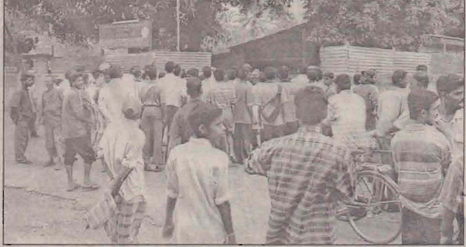
பெண் போராளிகள் மற்றும் பொதுமக்கள் மீதான தாக்குதலை அடுத்து மாண்ப்பாயிலுள்ள ஈ.பி.டி.பி. அலுவலகம் முன்பாக ஆர்ப்பாட்டத்தில் ஈடுபட்டோரைப் பட்டத்தில் காணலாம்.