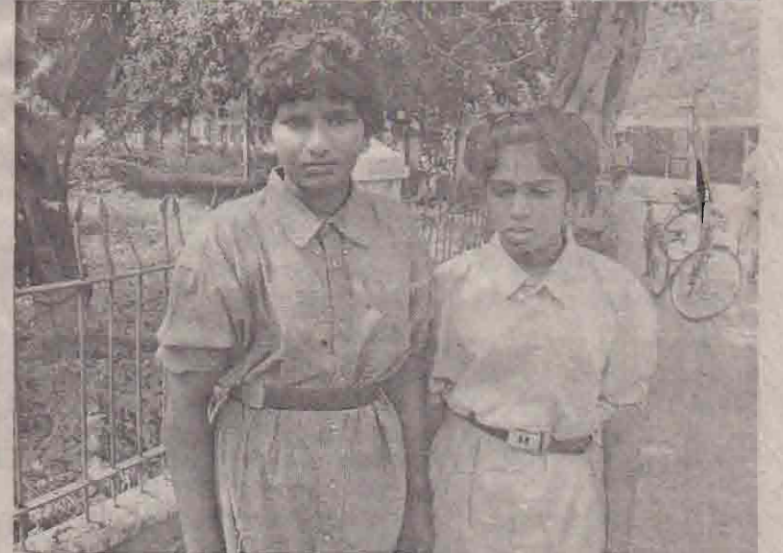
நேற்று படையினரால் தாக்கப்பட்ட பெண் போராளிகளில் இருவரையே படத்தில் காண்கிறீர்கள். அவர்களில் ஒருவருக்கு தலையில் காயம் ஏற்பட்டிருப்பதை அடுத்துள்ள படத்தில் காணலாம். மேலும் படங்கள் உள்ளே.

நேற்றுக்காலை 9.40 மணியளவில் ஆணைக்கோட்டையில் இருந்து மானிப்பாய் போக்கி சைக்கிள்களிலும் மோட்டார் சைக்கிள்களிலும் எட்டுப் பெண் போராளிகள் சென்றனர். அவர்கள் மருதுப் பிள்ளையார் ஆலயத்துக்கு சம்பளக்கவுள்ள இராணுவ முகாமை கடந்த சமயம் ஈ.பி.டி.பி. உறுப்பினர்களும் படையினரும் சேர்ந்து அவர்களை வழிமறித்தனர். அதை மீறிப் பெண் போராளிகள் உடுவில் போக்கிச் சென்றனர். (12ஆம் பக்கம் பார்க்க)