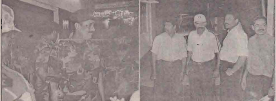
மாண்ப்பாய் சம்பவம் குறித்து கண்காணிப்புக் குழுவின் யாழ்ப்பாணம் அலுவலகத்தில் நேற்று மாலை கூட்டப்பட்ட அவசர கலந்துரையாடலில் கலந்துகொண்ட படைத்தரப்பு, போலீசின் தரப்புப் பிரதிநிதிகள்.