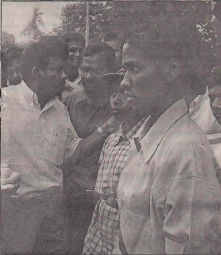
மாண்புமயம் நேற்று விடுதலைப் புலிகள் கியக்கப் பெண் போராளிகள் கிராணுவத்தினரால் தாக்கப்பட்ட சம்பவத்தைத் தொடர்ந்து அப்பகுதியில் பெரும் பதற்றம் நிலவியது. அவ்வேளையில் அங்கு எடுக்கப்பட்ட படங்களில் சில கிங்கு பிரசுரிக்கப்பட்டுள்ளன.