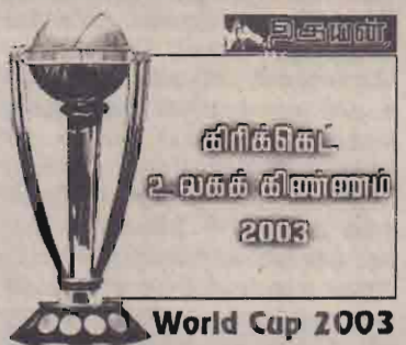
World Cup 2003

மகிழ்ச்சியுடனும் உற்சாகத்துடனும் ஆடிக்கொண்டிருந்தனர். ஆஸியின் பக்கம் நம்பிக்கை தரும் விதத்தில் பொன்றிங் நின்றனாகொண்டிருந்தார். விக்கெட்டுக்கள் விரைவாகச் சரிந்ததில் கரும் அழுத்தத்துக்குள்ளாகி இருந்தார் அவர். அதிரடி ஆட்டத்தை கைவிட்டு நிதானமாக ஓட்டங்களைப் பெற முயன்றனாகொண்டிருந்தார். அவருடன் இணைந்து கொண்டிருந்தவர் மஹார். மேலும் 34 ஓட்டங்களைப் பெறவந்தார் மஹார் வெளியேற்றினார் வக்கார். 19 பந்துகளில் 9 ஓட்டங்களைப் பெற்ற அவர் ரஷித் லத்திப்பிடம் பிடி கொடுத்து ஆட்டமிழந்தார். மறுபுறத்தில் பொன்றிங் இன்னும் பெறாமையாக ஆடிக்கொண்டிருந்தார். அடுத்து வந்தவர் சிமென்ஸ். பாகிஸ்தானின் தலைவியையே (10ஆம் பக்கம் பார்க்க)