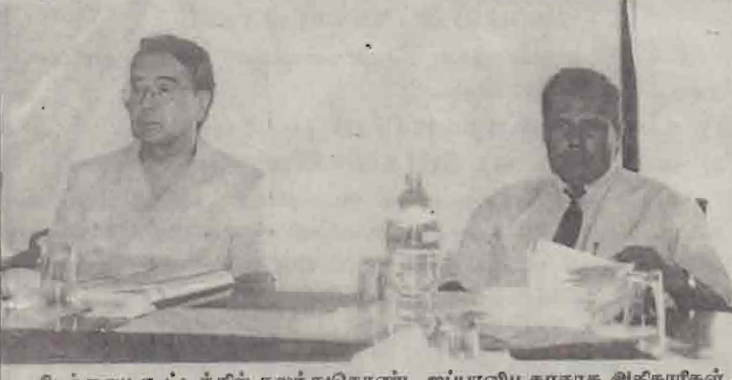
நேற்றைய கூட்டத்தில் கலந்துகொண்ட ஐப்பாளிய தூதரக அதிகாரிகள்.