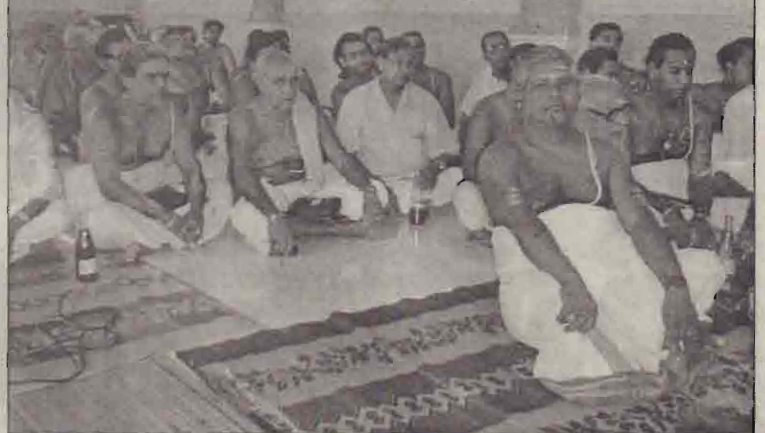
நேற்று நல்லூர் நாவலர் மணிமண்டபத்தில் கிடம்பெற்ற சர்வதேச இந்து குருமாள் ஒன்றியத்தின் கலந்துரையாடலின்போது எடுக்கப்பட்ட படங்கள்.