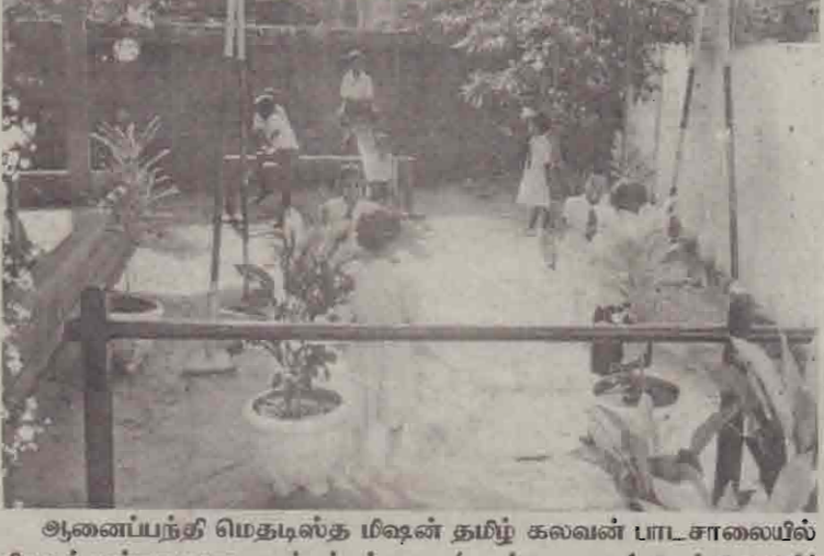
ஆணைப்படுத்தி மெதடிஸ்த மிஷன் தமிழ் கலவன் பாடசாலையில் சிறுவர் பூங்கா புனரமைக்கப்பட்டது.