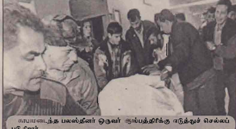
காயமடைந்த பலஸ்தீனர் ஒருவர் ஆஸ்பத்திரிக்கு அடுக்குச் செல்லப் படுகிறார்.

றனர். அவரும் தீவிரவாத அமைப்பைச் சேர்ந்தவர் என்று இஸ்ரேலிய இராணுவப் பேச்சாளர் தெரிவித்தார். ஜெய்சிக் குடியிருப்பு அகதிமுகாம்கள் கடந்த இரண்டு வருடங்களாக தீவிரவாதிகளின் உறுதியான கோட்டையாக இருந்து வருவதாக இஸ்ரேல் கூறுகின்றது. ஆனால் பலஸ்தீன அதி காரிகள் இதனை மறுக்கின்றனர். இந்த அகதிமுகாம்களில் நடந்த சண்டையில் மேலும் பலர் காயமடைந்ததாகத் தெரிவிக்கப்பட்டது. இஸ்ரேலிய இராணுவக் கவசவாகனங்கள் நடவடிக்கையை முடித்துக்கொண்டு அகதிமுகாம்களில் இருந்து வெளியேறியதும் அங்கிருந்து அப்பலஸ்தீனர்கள் பல மருத்துவமனைக்கு ஒழுத்திரிந்ததைக் கண்டதாக நேரில் கண்டவர்கள் தெரிவித்தனர். (ம)