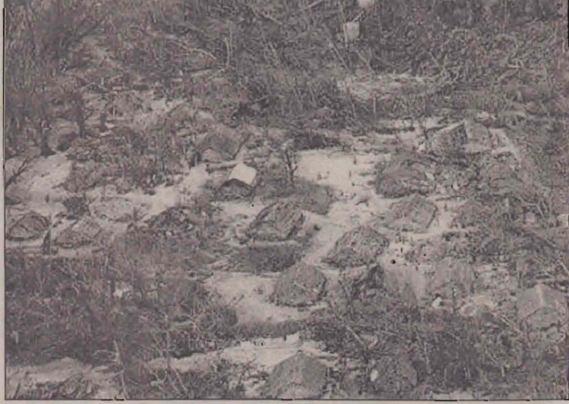
கடல்நீரால் அடித்துச் செல்லப்பட்ட தீவு ஒன்றை விமானத்திலிருந்து படம் எடுத்தபோது இருந்த தோற்றம்.

லண்டன், ஜன. 3 தென்பசுபிக் தீவுகளில் ஐந்து நாட்களுக்கு முன்னர் வீசிய தொடர்ச்சியான கடும் புயல் காற்றினால் அங்குள்ள முக்கியமான தீவுகள் மிக மோசமாகப் பாதிக்கப்பட்டுள்ளதாக, அறிவிக்கப்படுகின்றது. அவற்றில் குறைந்தது இரு தீவுகளாவது புயற் காற்றினால் கொந்தளித்த கடல் நீரால் கழுவித் தூண்டிச் செல்லப்பட்டுள்ளதாகவும் தெரிவிக்கப்படுகின்றது. பிரதான நிலப்பகுதியில் இருந்து கணிசமான தூரத்தில் இருக்கும் இந்தத் தீவுகளில் ஒன்றான சோலமன் தீவுகளை அனைத்துத்