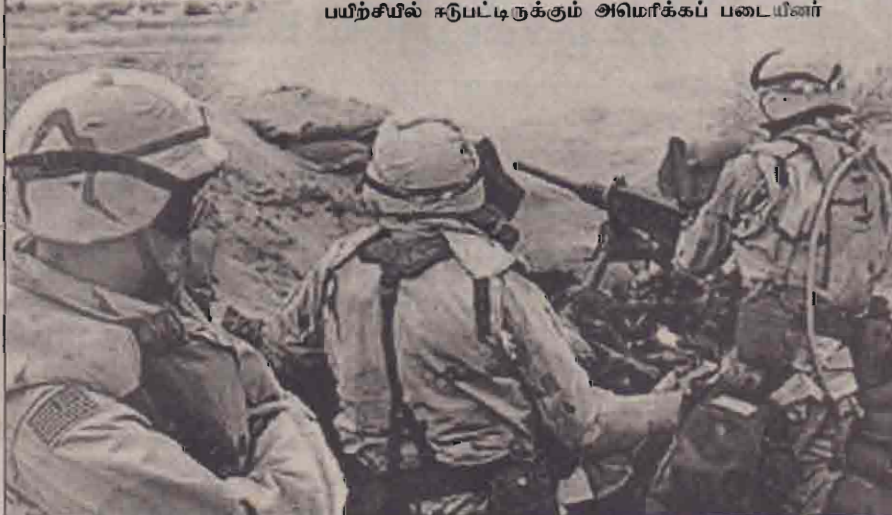
பயிற்சியில் ஈடுபட்டிருக்கும் அமெரிக்கப் படையினர்

வளைகுடாப்பகுதி நோக்கி நகர்த்தப்பட்டு வருகின்றது. இன்னும் சில தினங்களில் அது வளைகுடாப் பகுதியைச் சென்றடையும் என்று எதிர் பார்க்கப்படுகின்றது. வளைகுடாக் கடற்பகுதியில் தரித்து நிற்கும் விமானத்தாங்கிக் கப்பல்களுடன் இன்னும் 6 விமானத்தாங்கிக் கப்பல்கள் மேலும் சில நாள்சளில் இணைந்துகொள்ளும் என்றும் பென்ரகன் வட்டாரங்கள் தெரிவித்தன. அமெரிக்காவின் இந்த இராணுவ நகர்த்தல்களை ஈராக் கடுமையாகக் கண்டனம் செய்துள்ளது. ஈராக் மீது தேவையற்ற அழுத்தத்தைத் திணிக்க அமெரிக்கா முயல்வதாக அது தெரிவித்துள்ளது. இதற்கிடையில் - கடந்த புதன்கிழமை ஈராக்கின் நகரும் ராடர் தொகுதி ஒன்றின் மீது அமெரிக்க, பிரிட்டிஷ் போர் விமானங்கள் தாக்குதல் நடத்தியுள்ளன. பக்தாத்துக்கு தென்கிழக்கே விமானங்கள் பறப்பதற்குத் தடைவிதிக்கப்பட்ட பகுதிக்கு இந்த நகரும் ராடர் தொகுதி பிரவேசித்ததால், அது தாக்கப்பட்டதாக அமெரிக்க இராணுவ மத்திய தலைமை அறிக்கை ஒன்றில் தெரிவிக்கப்பட்டுள்ளது. இதேவேளை - ஐ.நா.ஆயுதப் பரிசோதகர்கள் இடைவிடாமல் தொடர்ந்தும் தமது பணியில் ஈடுபட்டுவருகின்றனர். புது வருடப்பிறப்பும் அவர்கள் தமது பணியினை மேற்கொண்டிருந்தனர். (ம)