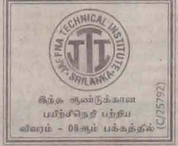
கிந்த ஆண்டுக்கான பயிற்சி நெறி பந்திய விவரம் - 08ஆம் பக்கத்தில்

இந்த விசேடத்தையான நடவடிக்கையில் ஈடுபட்டவர்களைத் தேடிப் பிடிக்க தீவிர முயற்சி எடுக்கப்பட்டிருப்பதாக அச்சுலேவி பொலீஸ் நிலையப் பொறுப்பு அதிகாரி அன்ரன் மத்திய தெரிவித்தார். (ஐ-180)