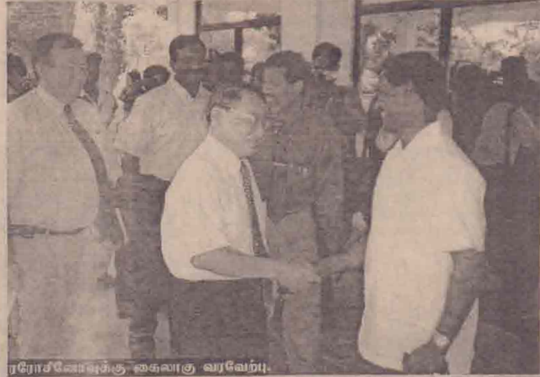
ரோசனோவுக்கு கைவகு வரவேற்பு.

ஆசிய அபிவிருத்தி வங்கியின் தலைவர் ரோசனோ நேற்று கிளிநொச்சியில் விடுதலைப் புலிகளின் அரசியல் துறைப் பொறுப்பாளர் க.ப.தமிழ்ச்செல்வனை சந்தித்து பேச்சு நடத்தினார். கிளிநொச்சியில் வைத்தியசாலைக் கட்டடத்துக்கான அடிக்கல்லை ஆசிய அபிவிருத்தி வங்கியின் தலைவர் நாட்டினார். அந்த நிகழ்வுகளில் எடுக்கப்பட்ட படங்கள் கிடை. (படங்கள்: தேவா)