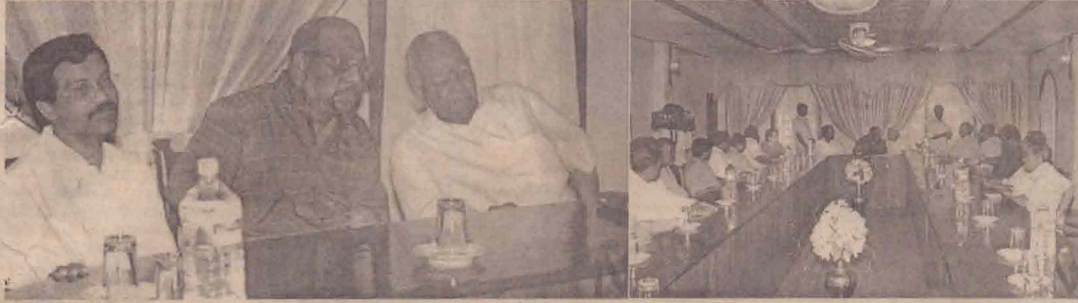
தமிழ் கூட்டமைப்பின் நாடாளுமன்ற உறுப்பினர்களுக்கும் விடுதலைப் புலிகளுக்கும் திடீரென நடந்த சந்தர்ப்பின் போது எடுக்கப்பட்ட படங்கள் திவை.