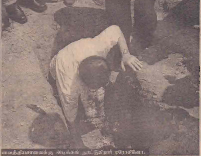
வைத்தியசாலைக்கு அடிக்கல் நாட்டுகிறார் ரோசனோ.