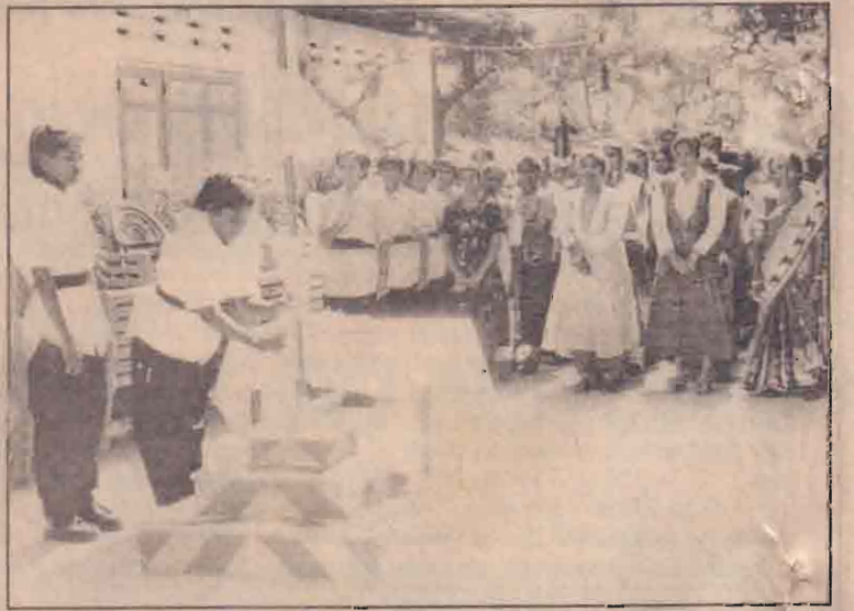
யாழ்ப்பாணம் பெண்கள் பிரதிநிதிகளின் ஒன்றுகூடலின் ஆரம்பநிகழ்வின் போது எடுக்கப்பட்ட படம்.

அவர்களின் நலன்களையும் பாதுகாப்பையும் சுட்டிப்பாக உறுதிப்படுத்தும் அமைப்பு ஒன்றை தோற்றுவிப்பதற்கான தீர்மானம் மேற்கொள்ளப்பட்டதாகவும் தெரிவிக்கப்பட்டது. அதிகாரமுள்ள பல்வேறு தரப்பட்ட பிர அமைப்புகளின் அங்கீகாரத்தை இந்த அமைப்புக்கு பெறுவதற்கான முன்முயற்சிகள் மேற்கொள்ளப்பட்டுள்ளன. இவ்வையப்பானது எதிர்காலத்தில் பெண்களுக்கு இழைக்கப்படும் அநீதிகளில் இருந்து பாதுகாப்பு அளித்து அவர்களுக்கு வழக்கைய மேம்படுத்தும் ஒரு நடவடிக்கைக் குழுவாகச் செயற்பட வேண்டும் எனத் தீர்மானிக்கப்பட்டது. என்றும் தெரிவிக்கப்பட்டது. (ஐ)