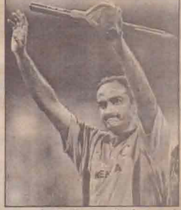
ஆஸ்திரேலியா - டேப்ளம் ஆட்டத்தில் ஆட்டநாயகனான ஹார்ன்-8.2 ஓவர்கள் வீச்சு 7 ஓட்டங்களுக்கு 3 விக்கெட்டுக்களை மிழ்த்த விபக்கவைத்தார்.