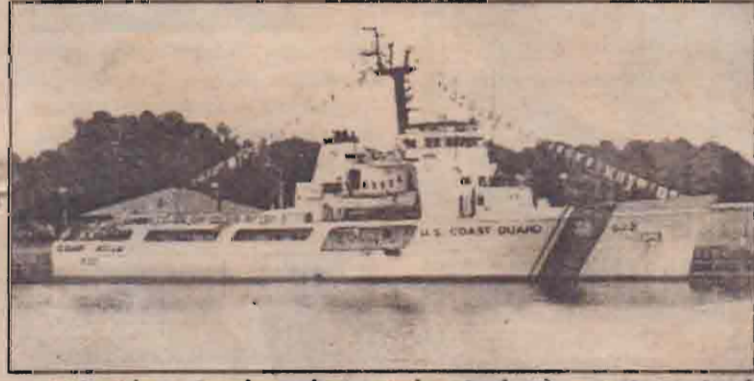
அமெரிக்கா இலங்கைக்கு வழங்கவிருக்கும் கரையோர ரோந்துக் கப்பல் கிதுதான். 1987 ஆம் ஆண்டு அமெரிக்காவில் கட்டப்பட்ட இந்தக் கப்பலின் பெயர் கரேஜஸ் (Courageous) கிதில் ஹெலி கிறங்கு. தள வசதி உண்டு.