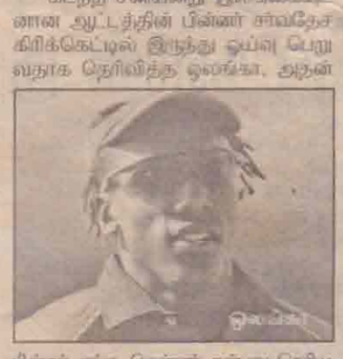
பின்னர் எங்கு சென்றார் என்பது தெரியவில்லை. தான் பிறந்த கெம்பாவில் ஓலங்கா தஞ்சமையானம் அங்கு இருக்கிறார் (13ஆம் பக்கம் பார்க்க)

லண்டன், மார்ச் 17 எம்ப்ராவில் அணியின் வேகப் பந்துவீச்சாளர் ஹேன்ரி ஓலங்கா தலைமறைவாகி உள்ளார்.