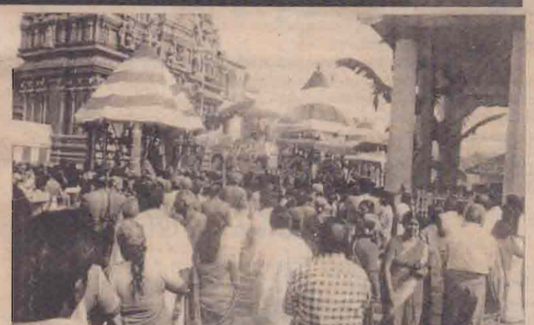
வரலாற்றுச் சிறப்புமிக்க வண்ணை ஸ்ரீ வைத்தீஸ்வரன் ஆலயத்தின் பஞ்சரத உற்சவம் கின்று காலை நடைபெறுகின்றது. கடந்த ஆண்டு மஹோற்சவத்தின்போது பஞ்ச முர்த்திகள் ரதங்களில் பவனவந்த காட்சி கிது.

கிளிநொச்சி, மார்ச் 17 பெரும் இக்கட்டான ஒரு சூழ்நிலையில் ஜப்பான் சமாதானப் பேச்சுக்குச் செல்கின்றோம். எமது கப்பல் தாக்கி அழிக்கப்பட்டு, எமது அமைப்பும் போராளிகளும் பெரும் பதற்ற நிலைக்கு உள்ளாகியிருக்கையில் அப்பேச்சில் பங்குபற்றுகின்றோம். போராளிகளின் உணர்வுகளுக்கு ஏற்றவாறு - கப்பல் தாக்கப்பட்டமைக்கு எதிரான - எமது நிலைப் பாட்டை ஜப்பான் பேச்சுக்களில் விளக்கிக் கூறுவோம். எதிர்காலத்தில் இத்தகைய சம்பவங்கள் இடம்பெறமாட்டா என்ற உறுதிப்பாட்டை அரசிடமிருந்து பெறப்போகிறோம். நாளை ஜப்பானில் ஆரம்பமாகும் சமாதானப் பேச்சுக்களில் பங்குபற்றுவதற்காக கிளிநொச்சியில் இருந்து நேற்று முற்பகல் கொழும்புக்கு புறப்படுவதற்கு சில நிமிடங்களுக்கு முன்னர் விடுதலைப் புலிகளின் மதி யுரைஞர் அன்டன் பாலசிங்கம் உதயனுக்கு இவ்வாறு தெரிவித்தார். எமது தலைவர் பிரபாகரன் கப்பல் தாக்குதலுக்கு எதிராகத் தெரிவிக்கும் கடின அபிப்பிராயம் கண்டதை யும் ஜப்பான் பேச்சின் ஆரம்பத்தில் தெரிவிப்பும் மக்களிடமும் போராளிகளிடமும் மன உணர்வுகளையும் (14 ஆம் பக்கம் பார்க்க)