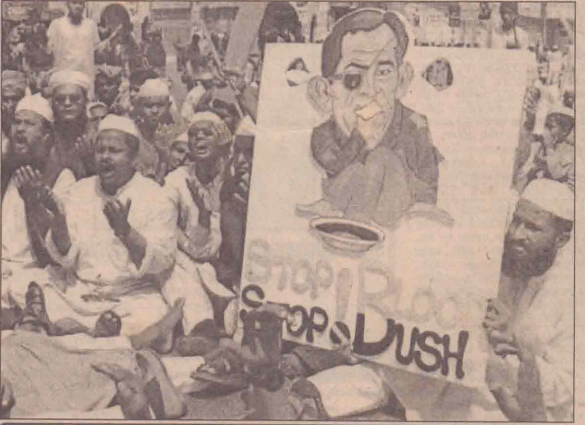
ஈராக் வீரர்களுக்காக தொழுகையில் ஈடுபடும் பங்களாதேஷ் முஸ்லிம்கள் அதிபர் புஷ்ஷின் கேலிச் சித்திரம் ஒன்றை வைத்திருப்பதை படத்தில் காணலாம். அமெரிக்காவின் தாக்குதலுக்கு எதிர்ப்புத் தொி வித்து நேற்று பங்களாதேஷ் முழுவதும் அரைநாள் வேலைநிறுத்தம் கிடம்பெற்றது. (ஐ)