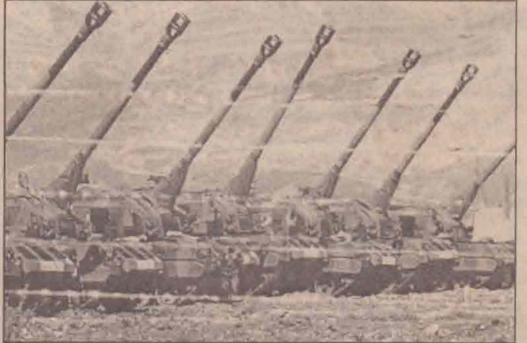
ஈராக் எல்லை அருகே தனது ஆட்லறிகளை நகர்த்தியிருக்கிறது துருக்கி. போரில் இணைந்து கொள்வதற்காக ஆயிரக்கணக்கான துருக்கி நாட்டு துருப்புகள் எல்லை தாண்டி ஈராக்கினுள் நுழைந்துள்ளன. எல்லையில் அணி வகுத்து நிறுத்தப்பட்டிருக்கும் ஆட்லறிகளையே படத்தில் காண்கிறீர்கள். (ஐ)

வாஷிங்டன், மார்ச் 23 பெரியதொரு போரைத் தவிர்க்க ஈராக் படைகளுடன் நேரடிப் பேச்சு நடத்தி வருவதாக அமெரிக்கப் பாதுகாப்பு அமைச்சர் டொனால்ட் ரஃபர்ஸ் பீல்ட் தெரிவித்தார். இதன்மேலும், நூற்றுக்கணக்கான ஈராக் வீரர்கள் சரணடைந்துள்ளதாகவும் அவர்களை போர்க் கைதிகளாக அமெரிக்க, பிரிட்டிஷ் படை வீரர்கள் பிடித்து வைத்துள்ளதாகவும் பிரிட்டிஷ் இராணுவ தளபதி அட்மிரல் மைக் கேல் பாய்ஸ் லண்டனில் தெரிவித்தார். (ஐ)