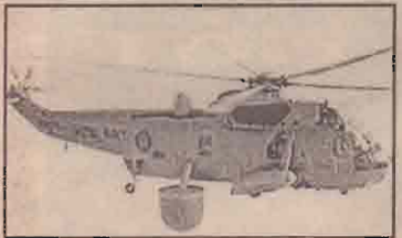
வாஷிங்டன், மார்ச் 23 பிரிட்டனின் ரோயல் கடற்படைக்குச் சொந்தமான இரண்டு ஹெலிகாப்டர்கள் நேற்று வளைகுடா கடற்

பகுதிக்கு மேலே நடுவானில் மோதி நொறுங்கின. அவற்றில் இருந்த ஏழு விமானப் படையினர் உயிரிழந்தனர். 'கடல் அரசன்' (Sea King) என அழைக்கப்படும் இந்தக் ஹெலிகாப்டர்கள் எவ்வாறு மோதின என்பது தெரியவில்லை. எனினும், தாக்குதலுக்கு அவை இலக்காகவில்லை என்று பிரிட்டிஷ் கடற்படை அதிகாரிகள் தெரிவித்தனர்.