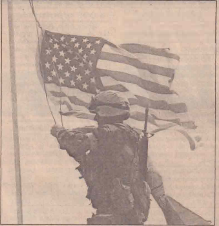
ஈராக்கினுள் பிரவேசித்த அமெரிக்க படைகள் 'உம்குலா' துறைமுகநகரின் நுழைவாயிலில் ஈராக் கொடியை அகற்றி விட்டு அமெரிக்கக் கொடியை ஏற்றும் காட்சி