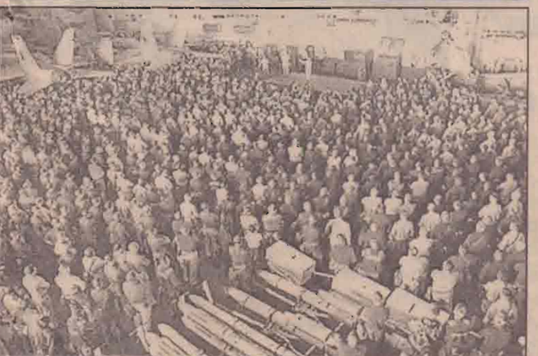
தாக்குதல் திட்டம் பற்றி அமெரிக்காவின் 'யு.எஸ்.எஸ். ஆபிரஹாம் லிங்கன்' கப்பல் வீரர்களிடையே உரையாற்றுகிறார் கப்பலின் தளபதி.