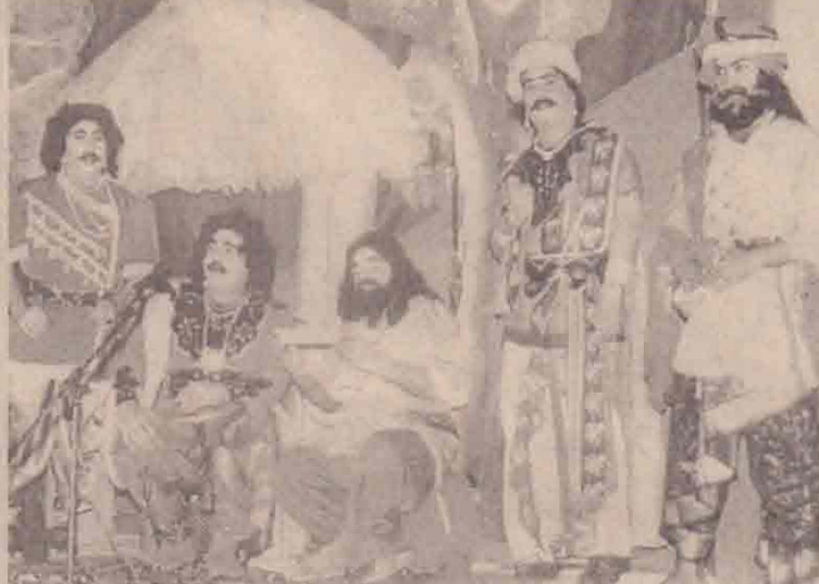
யாழ்.குருமறைக் கலாமன்றத்தினரால் அண்மையில் கிளவாலை புனித ஜெனரலியர்ஸ் கல்லூரியில் 'கம்பன் மகன்' நாட்டுக்கூத்து மேடையேற்றப்பட்டது. இக்கூத்தல் கிடம்பெற்ற கம்பன் தனது வீட்டுக்கு வந்த மன்னனுக்கு கிராமாயணம் பாடிக் காண்பீக்கும் காட்சியைப் படத்தில் காணலாம்.