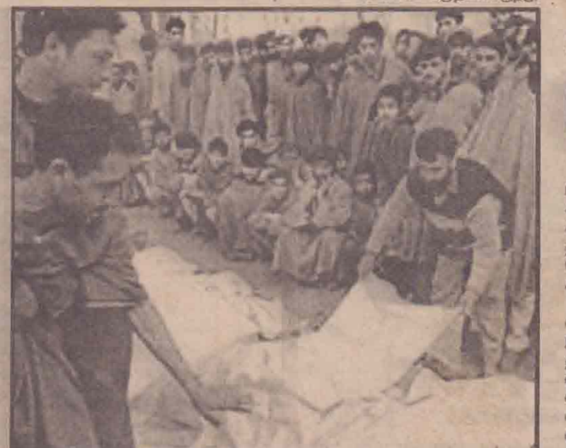
இந்தியாவின் காஷ்மீர் மாநிலத்தில் நேற்று இடம்பெற்ற தீவிரவாதிகளின் தாக்குதலில் உயிரிழந்த காஷ்மீர்ப் பண்டிட்டுகளின் சடலங்களுக்கு சிறுமக்களின் கைகள் இடம்பெற்றபோது எடுக்கப்பட்ட படம்.