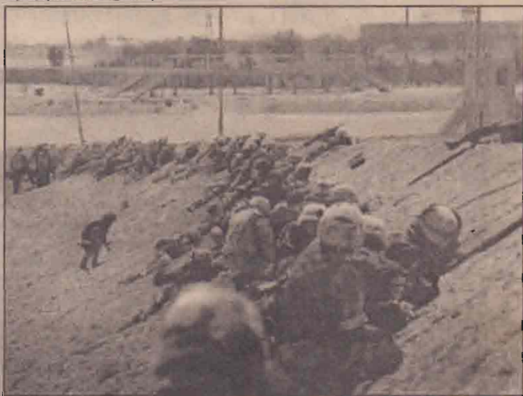
ஈராக்கின் துறைமுகநகரான உம்குலாவில் ஈராக் படைகளின் தாக்குதலை எதிர்கொள்ளும் அமெரிக்கப்படையினர்.

இச்சம்பவத்தைப்பற்றி சிரியாவில் அமெரிக்க எதிர்ப்பலை வேகமாகப் பரவி வருவதாகக் கூறப்படுகிறது.