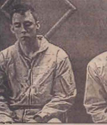
கைதான இரு விமானிகள்

மான ஈராக் வீரர்கள் தாமதவே முன்வந்து சரணடைந்துள்ளனர். அமெரிக்க பிரிட்டிஷ் படைகளின் தாக்குதலை எதிர்வேள்ள முடியாமல் தடுமணி வருகின்றார் சதாம். சிறிது சீழ் தாக அவர் தனது கட்டுப்பாட்டையும் கிழந்து வருகின்றார். இந்தப் போரில் அமெரிக்கா வெற்றிபெறுவது உறுதி. போர்க் கைதிகளைத் துன்புறுத்து வேண்டி போர்க்குற்றவாளிகளாகக் குறிக்கும் சண்டை வழக்கமுடியும். இன்னும் ஒரு நாட்களில் ஈராக் கியப் படையினர் எம்மிடம் சரணடைந்து விடுவார்கள். அல்லது வீழ்ச்சியைச் சந்திப்பார்கள். இந்தப் போரில் இருவரை ஈராக் இராசயன ஆயுதங்களைப் பயன்படுத்தாததற்கு நன்றி. ஆனால், அப்படியொரு தாக்குதல் நடத்தப்பட்டால் அதனை எதிர்கொள்ளும் நாங்கள் தயார். சதாம் ஐட்சிக்கு முடிவுகட்டியாயின் ஈராக் மக்களுக்குத் தேவையான உணவு மருந்துப் பொருள்கள் உள்ளிட அனைத்து உதவிகளையும் அமெரிக்கா செய்யும் என்றார் புஷ். (ம)