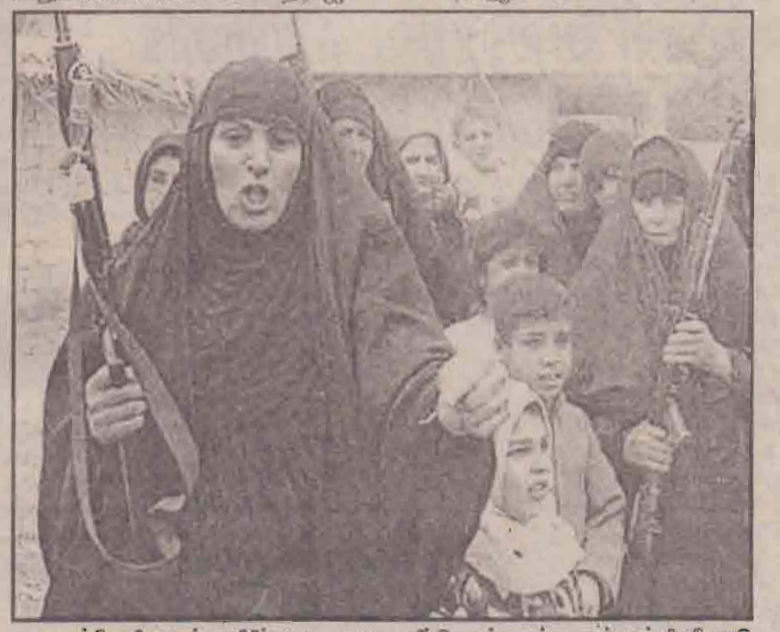
முன்னேறி வரும் எதிர்ப்படைகளை எதிரிகொள்வதற்கு சும்பாக்களோடு கயாராக நீரும் பக்தாத் பிண்களை படத்தில் காண்கிறீர்கள்.