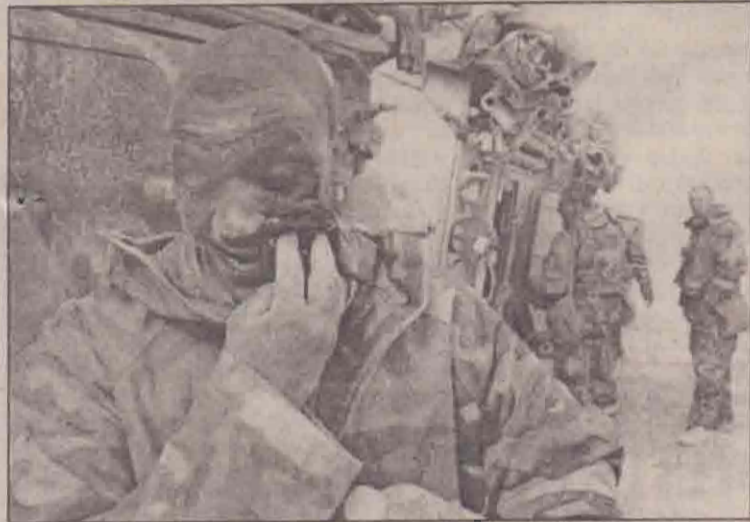
அமெரிக்கா தலைமையிலான படைகளின் பக்தாத் நோக்கிய முன்னேற்றத்தை கரும் புழுதிப் புயல் தடுக்கு நிறுத்தியிருக்கின்றது. சுழன்றடிக்கும் புழுதிப் புயல் தமது படைகளின் முன்னேற்றத்தை தாமதப்படுத்தியிருப்பதாக அமெரிக்க கூட்டுப்படைத் தளகர்த்தர் ரிச்சர்ட் மேயர் ஒப்புக்கொண்டுள்ளார். புழுதி படிந்த தளது கண்களைத் துடைக்கின்ற அமெரிக்கச் சிப்பாய் ஒரு வடிவியே படத்தில் காண்கிறீர்கள்.