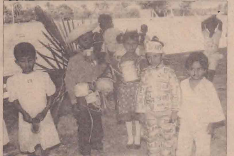
அண்மையில் வட்டுக்கோட்டை யாழ்ப்பாணக் கல்லூரியின் ஆரம்பப்பிரிவு மாணவர்களுக்கான விளையாட்டுப்போட்டி கிடம்பெற்றது. இதில் விளையாட்டு போட்டியில் பங்கேற்ற மாணவரைப் படத்தில் காணலாம். (அராலி செய்தியாளர்)