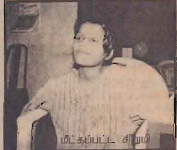
மீட்கப்பட்ட சிறுமி மோதல் நடைபெற்றது என பொலீஸ்மர் அதிபர் ரி.ச.ஆனந்தராஜா ஒப்புக் கொண்டார்.

கொழும்பு, மார்ச் 29 ஒறுகொடவத்த தொடர்மாடி வடொன்றில் 13 வயதுச் சிறுமி ஒருவர் சங்கிலியால் கட்டி வைக்கப்பட்டிருந்த சம்பவத்தில் பொலீஸ் அதிகாரிகள் தமது கடமையைச் சரியாக நிறைவேற்றாததாலேயே ஆர்ப்பாட்டம்.