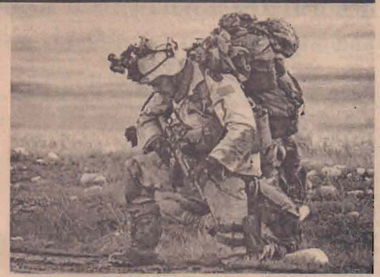
ஈராக்கின் வடபகுதியில் விமானங்கள் மூலம் கொண்டு சென்று தரையிறக்கப்பட்ட அமெரிக்கப் படைகள் மீது ஈராக் வியட்நாம் போர் படைகள் தன் உடைமைகளை மீட்கும் ஈராக் வியட்நாம் போர் படைகளின் கண்காணிப்பு ஒன்று தீப்பற்றி எரிவதையும் படங்களில் காணலாம்.

24 மணி நேரத்துக்குள் அண்மையில் பகுதியில் இடம்பெற்ற சண்டையில் 500 கட்டுப் படையினரைத் தாம் கொன்றதாகவும் 3 விமானங்