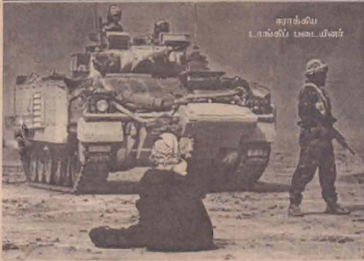
ஈராக் வியட்நாம் போர் படைகள்

வாஷிங்டன், மார்ச் 29 ஈராக் மீது தொடங்கப்பட்டுள்ள போர் நீண்ட காலத்திற்கு நீடிக்கும் என்று அமெரிக்காவும் பிரிட்டனும் கூட்டாக அறிவித்துள்ளன. தமது மக்களுக்காக வெளியிட்ட அறிக்கையில் இரு நாடுகளும் இணைந்து இந்த விடயத்தைத் தெளிவுபடுத்தி