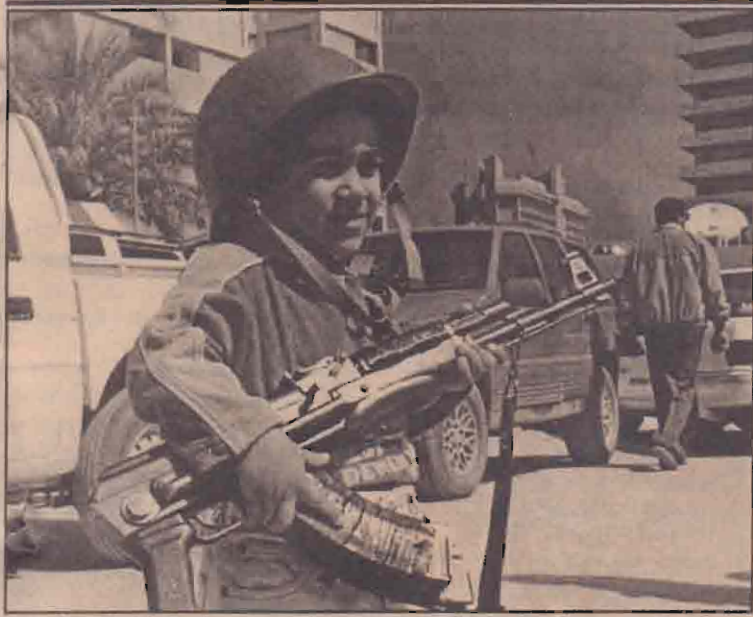
பக்தாத்தில் உள்ள தகவல்குறை அமைச்சுக்கு முன்பாக ஏ.கே.47 ரக குப்பாக்கைய தாங்கியவாறு நிற்கும் ஈராக்கிய சிறுவன் ஒருவன். (ஐ)