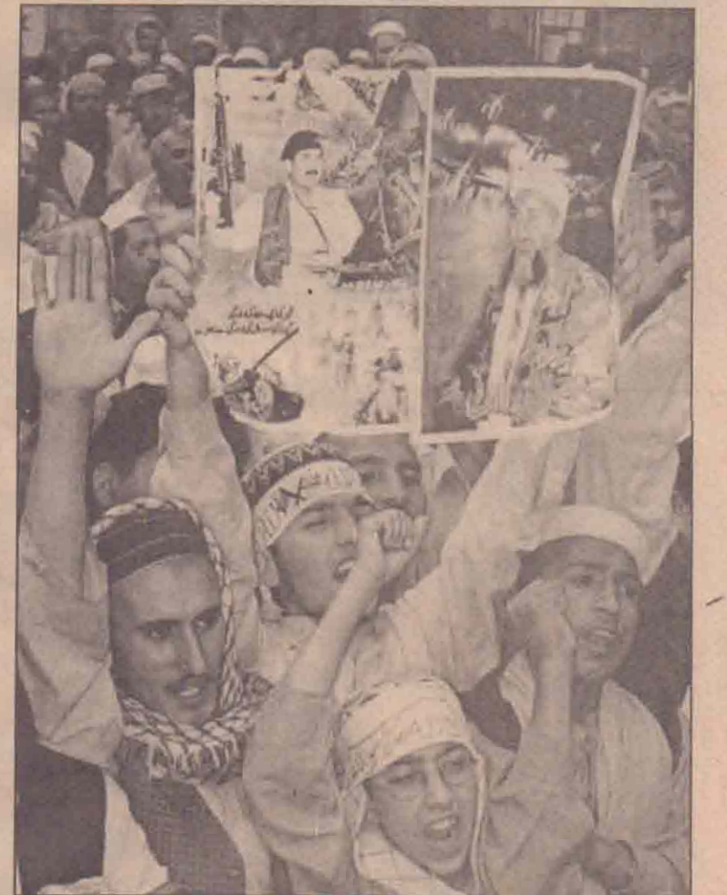
ஈராக் அதிர் சதாம் ஹுசைன், ஓலாமா பின் ஹேடன் ஆகியோரின் படங்களை தாங்கியவாறு அமெரிக்காவுக்கு எதிரான ஆர்ப்பாட்டத்தில் ஈடுபட்டிருக்கும் பாக்கித்தான் மாணவர்களையே படத்தில் காண்கிறீர்கள். கிந்த ஆர்ப்பாட்டப் பேரணி வடமேற்கு நகரான பெலாவரில் நடந்தது.

வாஷிங்டன், மார்ச் 30 ஈராக் படைகளுக்கு சிரியா இராணுவ உதவிகளை வழங்கி வருவதாக அமெரிக்கா குற்றஞ்சாட்டியிருக்கிறது. இதனை ஒரு போர் நடவடிக்கையாகவே அமெரிக்கா கருதுகிறது என்று அமெரிக்க பாதுகாப்புச் செயலர் டொனால்ட் ரம்ஸ்பீல்ட் தெரிவித்திருக்கிறார். ஈராக்கின் எல்லையில் சிரியா அமைந்துள்ளது. அந்நாடு ஈராக் படைகளுக்கு இராணுவ சாதனங்களை எல்லை தாண்டி விநியோகித்து வருவதாக அமெரிக்கா கூறுகிறது. அமெரிக்காவின் இந்தக் குற்றஞ்சாட்டை சிரியா மறுத்திருக்கிறது. ஈராக்கில் அமெரிக்கப் படைகள் மேற்கொள்ளும் இராணுவ நடவடிக்கைகளில் சிவிலியன்களுக்கு ஏற்பட்டுவரும் சேதங்களை உடன்கண் கண்களுக்கு மறைப்பதற்காக அமெரிக்கா இப்படி ஒரு பெயர்யைக் கூறுகின்றது - என்று சிரியாவின் அதிகாரபூர்வ வட்டாரங்கள் தெரிவித்திருக்கின்றன. கூட்டணி படைகள் பக்தாத்தை முற்றுகையிட்டால் அதிர் சதாம் ஹுசைன் தனது குடும்பத்தாருடன் சிரியாவுக்கு தப்பிச் செல்ல திட்டமிட்டிருக்கிறார் என்று பிரிட்டிஷ் பத்திரிகைகள் தெரிவித்துள்ளன. இதேவேளை - ஈராக்கிய படைகளுக்கு ஆதரவு தெரிவிக்கும் தனது பிரஜைகள், எல்லை தாண்டி ஈராக்கினுள் பிரவேசிப்பதற்கு ஈரான் அனுமதித்தது என்று அமெரிக்கா குற்றஞ்சாட்டி உள்ளது. (ஐ)