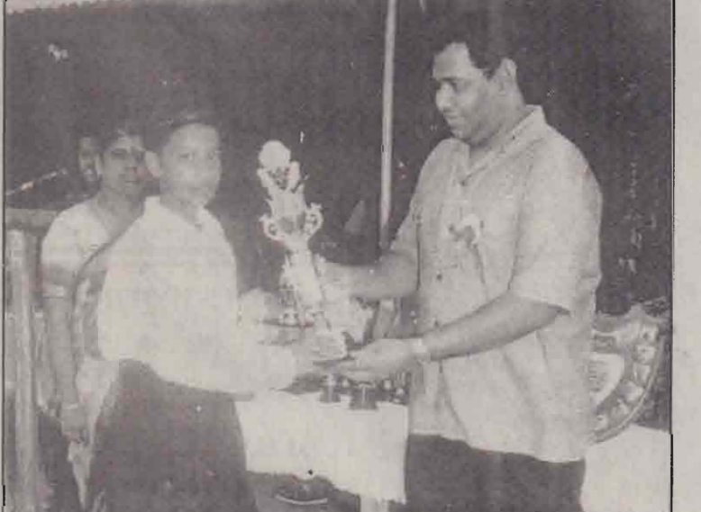
நெல்லியடி மத்திய மகளிர் கல்லூரியில் அண்மையில் நடைபெற்ற மெய்வன்மைப் போட்டிகளில் போது விளையாட்டு வீரங்கனையாகத் தெரிவு செய்யப்பட்ட தங்கவேலு கோடல்வார்க்கு யாழ்ப்பாணம் நூடாளுமன்ற உறுப்பினர் கஜேந்திரகுமார் வெற்றிக் கேடயத்தை வழங்குவதைப் படத்தில் காணலாம். அருகில் கல்லூரி உ.ப.அதிபர் திருமதி சோமசுந்தரம் காணப்படுகின்றார். (எ-15)

கொள்வனவு செய்யப்படும் அரிசிக்கான விலையை குழு ஒன்று நிர்ணயிக்கும். அக்குழுவில் ப.நோ.கூ.சங்கப் பிரதிநிதிகள், நுகர்வோர் பிரதிநிதிகள், மேலதிக அரசு அதிபர் ஆகியோர் அங்கம் வகிப்பார். நிவாரண விநியோகத்தில் 50 சதவீதம் அரிசியும், 25 சதவீதம் மாவு, 20 சதவீதம் சீனியும், 5 சதவீதம் பருப்பு வழங்கப்படவேண்டும் என்றும் - தெரிவிக்கப்பட்டது. (ஒ-3-10-173)