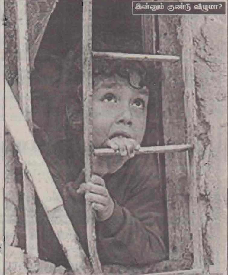
கின்னும் குண்டு வீழுமா?

கூறப்படுகிறது. பக்தாத் நகரில் அமெரிக்க விமானங்கள் விடிபவிடிய குண்டு வீசுவதைத் தொடர்ந்து இரவுநேரத்தில் பயணஞ் செய்பவென்பதால் என்று பொது மக்களுக்கு சாராக் அரசு தண்ட வந்தித் துள்ளது. மாலை 6 மணி முதல் காலை 6 மணிவரை பக்தாத் நகரை விட்டு வாகனங்கள் வெளியே செல்லக்கூடாது. நகருக்குள் வாகனங்கள் நுழையவும்கூடாது என்று அரசு தடை உத்தரவு பிறப்பித்திருப்பதாக சாராக் தொலைக்காட்சி தெரிவித்தது.