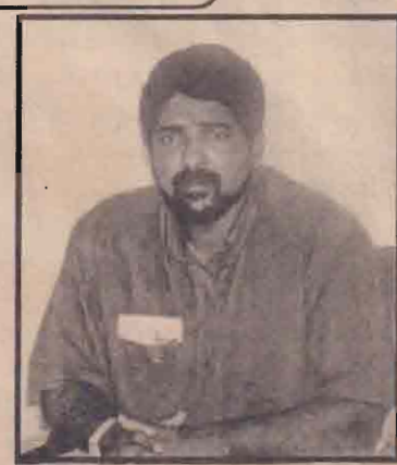
வேறு சின்னத்தில் போட்டியிட்டார்கள். தற்போது இரண்டு கட்சிகளுமே பிணைபட்டு சிதைந்து நிற்கின்றன. நான் இதனை எமது நாடாளுமன்ற உறுப்பினர்களுக்கு எடுத்துக் கூறியுள்ளேன் என்றார் அவர். (ஏ-86)

போது பாதுகாப்பு அமைச்சின் விவாதத்தில் அதனை எதிர்த்தோம். அதே போன்று எதிர்த்தே வாக்கும். அளித்தோம். எமது கட்சி இன்னும் ஒற்றுமையாகவும் பலமாகவும் இருக்கின்றது. நாம் அரசில் எந்த ஓர் அமைச்சர் பதவியையும் ஏற்றவர்கள் அல்ல. ஆனால், தொண்டமான் காலத்தில் சேவல் சின்னத்தில் போட்டியிட்டவர்கள் பிற்பாடு அரசுடன் இணைந்து கதிரை அல்லது யானைச் சின்னத்தில் போட்டியிடும் நிலைக்குத் தள்ளப்பட்டார்கள். அதேபோன்று ஸ்ரீலங்கா முஸ்லிம் காங்கிரஸ் ஆரம்பத்தில் மரச் சின்னத்தில் போட்டியிட்டு பின்னர் அரசுடன் இணைந்து மரச் சின்னம் தவிர்த்து