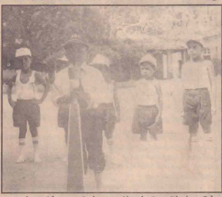
அண்மையில் நடைபெற்ற மாண்புமிகு கோவில்பற்று கிந்து சமய விருத்திச் சங்க முன்பள்ளி விளையாட்டு விழாவின்போது முன்பள்ளிச் சிறார்கள் ஒலிம்பிக் தீபம் ஏற்றுவதைப் படத்தில் காணலாம். (எ)