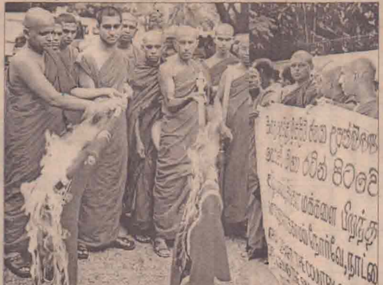
இலங்கைக்கான நோர்வேத் தூதுவரை நாட்டை விட்டு வெளியேற்றும்படி தேசிய பெளத்த பிக் குமார் முன்னணி நேற்று கொழும்பில் ஆர்ப்பாட்டம் ஒன்றை நடத்தியது. ஆர்ப்பாட்டத்தில் கலந்துகொண்ட பெளத்த பிக் குமார் நோர்வேயின் தேசியக்கொடிகளை தயிட்டுக் கொளுத்துவதைப்படுத்தல் காணலாம். (10)

கொழும்பு, டிசெ.24 தமிழீழ விடுதலைப் புலிகளின் பாவனைக்காக இறக்குமதி செய்யப்பட்டுள்ள அதி சக்திவாய்ந்த ஒலிபரப்புச் சாதனங்கள் தொடர்பான சகல உண்மைகளையும் மக்களுக்குத் தெரிவிக்க அரசு துறாராக இருக்கிறது. இது தொடர்பாக அரசு இன்னும் சில தினங்களில் விரிவான அறிக்கை ஒன்றை வெளியிடும் என்றும் அமைச்சரவைப் பேச்சாளர் பேராசிரியர் ஜி.எல்.பீரீஸ் நேற்றுக் கூறினார்.