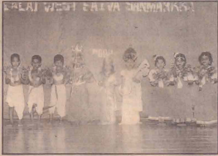
ஏழாலை மேற்கு சைவ சன்மார்க்க வித்தியாசாலையில் கிடம்பெற்ற கலை நிகழ்வில் தரம் 1 மாணவ, மாணவியர் வழங்கிய நகழ்ச்சியின்போது எடுக்கப்பட்ட படம். (ஒ)