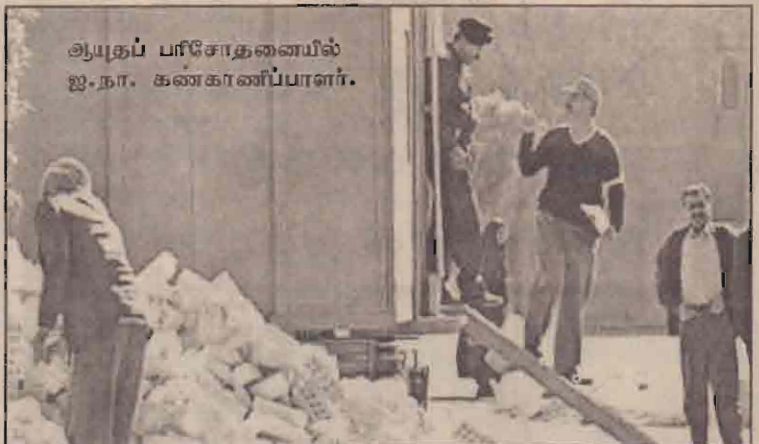
ஆயுதப் பரிசோதனையில் ஐ.நா. கண்காணிப்பாளர்.

அமெரிக்க மத்திய புலனாய்வுத்துறையான - சி.ஐ.ஏயின் பிரதிநிதிகள் ஈராக்கில் உள்ள சந்தேகத்துக்குரிய இடங்களில் ஆயுதக் கண்காணிப்பாளருக்கு உதவியாக இடம் அனுமதிப்பதாகவும் - அவர் மேலும் தெரிவித்திருந்தார். ஆனால், அமெரிக்க அதிகாரிகள் ஈராக்கின் இந்த அழைப்பை நிராகரித்து விட்டனர். அதிபர் பதவியிலிருந்து சதாம் ஹுசைனை அகற்றி யேரூஷலம் ஆயுதங்களை ஈராக்கிலிருந்து அப்புறப்படுத்தும் இறுதிக் கட்டத்தில் நாம் உள்ளோம். இந்த வேளையில் ஈராக்கின் இந்த நாடகத்தில் சிக்க மாட்டோம் என்று வெள்ளை மாளிகை பேச்சாளர் ஒருவர் தெரிவித்தார். இது ஒருபுறமிருக்க, கடந்த 25 நாட்களாக ஈராக்கில் யேரூஷலம் ஆயுதங்களை தேடி வரும் ஐ.நா. ஆயுதப்பரிசோதகர்கள் தமது பணியைத் தொடர்கின்றனர்.