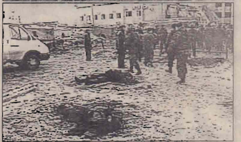
செச்சினியாவில் தற்கொலைத் தாக்குதலுக்கு உள்ளான கட்டடத்திலிருந்து காயமடைந்தோர் வெளியேற்றப்படுவதை மேற்படத்திலும், சம்பவ இடத்தில் இரு சடலங்கள் கருகிய நிலையில் கிடப்பதை கீழ்ப்படத்திலும் காணலாம்.