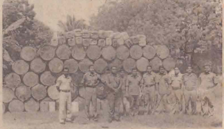
சுன்னாகம் பொலீஸார் கைப்பற்றிய கசிப்பு பரல்களுடன் பொறுப்பதிகாரி மற்றும் பொலீஸாரும் காணப்படுகின்றனர். (படம் : சுன்னாகம் செய்தியாளர்)