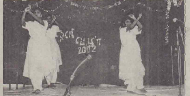
கல்லூர், நாற்கூரடி கல்விச்சேவை சபையின் ஒளிவிழா கடந்த 28 ஆம் திகதி கிபம் பெற்றது. அங்கு நடைபெற்ற கலை நிகழ்வுகளில் சிறப்புகளில் நடன நிகழ்ச்சியை படத்தில் காணலாம்.