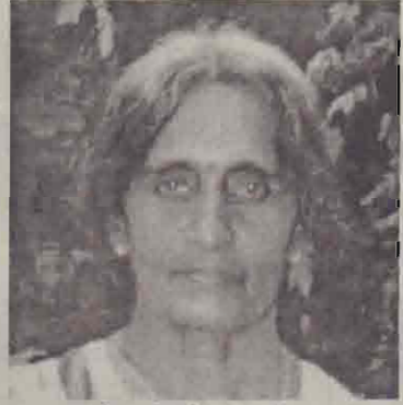
கண்காட்சிக்காக உழைத்த மாதர் சங்க பிரதமதி

எடுத்துச் சென்றிருக்கப்பட்டிருக்குமா? இந்தக் காட்சியை நேரில் பார்த்தவள் என்ற வகையில் என்னுடைய நிலை வேதனையும், கோபமும், நிக் கதித்தன்மையும் நிரம்பியது. வரலாற்றுச் சின்னங்களை நாமே விற்பனைக் கொண்டு எப்படித் தமிழர்களாகிய நாம் மறைக்கப்பட்ட எமது வரலாறு