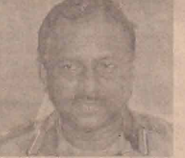
வேண்டும் என்பது உட்பட சில நிபந்தனைகளை விதிக்கும் அறிக்கை ஒன்றை யாழ்ப்பாணத்து தளபதி விடுத்திருந்தார். (16ஆம் பக்கம் பார்க்க)