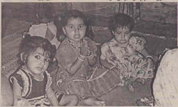
தமிழகத்தில் மறுகைகள் காப்பகம் ஒன்றில் வளர்ந்துவரும் அநாதரவான குழந்தைகள்..

வேறும் அரசியல் ஏமாற்றங்களாக தமிழக அரசு கொண்டுள்ள இந்தத் தடையால் சமூகத்தில் ஆதரவுற்ற பெண்கள் என்ற பிரிவு வேகமாக அதிகரித்து வருகிறது. இது எதிர்காலத்தில் பல சமூகச் சீக்கேடுகளை உருவாக்கும் என்று சமூகவியலாளர்கள் அச்சம் வெளியிட்டுள்ளனர். (ஓ)