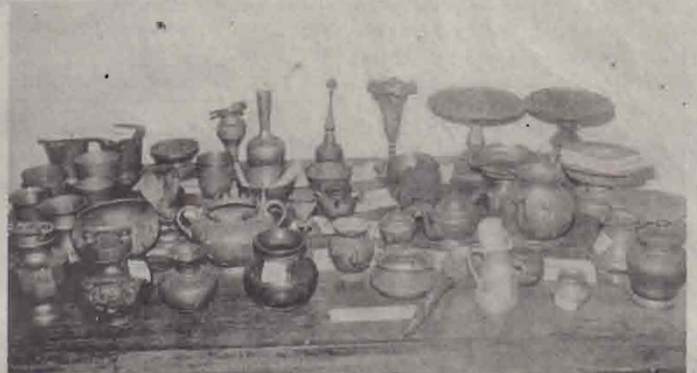
சங்கானையில் நடந்த கண்காட்சியில் காட்சிப்படுத்தப்பட்ட அரும்பொருள்கள்