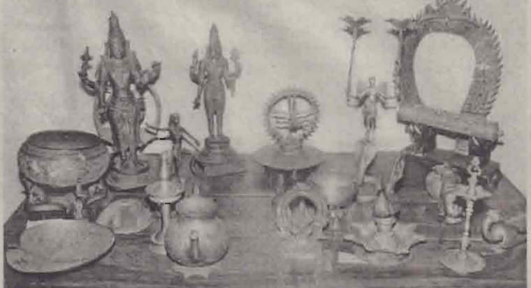
கண்காட்சியில் காட்சிப்படுத்தப்பட்ட விக்கிரகங்கள், பழைய பாத்திரங்கள், மாங்கல்யப் பொருள்கள்.

யில் மேற்கொள்வதன் பொருட்டு சங்கானை பிரதேச செயலகத்திற்குட்ட பட்ட அனைத்து பொது அமைப்புகளுக்கும் அழைப்பு விடுக்கப்பட்டிருந்தது. மேலும் அவர்களை ஊக்குவிக்கும் முகமாக சிறந்த முறையில் செயற்படும் அமைப்புகளுக்கு பரிசீலனையும் அறிவிக்கப்பட்டிருந்தன. இவ்வழைப்பையேற்று பல்வேறு சமூக அமைப்புகள், பாடசாலைகள், சிற்ப, ஓவியக் கலைஞர்கள் எனப் பல்வேறு தரப்பினரும் இக்காட்சியில் பங்கேற்றிருந்தனர்.