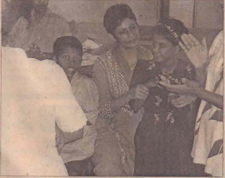
யாழ்ப்பாணம், மார்ச் 10. மீனவர்களின் சிறையில் அடைக்கப்பட்டிருள்ள தமிழக மீனவர்கள் 46 பேரும் இன்னும் விடுவிக்கப்படவில்லை என்றால் போராட்டம் தீவிரமடையும் என்று இராமேஸ்வரம் மீனவர்கள் சச்சரிக்கை விடுத்துள்ளனர்.

யாழ்ப்பாணம், மார்ச் 10 தமிழக் கூட்டமைப்பு எம்.பி.க்களின் ஏற்பாட்டில் இன்று முற்பகல் யாழ்ப்பாணம் செயலகம் முன்பாக அடையாள மறியல் போராட்டம் நடத்தப்பட்டது. முற்பகல் 10.30 மணி முதல் ஒரு மணி நேரத்துக்கு இப்போராட்டம் இடம்பெறும். தென்பகுதிச் சிறைகளில் உண்ணாவிரதம் மேற்கொண்டுவரும் தமிழக கைதிகளை விடுதலை செய்யக் கேறியும் அவர்களது போராட்டத்துக்கு ஆதரவு தெரிவித்துமே இன்று அடை (14ஆம் பக்கம் பார்க்க)