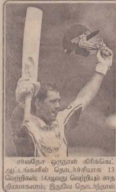
சர்வதேச ஒருநாள் கிரிக்கெட் ஆட்டங்களில் தொடர்ச்சியாக 13 வெற்றிகள்; 14ஆவது வெற்றியும் சாதகியமாகவும்; இதவே தொடர்ந்தால்