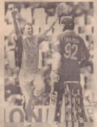
ஜெயவர்த்தனாவை வந்து (டக்) ஆக்கிய மஹேஸின் மூட்டல்

1999 ஆம் ஆண்டு கிரிக்கெட் உலகக் கிண்ண போட்டிகளில் இலங்கை அணி படுதோல்வி அடைந்தது அதன் பின்னர் அணியில் பல மாற்றங்கள் செய்யப்பட்டன. அணியில் பல இளம் வீரர்களுக்கு இடமளிக்கப்பட்டது. தலைமைத்துவத்திலும் மாற்றம் செய்யப்பட்டது. சனத் ஜயகுரிய தலைவராகவும் உப தலைவராக மஹேஸ் ஜெயவர்த்தனாவும் நியமிக்கப்பட்டனர். மஹேஸின் ஓட்டசாராளி 31 இற்கும் மேலே தனிப்பட்ட ரீதியில் அவர் திறமையான வீரர்தான். கடந்த காலங்களில் அவர் சிறப்பாகவே செய்திருந்தார். ஆனால், சிறந்த காலத்தின் பின்னர் மஹேஸின் ஆட்டத்தில் தோல்வி ஏற்பட்டது. இதை அடுத்து அவரின் உப தலைமையை தேர்வுஎன்கள் பறித்தனவீட்டனர். ஆனால், மஹேஸின் ஆட்டம் தற்போது மிக மிக மோசம். 'முருகுத பருந்து தானுக்கு உதவாது' எழுபதைப் போல மஹேஸும் தனது சாரத்தை நன்றாகக் கவனிக்கின்