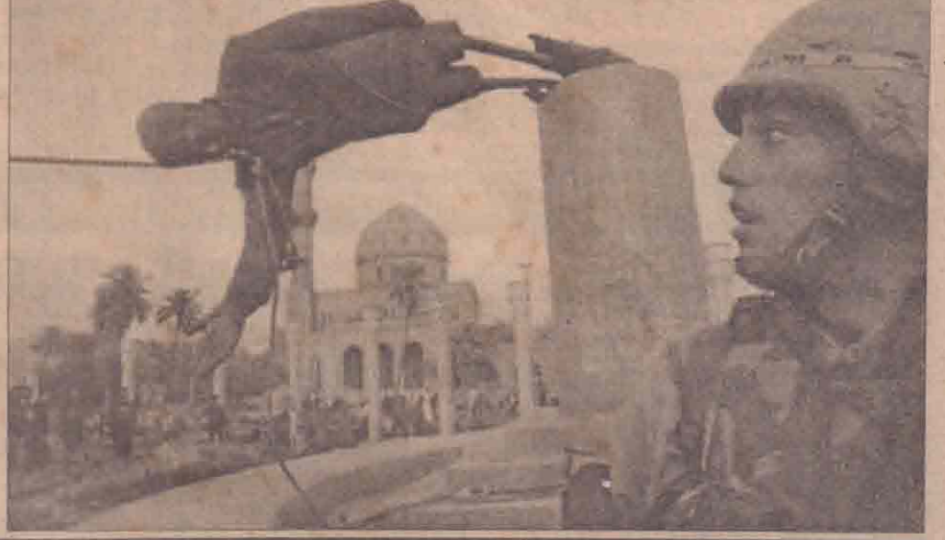
பக்தாத்த நகரின் மத்தியில் அமைந்திருந்த சதாம் ஹுசைனின் பிரமாண்டமான வெண்கல உருவச் சிலை சாய்த்து விழ்த்தப்பட்டுக் கிடக்கும் காட்சி.

சதாமின் ஆட்சி அதிகாரிகள் அனைவரும் பக்தாத்தை விட்டு வெளியேறிவிட்டனர் என்று அறிவிக்கப்படுகிறது. இதனை ஒரு வரலாற்று நிகழ்வு என்று வர்ணித்திருக்கிறார் அதிபர் புஷ்.