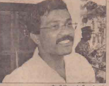
கிளிநொச்சி, ஏப்.10 தரையைப் போன்று கடலிலும் எமது கட்டுப்பாட்டுப் பிரதேசம் இருக்கின்றது. யுத்தநிறுத்த குழுவைப்