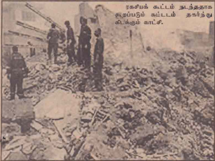
ரகசியக் கூட்டம் நடந்ததாக கூறப்படும் கூட்டம் தகர்ந்து கிடக்கும் காட்சி.

றார்கள் என்பதுதான் அந்த தகவல். உடனே அமெரிக்க போர் விமானம் ஒன்று அந்த இடத்திற்கு சீறிப் பாய்ந்து குண்டுகளை வீசியது. அந்த கூட்டம் தரைமட்டம் ஆனது. இந்த தகவலை அமெரிக்க ராணுவ அதிகாரி ஒருவர் உறுதி செய்தார். ஆனால், உண்மையிலேயே அந்த கூட்டத்தில் சதாம் இருந்தாரா? என்பது உறுதி செய்யப்படவில்லை. (ஏ)