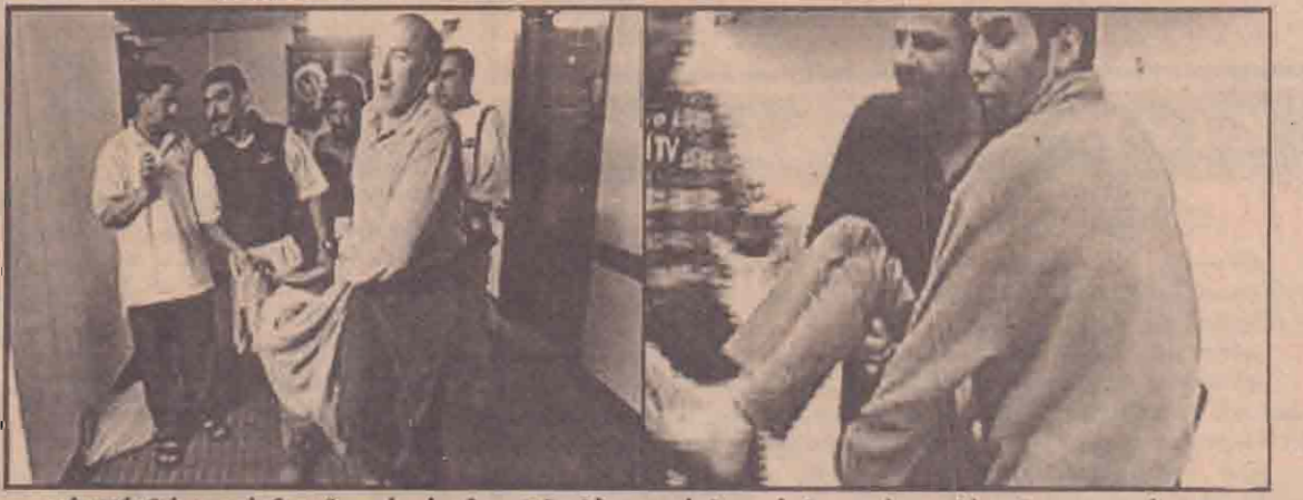
பக்தாத் தின் பலஸ்தீன ஹோட்டல் மீது அமெரிக்க டாங்கி நடத்திய தாக்குதலில் படுகாயமடைந்த ஊடகவியலாளர்களை அவர்களது சகாக்கள் ழாக்கி வந்தபோது எடுக்கப்பட்ட படங்கள்.

கடந்த நான்கு வருடங்களாக தொடர்ந்த உள்நாட்டுப் போரை முடிவுக்குக் கொண்டுவர தீவிரவாதிகளுக்கும், அரசுக்கும் இடையே சமாதான உடன்படிக்கை ஏற்படுத்தப்பட்டது. இந்த உடன்படிக்கையை தீவிரவாதிகள் முறித்துக்கொண்டதைத்தேடி இடப்படுகொலைகள் இடம்பெற்றன. கொங்கோவில் ஹேமரா இனத்தவருக்கும் லெண்டு இனத்தவருக்கு மிடையேயான நிலத்தகராறே அங்கு உள்நாட்டுப் போர் உருவாகக் காரணமாகும். இந்த உள்நாட்டுப்போரில் 50 ஆயிரம் மக்கள் உயிரிழந்தனர். தற்போதைய வன்முறை இடம்பெற்ற பகுதி, ஹேமரா இனத்தவர் பெரும்பான்மையாக வாழும் இடமென்றும் - தாக்குதல் நடத்தியவர்கள் லெண்டு இனமொழி பேசியதாகவும் - உள்நாடு அதிகாரிகள் தெரிவித்தனர். (ஏ)