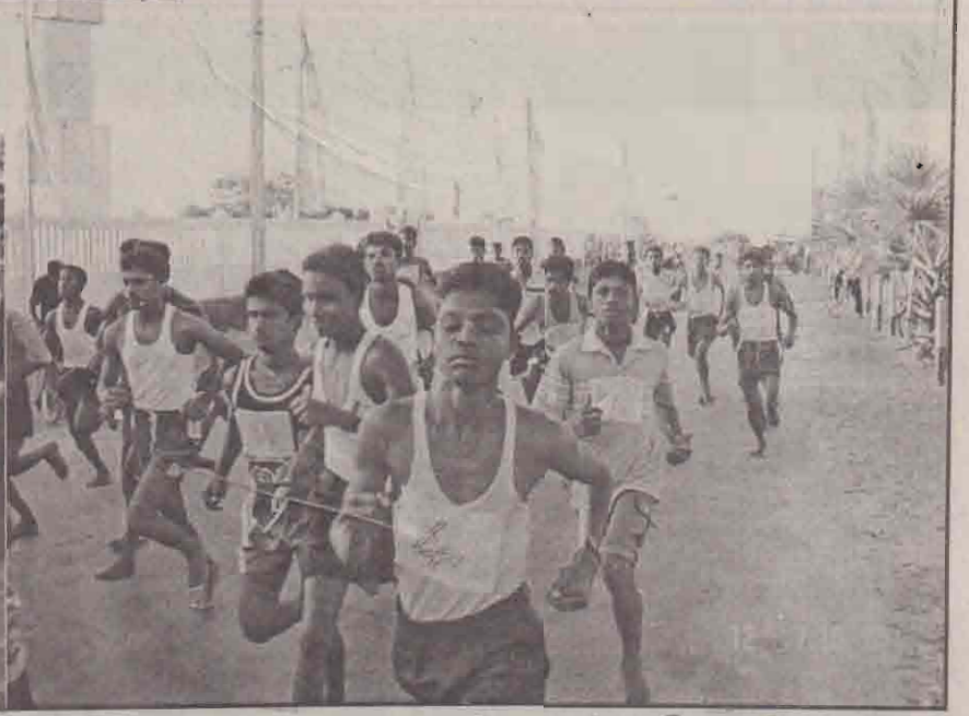
சக்தி எவ்.எம் நடத்தும் சீத்திரைப் புத்தாண்டு விழாவை ஒட்டி நேற்று நடத்தப்பட்ட மரதன் ஓட்டப்போட்டியின் போது எடுக்கப்பட்ட படங்கள்.