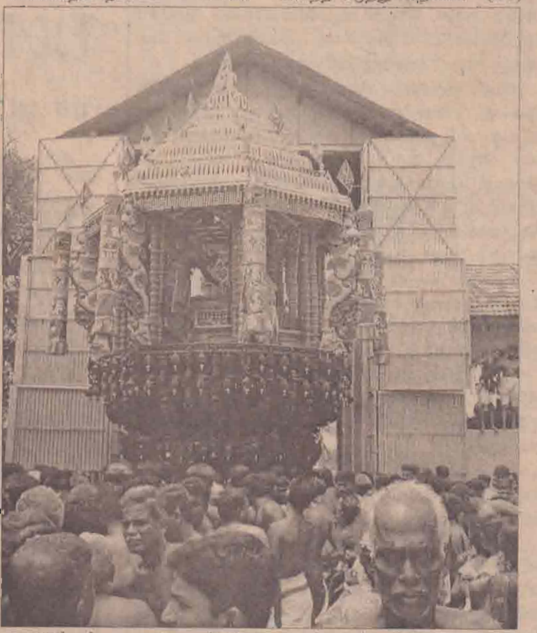
மாண்புமிகு மருத்துவ அமைச்சர் அலய வருடாந்த உற்சவத்தின் ரதோற்சவம் நேற்று பக்திபூர்வமாக நடைபெற்றது. பக்தர்கள் புடைசூழ்ந்துவர சுவாமி தேரில் வலம் வரும் காட்சி. (படம் : தேவராஜன்)

தள்ள அமைச்சர் மிலிந்த மொறகொட கடந்த வெள்ளிக்கிழமை டிக்கொனியைச் சந்தித்துக் கலந்துரையாடினார். அரசுக்கும் விடுதலைப் புலிகளுக்கும் இடையில் இடம்பெற்றுவரும் பேச்சுக்கள் முன்னேற்றகரமான திசையில் செல்கின்றன. நிச்சயம் பேச்சுக்கள் வெற்றியளிக்கும் என்ற நம்பிக்கை இரு தரப்பினருக்கும் உள்ளதென்று மிலிந்த அளிமீடம் தெரிவித்தார். எதிர்காலத் திட்டங்கள் மற்றும் பொருளாதார அபிவிருத்தி ஆகியன தொடர்பாக உப-ஜனாதிபதிக்கு மிலிந்த எடுத்துக்கூறினார். (10-3)