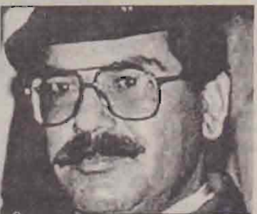
167. நாவல் விதி, யாழ்ப்பாணம்.