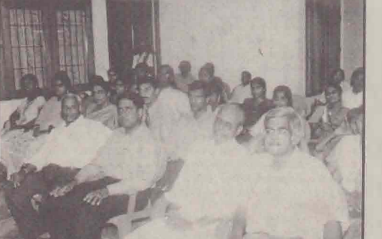
பரிசளிப்பு நிகழ்வில் கலந்துகொண்ட பிரமுகர்களில் ஒரு பகுதியினர்.