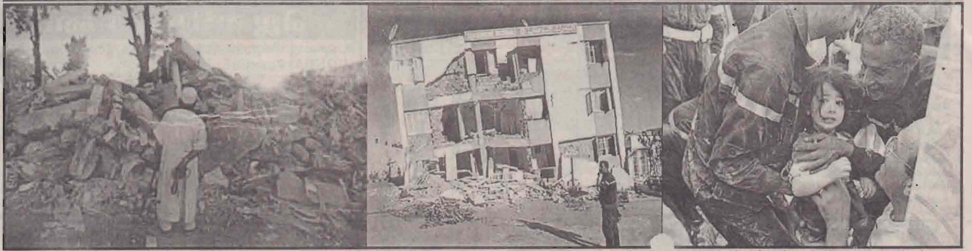
அல்ஜீரியாவில் ஏற்பட்ட நில நடுக்கத்தில் பக்குமாடகளைக் கொண்ட அரசு கட்டடம் ஒன்று தகர்ந்து கிடப்பதை முதல் படம், மீட்டிங் தனிமார் கட்டடம் ஒன்றின் நிலையை இரண்டாவது படத்திலும் இடிபாடுகளுக்கிடையே இருந்து கிரண்டு வயதுக் குழந்தை மீட்கப்படுவதைக் கடைசிப் படத்திலும் காணலாம்.