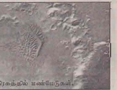
செவ்வாய்க் கிரகத்தில் பண்பேடுகள்.

செவ்வாய்க்கிரகத்தில் புகம்பப்பட்டகளை ஆராய்ந்தபோது அங்கு முன்பு உலங்களும் மணல் திட்டுகளும் உருவாகும், மறைவதும் கண்டறியப்பட்டுள்ளது. பனிப்பாசங்கள் இருப்பதால் அங்கு நீர் இருப்பது உறுதியாகியுள்ளது. இதேவேளை, மணல் திட்டுகள் உருவாவதற்கு காற்றின் வேகம் தேவையாகும். செவ்வாய்க்கிரகத்தில் மணல் திட்டுகள் உருவாகி மறைவது அங்கு காற்று வலுவை உறுதிப்படுத்தும்.