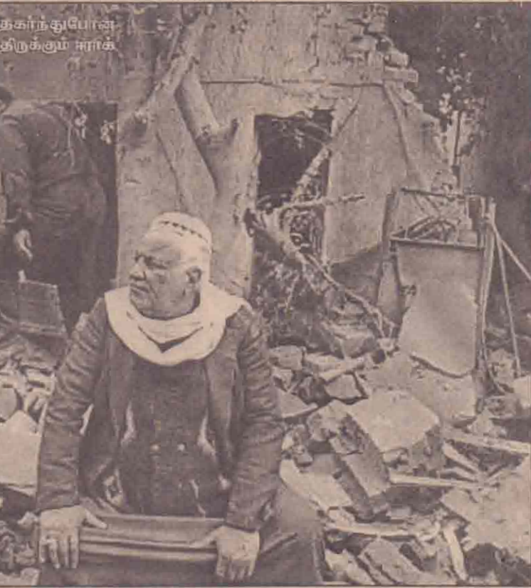
அமெரிக்க தாக்குதல்களில் தகர்ந்துபோன வீட்டின் முன் கிடங்குபோய் அமர்ந்திருக்கும் சராக்கிய முகிப்பவர்.

போரின் நேற்றைய நிலைவரங்கள் ★ தனது படையினர் மீதான அதிபர் சதாமின் கட்டுப்பாட்டைச் சீர்குலைக்க சராக்கிய தகவல் தொடர்பு அமைச்சகக் கட்டடம் தாக்கப்பட்டது. ★ சராக்குக்கு அதரவளிப்பதை நிறுத்தமாறு சிரியாவுக்கு அமெரிக்கா எச்சரிக்கை ★ கைவிடப்பட்ட சராக்கிய இராணுவ முகாமிலிருந்து நக்சவாடி இராசாயனங்களை மீட்டதாக அமெரிக்க இராணுவம் அறிவிப்பு. ★ தனது இரு வீரர்கள் போரில் உயிரிழந்ததாக பிரிட்டன் அறிவிப்பு ★ பஸ்ரா நகரைக் கைப்பற்றும் தனது பலநாள் முயற்சியைப் பிரிட்டிஷ் படையினர் தொடர்ந்தனர்.