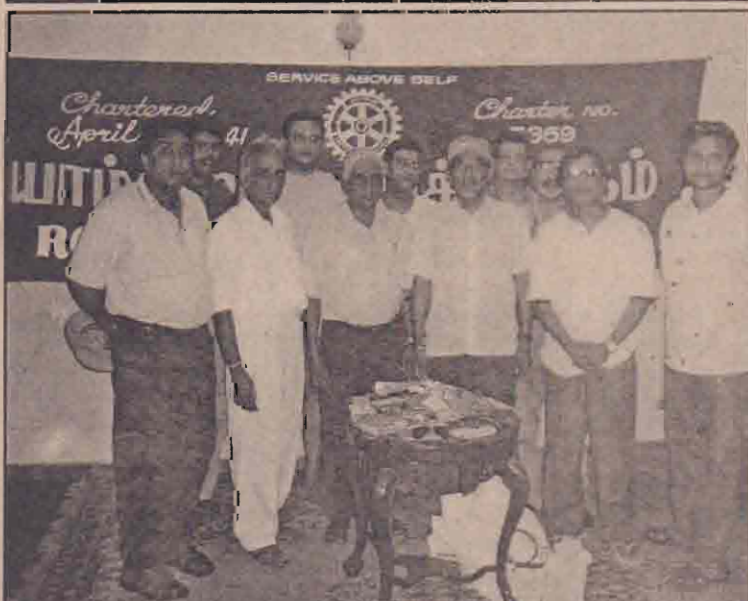
யாழ்ப்பாணம் வந்த கண்டி பெற்றோர் போலீற்றன் றோட்டிற்கு கழு கத்தினர் யாழ்ப்பாணம் ரோட்டிற்கு கழுக்கத்திற்கு ஒரு தொகுதி முக்குக் கண்ணாடிகளை அன்பளிப்புச் செய்த போது எடுக்கப்பட்ட படம். நோர்லீவ மக்களால் சேகரித்து அனுப்பப்பட்ட முக்குக் கண்ணாடிகளே அன்பளிப்பாக வழங்கப்பட்டன.