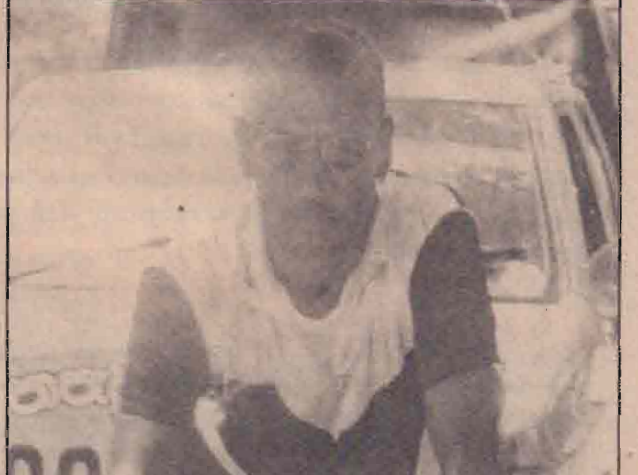
சாதனைகள் புரிந்த ஒரு சிறந்த வீர வரலாறு மறைந்திருப்பதைக் கண்டேன்.

'ஹெயஸ்' வானில் சுற்றுலா வருபவர்களுக்கு யாழ்ப்பாணத்தின் இடிந்த கட்டடங்களும், அழிந்த இயற்கையழகும் தொல்பொருள்களாகவும் காட்சிப் பொருள்களாகவும் தென்படும். அங்கெல்லாம் வாழ்ந்த மக்கள் பட்டிருக்கக் கூடிய அவலங்களைச் சில நிமிடங்கள் கண்புடி சிந்தித்தால் கண்ணீர் வரும். எனக்கு அப்படியான சோக வரலாற்றினைக் கடந்தவரும் சைக்கிள் சுற்றுலா வந்தபோது உணரக்கூடியதாக இருந்தது. இதனாலேயே இன்று இலங்கை முழுவதும் சமாதானத்தினை வலியுறுத்தி என் உடல் உளைச்சலையும் பொருட்படுத்தாது இச் சுற்றுலாவினை மேற்கொள்கின்றேன். மக்கள் மீண்டும் மீண்டும் சமாதானத்திற்காக ஏதோ ஒரு வகையில் குரல் கொடுத்தவண்ணமும், அதற்காக ஏதோ ஒரு நிகழ்வை நடத்திய வண்ணமும் இருத்தல் வேண்டும். அப்போதுதான் சமாதானம் விரைவாக மலரும் - என்று அவர் தெரிவித்தார். (9-12)