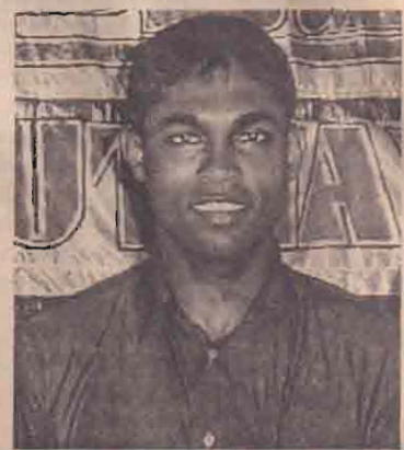
சேவையை நாம் இன்னும் நீண்ட காலத்திற்கு பெற்றுக்கொள்ளவேண்டாம்.

தாவது- சார்ஜா சுற்றுலாவுக்கான இலங்கை அணி இளையவர்களுக்கு வாய்ப்பளிக்கும் முகமாக தெரிவுசெய்யப்பட்டுள்ளது. அதில் கருவிதரன் இல்லை என்றவுடன் அவரை நாம் மறந்துவிட்டோம் எனக் கருதமுடியாது. அவரது