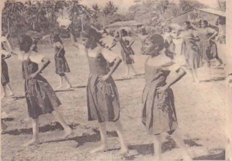
நாயன்மார்கட்டு மகேஸ்வரி வித்தியாலயத்தின் வருடாந்த கில்ல மெய்வன்மைப் போட்டிகளில் மாணவிகள் வழங்கிய உடற் பயிற்சி நிகழ்ச்சியினைப் படத்தில் காணலாம்.