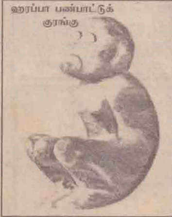
ஹர்ப்பா பண்பாட்டுக் குரங்கு

இதுதவிர இலச்சினைகளில் காணப்படும் புடைப்புச் சிற்பங்களான அக்கால கலைவடிவங்களில் முக்கிய சிறப்பும் பெறுவதைக் காணலாம். இந்தப் புடைப்புச் சிற்பங்களாக