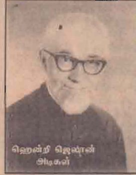
ஹென்ட் ஜெபான் சிகர்கள்

இலங்கையில் போர்த்துக்கேயர் ஆட்சியின் கீழ் பல இடங்களிலும் கோட்டைகள், மாளிகைகள், வதி விடங்கள் அமைக்கப்பட்டது போல யாழ்.நகரில் இருந்து வடக்கே பத்து மைல் தொலைவில் உள்ள பண்டத்த ரிப்பிலும் ஒரு போர்த்துக்கேய வதி விடம் இருந்ததாக நம்பப்படு கிறது. போர்துக்கேய வதிவிடங்களின் முன்பாக போர்த்துக்கிலிருந்து கொண்டு வரப்பட்ட மரங்களை நட்டு வளர்த்துப் பாதுகாத்தனர். அவ்விதம் அவர்களால் நாட்டப்பட்டதே இராசமுருக்கு மரம்.