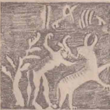
கொம்பு மன்தனும் கொம்பு புலியும்

கலை மரபையும் எடுத்துக்காட்டுகின்றன. வெண்கலத்தாலான ஆட்களின் உருவம் இக்கால கலை வடிவங்களில் குறிப்பிடத்தக்க ஒன்றாகும். இந்த ஆட்கள் மாதவின் இடது கை முழுவதும் வளையல்கள் காணப்படுவதும், கழுத்தில் யாலை அணிந்திருப்பதும் தலைமுடியை சிக்கலான முறையில் ஒப்பனை செய்திருப்பதும் அக்கால அழகியற் கலையின் சிறப்பைத் தெளிவாகக் காட்டுகிறது. இந்த வெண்கலச் சிலையும்,