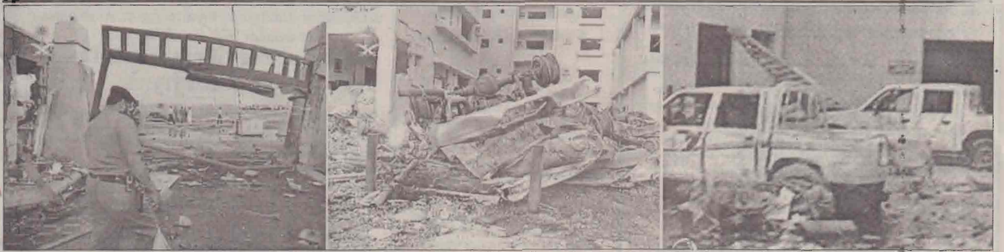
சவுதியில் குண்டுத்தாக்குதல்கள் இடம்பெற்ற இடங்களில் கட்டடங்கள், வாகனங்கள் சீதைந்து கிடக்கும் காட்சி.

அமெரிக்கர் உட்பட 10பேர் பல! 50பேர் காயம்!! கட்டடங்கள் தகர்ந்தன!!!