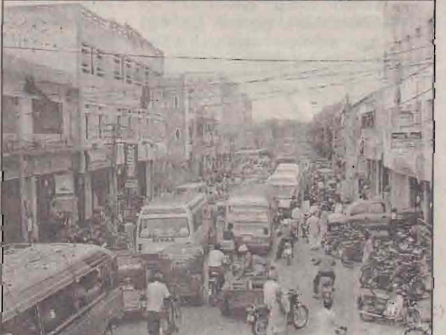
யாழ்.நகரம் மெல்லமெல்ல போக்குவரத்து நெரிசல் மீதும் நகரமாக மாறிவருகிறது. குறிப்பாக ஸ்ரான்ஸ் வீதி, ஆல்பத்தீர் வீதி, கஸ்தூரியார் வீதி, கே.கே.எஸ். வீதி என்பவற்றில் வாகன நெரிசல் அடிக்கடி ஏற்படு கின்றது. ஸ்ரான்ஸ் வீதியில் நேற்றுமுன்தினம் காலை நெரிசல் ஏற்பட்டு போக்கு வரத்து சீர்கு நேரம் ஸ்தம்பித்திருந்தபோது எடுக்கப்பட்ட படம்.