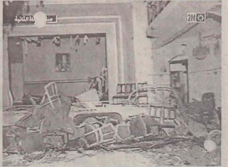
தாக்குதலில் சேதமடைந்த கட்டடம்.

இதில் பலியான அமெரிக்க நாட்டினர்கள் எத்தனை பேர் என்பது இன்னும் சரியாக தெரியவில்லை. இந்த வெடிகுண்டுத் தாக்குதல் தொடர்பாக இதுவரை 3 பேரை மொரோக்கோ பொலீஸார் கைது செய்துள்ளனர். (ஐ)