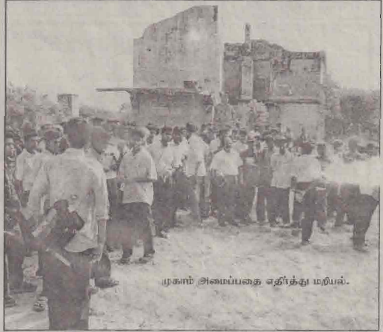
முகாம் அமைப்பதை எதிர்த்து மறியல்.

இருப்பினும், நகரிலிருந்து சற்று ஒதுக்கப்பட்டிருக்க - கடற்கரைப் பகுதியை அண்டி - கல்லணைப் பள்ளி என்ற இடத்தில் முகாமம் அமைக்கலாம் என்று சில தரப்புகள் ஆலோசனை தெரிவித்தபோதிலும் அங்கு நேரடியாகச் சென்று நிலை