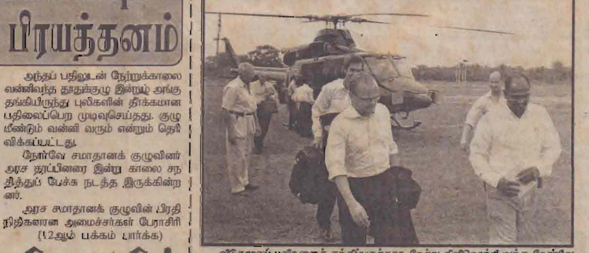
விடுதலைப் புலிகளைச் சந்திப்பதற்காக நேற்று கிளிநொச்சி வந்த நோர்வே பிரதி வெளிவிவகார அமைச்சர் விடர் ஹெல்கிஸன் (இடது) கிளிநொச்சி மைதானத்தில் வழிநடையவும் புலிகளின் சமாதான செயலக செயலாளர் புலித்தேவனாஸ் (வலது) அரண்மனை நடுவில் பணியகத்துக்கு அழைத்துச் செல்லப்படுகிறார். (ம.கே.என்.)

கொழும்பு, மே 18 இரத்தினபுரி, காலி, மாத்தறை பகுதிகளில் நேற்றுமுன்தினம் காலைமுதல் பெய்யும் தொடர்மழை காரணமாக பெரும் வெள்ளம் ஏற்பட்டுள்ளது. வெள்ளத்தில் சிக்கி 7 பேர் உயிரிழந்தனர். நேற்றுமுன்தினம் காலைமுதல் இரத்தினபுரி மாவட்டத்தில் தொடர்ந்து பெய்துமழை மழை காரணமாக தாழ்ந்த பிரதேசங்களில் வெள்ள அபாயம் ஏற்பட்டுள்ளது. நகரப் பகுதியில் 6 அடி உயரத்துக்கு வெள்ளம் பாய்வதாகவும், தொடர்ந்து மழை பெய்வதால் வெள்ளம் (12ஆம் பக்கம் பார்க்க)