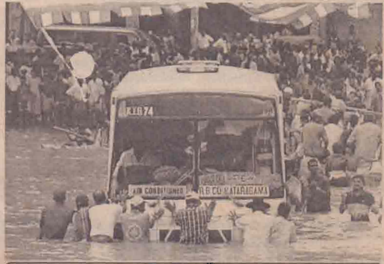
இரத்தினபுரி நகரப் பகுதி வெள்ளக் காடாக காணப்படும் காட்சி.

சடலங்களை மீட்கும் பணிகள் மண்சரிவு ஆபத்துக்களால் தேற்று கைவிடப்பட்டன. இந்த மண்சரிவில் 75 பேர் புதைபண்டனர். கலந்துறையில் வெள்ள மட்டம் அதிகரித்துக் கொண்டிருப்பதாக கலந்துறையினர் (14 ஆம் பக்கம் பார்க்க)