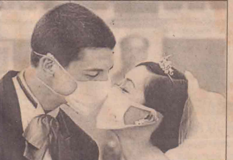
சீனாவில் சரால் நோய் பரவியிருப்பதால் தலைநகர் பெய்ஜிங்கில் கிருமணமான மணமகனும், மணப்பெண்ணும் முகமூடி அணிந்து முதலாம் பரிமாறிக் கொள்கின்றனர்.

உலகிலேயே மிக உயர்ந்த சிகரமான எவரெஸ்ட் சிகரத்தின் மீது எம்மண்ட்ஹிலாரி, மற்றும் டென்சிங் ஆகியோர் முதல் முதலாக ஏறி சாதனை படைத்தனர். இந்த சாதனை ஏற்படுத்தப்பட்ட 50 ஆவது ஆண்டு பொன்விழா அடுத்த வாரம் நடைபெறுகிறது. இதையொட்டி நேபாள அரசு