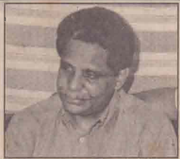
இந்தியாதான் முதுகில் குத்திவிட்டது. சமாதானப் பேச்சுக்களில் ரணில் மீது எவ்வளவு விசுவாசம் கொள்வது என்பதைவிட தமிழர் விடுதலைக் கூட்டணி பற்றித்தான் சிந்திக்க வேண்டியிருக்கிறது.

இந்தியா முதுகில் குத்திவிட்டது மறைந்த தலைவர் சிரீ சபாரத்தினம் உண்மையாக உழைத்ததுடன் இரண்டு விடயங்களில் மிகவும் உறுதி வாய்ந்தவராகக் காணப்பட்டார். ஒன்று தமிழ் இனத்தின் அனைத்துத் தரப் பிணையும் ஒற்றுமைப்படுத்திச் செயற்படுத்தல், மற்றொன்று தமிழ் இனத்தின் அரசியல் அபிவிருத்திகளை இந்தியாவின் உதவியுடன் வென்றெடுத்தல். இவற்றில் தமிழ் இனத்தின் ஒற்றுமை இன்று பெருமளவில் நிறைவேறிவிட்டது. ஆனால், நம்பியிருந்த