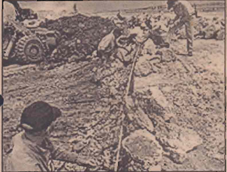
பக்தாத் சர்வதேச விமான நிலையத்தில் புனரமைப்பு பணியில் ஈடுபட்டுள்ள அமெரிக்கர்கள்

ஐ.நா. பாதுகாப்புச் சபையில் சமர்ப்பித்திருந்தது. ஆனால், அதனை மற்ற நாடுகள் கடுமையாக விமர்சித்திருந்தன. இதனையடுத்து அத்திட்டவரைவை மீள்பெற்ற அமெரிக்கா அதனை மீள் பரிசீலனை செய்து மறுபடியும் சமர்ப்பித்துள்ளது. புதிய திட்டவரைவில் ஈராக்கில் புதிய அரசு அமைப்பதில் ஐ.நா.வின் பங்கை ஏற்றுக்கொண்டுள்ள அமெரிக்கா முத்தூறடவையாக ஐ.நா. ஆயுதக் கண்காணிப்பாளர்கள் பற்றியும் குறிப்பிட்டுள்ளது.