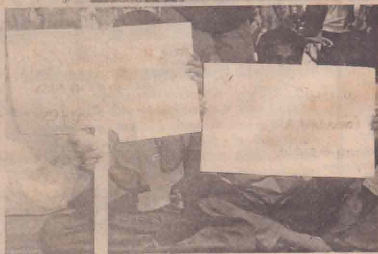
வலி வடக்குப் பகுதியில் மீள்குடியமர அனுமதிக்குமாறு கோரி நேற்றுக் காலைமுதல் யாழ். செயலகம் முன்பாக ஆயிரக்கணக்கான மக்கள் கூடி மறியல் போராட்டத்தில் ஈடுபட்டபோது எடுக்கப்பட்ட படங்கள் இவை. செயலக வாயிலில் மக்கள் அமர்ந்திருந்து மறியலில் ஈடுபடுவதையும், கண்டிவீதியில் இடம்பெற்ற மறியலை அடுத்து கிராமுவ பவள கவசவாகனம் ஒன்று திரும்பிச் செல்வதையும் பதாகைகளைத் தாங்கியவாறு போராட்டக்காரர்கள் அமர்ந்திருப்பதையும் படங்களில் காணலாம்.