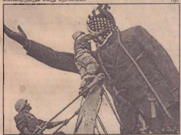
ஈராக்கில் சதாம் ஹுசைன் சிலை ஒன்று அகற்றப்படுகிறது

பட்டுள்ளது. ஐ.நா.வின் 'உணவுக்காக எண்ணெய்' திட்டத்தை ஈராக்கின் 6 மாதக் களுக்குத் தொடரலாம் என்று புதிய வரைவு வரையறுக்கின்றது. முன்னர் இது 4 மாத காலமாக இருந்தது. இத்தக்கால நீட்டிப்பு, 'உணவுக்காக எண்ணெய்' திட்டத்தின் கீழ் சதாமுடன் ஒப்பந்தங்களை ஏற்படுத்திய ரஷ்யாவுக்கு சிறுது ஆறுதல் அளிக்கக்கூடும். ஈராக்கின் பெரும் கடன் கமையை குறைப்பதில் பல தரப்புகளும் ஒத்திழைக்க வேண்டுமென புதிய வரைவு கூறுகிறது. இதனைக் காரணம் காட்டி ஈராக்குக்கு ரஷ்யா வழங்கிய கடன்களை திருப்பிச் செலுத்தத் தேவையற்ற நிலை உருவாகக் கூடுமென்று ரஷ்யா அக்கிரகித்தது.