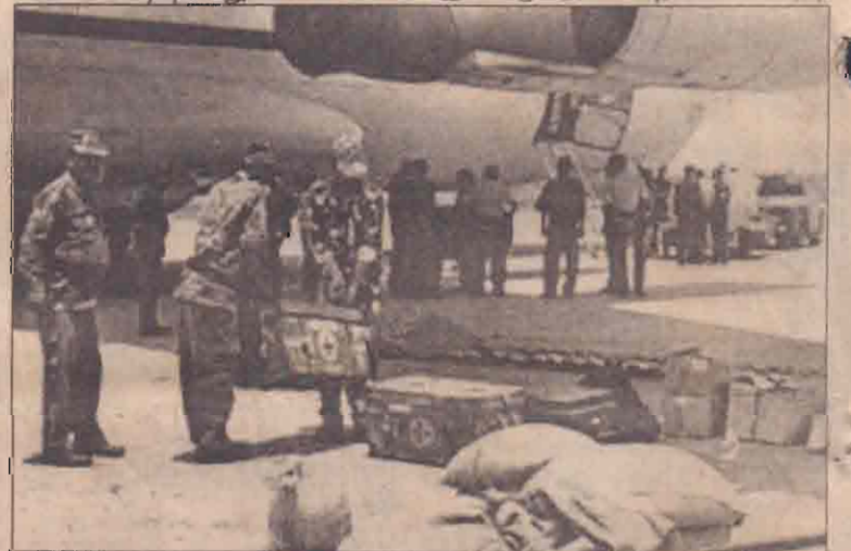
வெள்ளத்தால் பாதிக்கப்பட்ட மக்களுக்கு உதவுவதற்கென கிந்தியாவிலிருந்து கிரானூவத்தவர் வந்துள்ளனர். அவர்கள் கட்டுநாயக்கா விமான நிலையத்தில் வந்திறங்கிய காட்சி.

படுகின்றன. வெள்ளத்தால் பாதிக்கப்பட்ட பகுதிகளில் இன்னும் சில தினங்களில் சுகாதார சேவைகளை ஆரம்பிக்கவேண்டியுள்ளது. வெள்ளம், மண்சரிவு காரணமாக 100 கோடி ரூபா பெறுமதியான சொத்துக்கள் முற்றாக அழிந்துள்ளன. இவ்வாறு அவர் கூறினார். (எ)