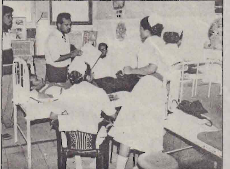
மானிப்பாய் நோட்டரக்ட் கழக உறுப்பினர்கள் கடந்த மாத கிறித்தமில் யாழ்ப்பாணத்தை வைத்தியசாலையில் கிரத்ததானம் செய்தனர். அட்டு அங்கத்தவர்கள் கிவ்வாறு கிரத்ததானம் வழங்கினார்கள். அப்பொழுது எடுக்கப்பட்ட படம்.