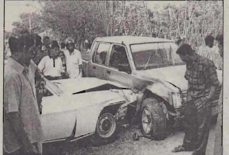
நேற்று பிற்பகல் நல்லூர் முத்திரைச் சந்தக்கு அண்மையில் பருத்திக்குறை வீதியில் கிரண்டு வாகனங்கள் மோதி விபத்துக்குள்ளாகின. ஈ.பி.டி.பி.யினர் பிக்கப் வாகனம் ஒன்றும் அந்தியகால சேவை நிறுவனம் ஒன்றுக்குச் சொந்தமான வாகனமும் மோதி விபத்துக்குள்ளாகின. அந்தியகால சேவை நிறுவனத்தின் வாகனத்தைச் செலுத்தி வந்த சாரதி காயமடைந்தார். கிரு வாகனங்களின் முன் பக்கங்களும் மாரிய சேதத்துக்குள்ளாகின. பருத்திக்குறை வீதியின் நடுவே விபத்துக்குள்ளான கிரு வாகனங்களும் அப்படியே நற்பதை பா.பி.டி.யினர் காணலாம். சம்பவம் நடைபெற்ற கிடத்துக்கு போக்குவரத்து பொல்லாரர் சென்று விசாரணைகளை மேற்கொண்டனர்.

"கடந்த புதன்கிழமையன்று பிரதமருக்கு நான் எழுதிய கடினத்தில், இடைக்கால நிர்வாக அமைப்புப் பற்றிய இறுதி வடிவத்துக்கு வருவதற்காக எத்தனை சுற்றுப் பேச்சுக்களை நடத்தி இருந்தோம் என்று குறிப்பிட்டிருந்தேன். ஆனால் தற்போது இதுபற்றிப் பேசவேண்டிய நிலையிலேயே அரசு மீண்டும் இருப்பதால் அது குறித்து மட்டுமே எம்மால் பேசமுடியும்" - என்றும் பாலசிங்கம் கூறினார்.