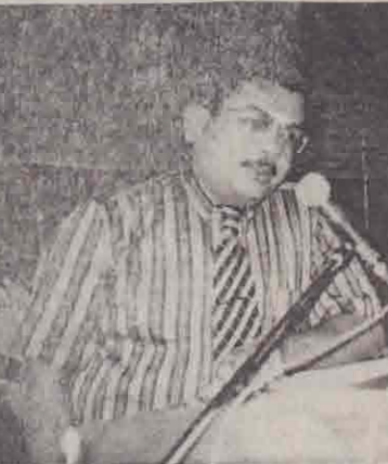
யாழ்ப்பாணம், ஜூன் 8 தமது பதவி அந்தஸ்தைப் பயன்படுத்தி சிறுவர் பாலியல் துஷ்பிர