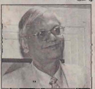
மாநாடு நடைபெறவிருக்கும் டோக்கியோ 'அகாசாகா பிரின்ஸ்' ஹோட்டலில் - மாநாட்டுக்கு, சுமார் 36 மணித்தியாலங்களுக்கு முன்னர் - அவர் இந்தப் பேட்டியை அளித்தார். "இடைக்கால நிர்வாகம் தொடர்பான பிரச்சினை காரணமாகவே இந்த மாநாட்டில் தாங்கள் பங்குபற்றவில்லை என்ற புலிகள் அறிவித்துள்ளனர். புலிகள் பங்குபற்றாமல் விட்டமைக்கு வேறு (13ஆம் பக்கம் பார்க்க)