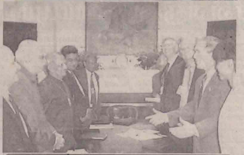
கிந்திய துணைப் பிரதமர் எல்.கே.அத்வான் அமெரிக்காவுக்கு விஜயம் செய்துள்ளார். வெள்ளை மாளிகையில் செவ்வாயன்று அவர் அமெரிக்க பாதுகாப்புத்துறை ஆலோசகர் கொன்டலீஸா ரைட்லைச் சந்தித்துப் பேசினார். அப்போது சம்பிரதாயங்கள் அனைத்தையும் புறந்தள்ளி வைத்துவிட்டு அதிபர் புஷ் அங்கு வந்து அத்வானியைச் சந்தித்துப் பேசினார். அப்போது எடுக்கப்பட்ட படம் கிது.

அமெரிக்கா ஐராவை ஒரு வெளிச் சக்தியாகவே பார்க்கின்றது என்று கூறும் பிளிக்ஸ் இன்னும் சிறிது காலத்தில் ஐ.நா.வின் செல்வாக்கு தாழ்ந்து மறைந்துவிடும் என்றும் தெரிவித்தார்.