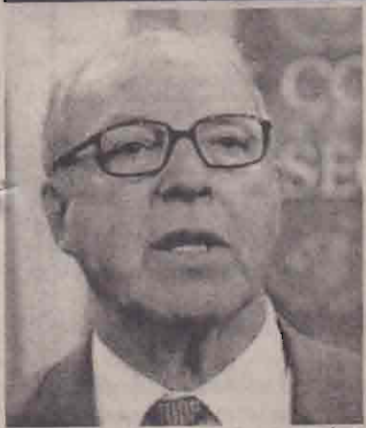
லண்டன், ஜூன் 12

அமெரிக்கப் பாதுகாப்புத் தலைமையகமான பென்ரகனைச் சேர்ந்த அதிகாரிகள் சிலரை 'பாஸ்டேர்ஸ்' (முறைவழிப் பிறந்தவர்கள்) என்று ஐ.நா. ஆயுதப் பரிசோதனைக் குழுத் தலைவர் ஹன்ஸ் பிளிக்ஸ் திட்டிடுகிறார்.