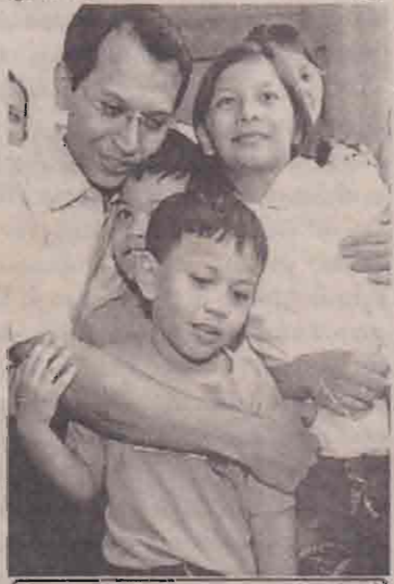
2 ஆண்டுகள் சிறைவாசத்துக்குப் பின்னர் விடுதலையாகிய மலேசிய எதிர்க்கட்சித் தலைவர் கிஸம் முஹமது நூர்கன் புகல்வர்களுடன் கிடுக்கும் கடைசி. அட்சணை கவிழ்க்க சதி செய்துக்கொண்ட கிஸம் முஹமது கைது செய்யப்பட்டார்.

ரஷ்யாவில் மதுப்பழிமைவாதிகள் 120 பேர் கைது செய்யப்பட்டுள்ளனர். அவர்களில் சிலர் ஆய்காணிஸ்தானில் அல்கொலா அமைப்பின் பயிற்சி பெற்ற அரசியல்கள் என்று தெரிகின்றது. ரஷ்யாவின் தேசியத்தின் இன்று. அதனை முன்னிட்டு நாட்டின் பாதுகாப்பு பலப்படுத்தப்பட்டுள்ளது. பொலீஸார் மேற்கொண்ட முன்னெச்சரிக்கை நடவடிக்கையின் போதே இவர்கள் கைதுக்கினர். மூட்டப்பட்ட தொழிற்சாலை ஒன்றுக்குச் சொந்தமான குடியிருப்பு பகுதியில் இவர்கள் தங்கியிருந்துள்ளனர். இவர்களிடம் இருந்து ஆயுதங்கள், கைக்குண்டுகள், பிளாஸ்டிக் வெடிப் பொருள்கள், வெடிக்கவைக் கும்பகருவிகள் மற்றும் துண்டுப்பிரகாரங்கள் என்பன கையாடப்பட்டுள்ளன.