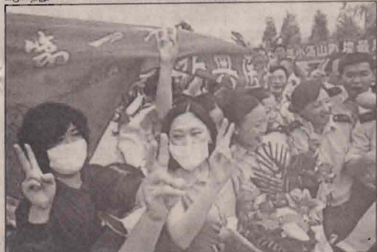
சீனாவில் பரவி வந்த சார்ஸ் முற்றிலுமாக ஒழிந்துவிட்டது. சினியாள் வேண்டுகோளும் சீனாவுக்கு தாராளமாக செல்லலாம் என்று உலக சுகாதார அமைப்பும் கூறிவிட்டது.

பீஜிங் நகரில் 'சார்ஸ்' நோய்க்கு சிகிச்சை முடிவாகிக்கொண்ட கடைசி வெற்றிக் குழுவின் ஆட்டம் பாட்டம் கொண்டாட்டத்துடன் வெளியே வந்த காட்சி.