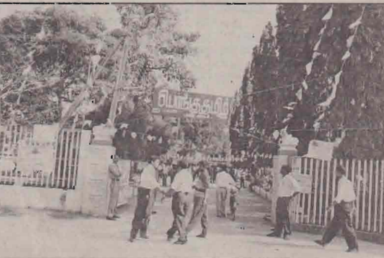
எம்மை எமது சொந்த

நாட்டுத்தொழிலாளர்களை பொங்குதமிழ் நிகழ்வில் ஊழல்கள் சேர்வதில் ஏற்பாட்டாளர்கள் உறுதியுடன் செயற்பட வேண்டும். அதே நேரம் இப்பொங்கு தமிழ் நிகழ்வின் குடாநாட்டு மக்கள் அனைவரும் உணர்வுறுகியுடன் இருந்திட வேண்டும். அனைத்து மக்களும் உணர்வுறுகியுடன் இருந்திட வேண்டும். சிக்கனத்துடன் இருந்து நாங்கள் கேட்கவேண்டிய எங்களுக்கு முட்கம்பிவேலி இல்லாத கடற்கரை வேண்டும். காவலரண்களற்ற தெருக்கள் வேண்டும். தடைகள் அற்ற சுதந்திரம் வேண்டும். நிம்மதியாக படுத்தறங்க எங்கள் விடுகள் வேண்டும் என்பதுதான். இப்பொழுது கேட்கிறோம். துயரத்தால்..... தட்டிப்பறிப்போம்.