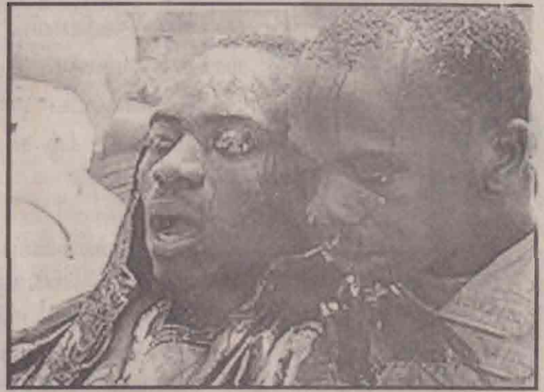
படகிலிருந்து மீட்கப்பட்ட குடியேற்றவாசிகள்

ஆபிரிக்க நாடுகளைச் சேர்ந்தோர் இவ்வாறு சட்டவிரோதமாக இத்தாலிக்கும் ஏனைய ஐரோப்பிய நாடுகளுக்கும் பயண முகவர்களால் அழைத்துச் செல்லப்படுகின்றனர்.