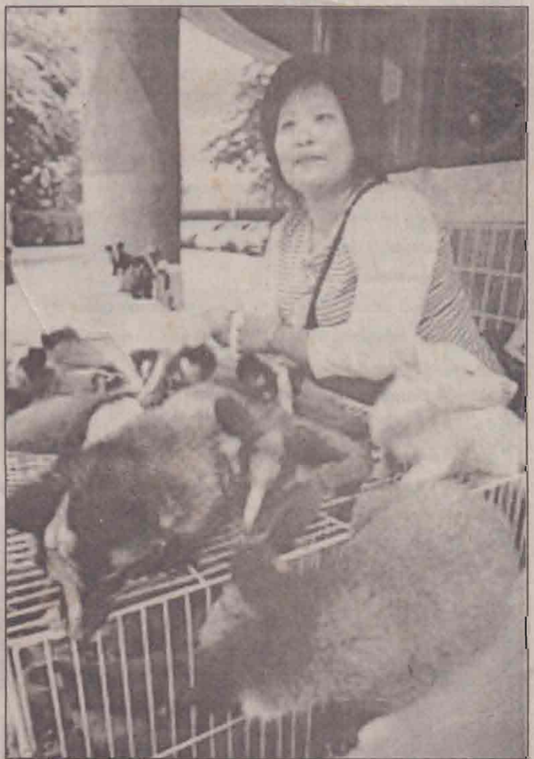
கிந்தப்பெண் கம்பிக் கூண்டுக்குள் வைத்திருக்கும் மிருகங்கள் ஒருவக பூனைகள். கிந்த சீவிட் பூனைகள் தைவானில் செல்லப்பிராணிகளாகவும் வளர்க்கிறார்கள். கிதைச்சீக்காகவும் வளர்க்கிறார்கள். மிருகுவான கிதை ரோமங்களைக் கொண்டு கலைப் பொருள்களைத் தயாரிக்கலாம். தைவான் வீவசாயிகள் கிதை அதிக அளவில் வளர்த்து அதை வற்று பழையடி நடத்தி வந்தனர். ஆனால், கிந்தப் பூனைகளால் 'சார்ஸ்' போன்ற ஒருவக வைரஸ் நோய் பரவும் என்று டாக்டர்கள் கூறிவிட்டதால் கிந்தப் பூனைகளை வளர்க்க தைவான் அரசு தடை விதித்து விட்டது. பிளேயுக்கு வுயில்லாத வீவசாயிகள் அந்தப் பூனைகளை எடுத்துக்கொண்டு தைவே நகரில் உள்ள வீவசாயத்துறை அலுவலகம் முன் ஆப்பாட்டம் நடத்திய சார்ஸ். (ஐ)

18 பெற்றிக் தொன் 'மஞ்சள் கேக்' என்ற அணுசக்தி பொருளும், சுமார் 500 தொன் வரையான கத்திகரிக்கப்பட்ட யுரேனியமும் ரூவெய்தா நகரிலிருந்து ஈராக்கியர்கள் வெளியேறிய பின்னர் கொள்கையிடப்பட்டன. கொள்கலன்களில் இருந்து யுரேனியத்தை தரையில் புதைத்து விட்டு அவை பொதுமக்களுக்கு விற்பனை செய்யப்பட்டன என்று தெரிவிக்கப்பட்டுள்ளது. (ஐ)