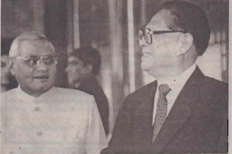
இந்தியப் பிரதமர் தனது சீன விஜயத்தின்போது ஆயுதப் படைகளின் ஆணைக்குழுத் தலைவர் ஜியாங் செமினைச் சந்தித்துப் பேசினார்.

பீஜிங், ஜூன் 25 இந்தியாவுக்கும் சீனாவுக்கும் இடையே பொருளாதார ஒத்துழைப்பை அதிகரிக்க இரு நாடுகளும் முடிவு செய்துள்ளன. சீனா சென்றுள்ள இந்தியப் பிரதமர் வாஜ்பாய் இதைத் தெரிவித்தார். இரு நாடுகளின் வர்த்தக அமைப்புகளும் பீஜிங் நகரில் ஏற்பாடு செய்திருந்த கூட்டத்தில் உரையாற்றிய அவர் இதைத் தெரிவித்தார். இரு நாடுகளுக்கும் இடையே கல்வி, வர்த்தகம், ராஜ்யத்துறை உறவுகள், விஞ்ஞானம் தொழில்நுட்ப ஒத்துழைப்பு உள்பட பல்வேறு துறைகளில் 9 ஒப்பந்தங்கள் நேற்றுமுன்தினம் கையெழுத்தானது. இதற்கு முன்னதாக இரு நாடுகளுக்கும் இடையே கூட்டுப் பிரகடனம் ஒன்றும் கையெழுத்தானது. வாஜ்பாயும், சீனப் பிரதமர் வென்ஜியாபாவும் இந்த கூட்டுப் பிரகடனத்தில் கையெழுத்திட்டனர். இந்தியா - சீனா இடையே கூட்டுப் பிரகடனம் கையெழுத்தாகி இருப்பது இதுவே முதற்முறை. 28 ஆண்டுகளுக்கு முன் சிக்கிம் மாநிலம் இந்தியாவுடன் இணைந்தது. இதை இப்போது சீனா அங்கீகரிக்க முன்வந்துள்ளது. அதேபோன்று திபெத்தை சீனாவின் ஒருங்கிணைந்த பகுதியாக இந்தியா அங்கீகரிக்க முடிவு செய்துள்ளது. சிக்கிம், மற்றும் திபெத் எல்லை வழியாக வர்த்தகம் மேற்கொள்ளவும் இரு நாடுகளுக்கும் இடையே உடன்பாடு ஏற்பட்டுள்ளது. சிக்கிம்பெத் எல்லைகளில் வர்த்தக மையங்கள் அமைக்கப்பட உள்ளது. (ம)