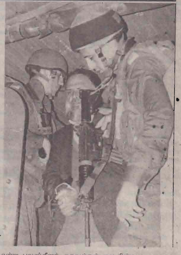
என்று பலஸ்தீனத் தகவல்கள் கூறுகின்றன. அதேசமயம் -