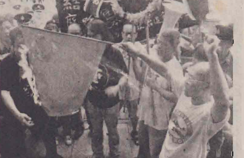
ஹொங்கொங்கில் நேற்று வீதிகளில் திரண்ட ஆயிரக்கணக்கானவர்கள் சீன அரசுக்கு எதிராக ஆர்ப்பாட்டங்களை நடத்தினர். தமது ஆதரவற்றதை வெளியிடுதலும் வகையில் அவர்கள் சீனத் தேசியக் கொடிகளையும் தயிட்டு எடுத்தனர்.

ஹொங்கொங், ஜூலை 2 ஹொங்கொங்கில் எதிர்வரும் 7 ஆம் திகதி நிறைவேற்றப்படவுள்ள சர்ச்சைக்குரிய தேசிய பாதுகாப்புச் சட்டத்திற்கு எதிராக லட்சக்கணக்கானோர் வீதிகளில் திரண்டு நேற்று ஆர்ப்பாட்டம் நடத்தினர். பிரிட்டிஷ் காலனித்துவ அரசியல் கீழ் இருந்த ஹொங்கொங் 6 ஆண்டு களுக்கு முன்பு கிளாஸ்கோ கைதாக்கு மாற்றப்பட்ட பின்பு, அங்கு நடைபெறும் மிகப்பெரிய ஆர்ப்பாட்டம் இதுவாகும். நேற்றுக்காலை ஆர்ப்பாட்டக்காரர்களுக்கும் பொலீஸாருக்கும் இடையே சிறு மோதல்கள் இடம்பெற்றன. சுமார் ஆயிரம் பொலீஸாரும் 800 வரையான படையினரும் வீதிகளில் பாதுகாப்புப் பணியில் ஈடுபட்டிருந்தனர். புதிய சட்டமூலத்தின்படி ராஜ்ய ரோகம், அரசு இரகசியங்களை களவாடிப் பிறருக்கு வெளியிடல் போன்ற குற்றங்களுக்கு ஆயுள் சிறைத்தண்டனை விதிக்கப்படும். ஹொங்கொங்கின் பாதுகாப்புப் பேணுவதற்கு இவ்வகையான சட்டங்கள் அவசியமானவை என்று அரசு தரையில் தெரிவிக்கப்பட்டுள்ளது. ஆனால், ஆர்ப்பாட்டக்காரர்கள் இச்சட்டமூலம் அடிப்படை உரிமை களையும், தகவல்களையும் பெற்று அவையும் சுதந்திரத்தையும் இல்லா தொழிக்கிறது என்று தெரிவிக்கின்றனர்.