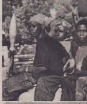
லைபீரியத் தலைநகர் மொன்ரோவியாவில் அரசு படையினருக்கும் கிளர்ச்சியாளர்களுக்கும் இடையிலான யோர்தல் தண்டிப்புகள், ஆனால், அரசு ஆதரவு கிளையினர்கள் வீதிகளில் ஆயுதங்கள் சகிதம் ரோந்து அற்ற வருகின்றனர்.

இருக்கின்றனர். ஆனால், அங்கு மருத்துவர்கள் பற்றாக்குறையும் மருந்துகளின் பற்றாக்குறையும் நிலவுகின்றது. இதனால், நோயாளிகளின் நிலைமை நாளுக்கு நாள் மோசமாகி வருகின்றது. மேதல் காரணமாக இடம்பெயர்ந்து பாடசாலைகள், விளையாட்டரங்குகள் மற்றும் பொதுக் கட்டடங்களில் தங்கியுள்ள சுமார் இரண்டு லட்சத்துக்கும் அதிகமானோருக்கு தெற்று நோய்கள் பரவி வருகின்றன. இதனை அடுத்தே செஞ்சிலுவைச் சர்வதேசக் குழு அவசர மருந்துப் பொருள்களை அனுப்பி வைத்துள்ளது. (ம)