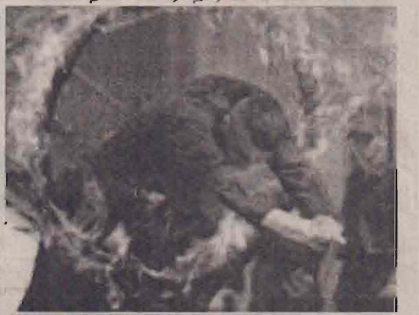
கீழ்ப்புறம் வலையாக்களுக்குள்ளால் காய்ந்து பயிற்சி பெறுவதில் பலஸ்தீன பொலீஸர் தீவிரம்.

கேரியான கட்டத் தொழிலாளர் ஒருவர் பலஸ்தீனரால் சுட்டுக்கொல்லப்பட்டார். அல்-அக்ஷர் மாவீரர் படையணியில் இருந்து வீல்கிய உறுப்பினர்கள் இத்தாக்குதலுக்கு உரிமை கோரியுள்ளனர். இச்சம்பவத்தின் பின்னர் மேற்குக் கரை நகரான கவெல்கியாவில்