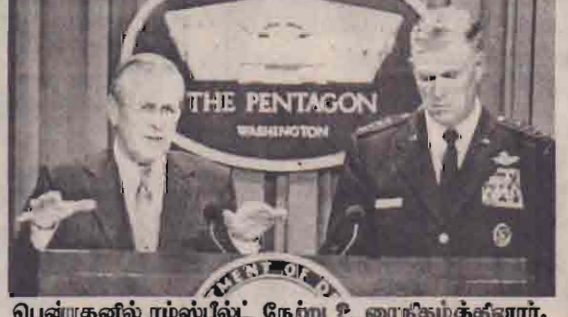
பென்ரகனில் ரம்ஸ்பீல்ட் நேற்று உரைகூறியபோது.

பள்ளிவாசலில் அமெரிக்கப் படையினரே குண்டுத் தாக்குதலை நடத்தினர் என்று ஈராக்கியர்கள் தெரிவிக்கின்றனர். ஆனால், அந்தக் கட்டத்தினால் சிந்த குண்டி வெடித்தது என்று அமெரிக்கப் படையினர் கூறுகின்றனர். இது இவ்வாறிருக்க, பக்தாத் நகரின் மத்திய பகுதியிலும் தெற்குப் பகுதியிலும் அமெரிக்கப் படையினரின் வாகனங்களைக் குறிவைத்து எறிகணைத் தாக்குதல்களும், கிரேனேட் வீச்சுக்களும் நடைபெற்றுள்ளன. இந்தத் தாக்குதல்களில் ஏற்பட்ட இறப்புகள் பற்றிய விவரங்களை அமெரிக்கப் படையினர் உடனடியாக வெளியிடவில்லை. தாக்குதல் நடந்த இடத்தில் படையினரின் இரண்டு வாகனங்கள் எரிந்த நிலையில் இருந்தன. சுயாதீனத் தகவல்களின்படி இதிலிருந்து நான்கு பேர் காயமடைந்தனர் என்று தெரிவிக்கப்படுகின்றது. இதற்கிடையே - பதவி கவிழ்க்கப்பட்ட சதாம் ஹுசைனின் ஆதரவாளர்கள் ஒரு பயங்கரவாத வலையமைப்பாகத் தொழிற்படுகின்றனர் என்று அமெரிக்கப் பாதுகாப்புச் செயலர் ரொனால்ட் ரம்ஸ்பீல்ட் தெரிவித்துள்ளார். ஆனால், வியட்நாம் போன்ற ஒரு புதைகுழிக்குள் அமெரிக்கப் படையினர் சிக்கவில்லை என்று கூறினார். (ம)