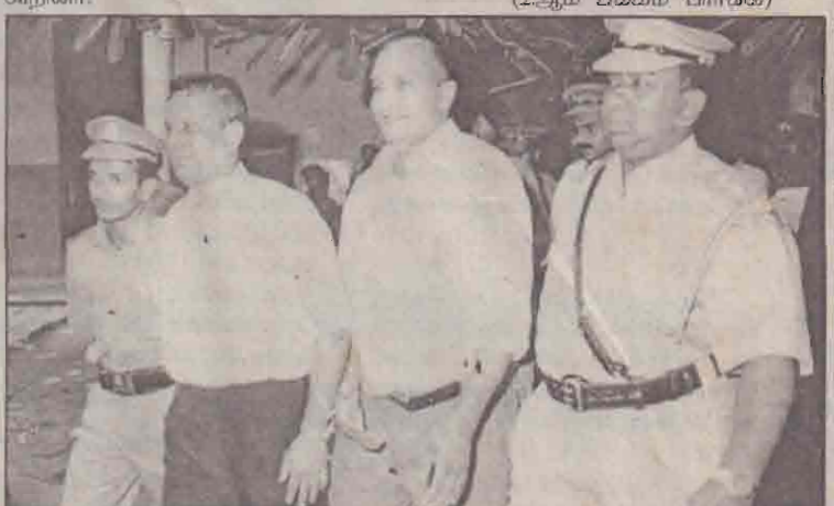
பிந்துனுவிவவ தடுப்பு முகாம் படுகொலை வழக்கில் மரணதண்டனை விதிக்கப்பட்ட பொலீஸ் அதிகாரிகள் (நடுவில் உள்ள இருவரும்) நீதிமன்றத்தில் அழுது கதறினர்.