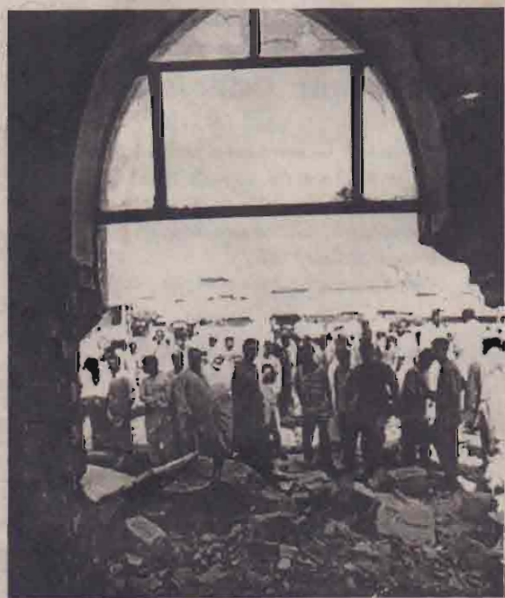
இந்த மருதியில் நேற்று கடம்பெற்ற குண்டு வெடிப்பில் 8பேர் பலியானனர். மேலும் பலர் காயமடைந்தனர்.

பக்தாத், ஜூலை 2 ஈராக்கில் பல்புரான நகரில் உள்ள பள்ளிவாசல் ஒன்றில் நேற்றுக்காலை குண்டு வெடித்ததில் அங்கு தொழுகையில் ஈடுபட்டிருந்த எட்டு ஈராக்கியர்கள் கொல்லப்பட்டனர். மேலும் 7பேர் காயமடைந்தனர்.