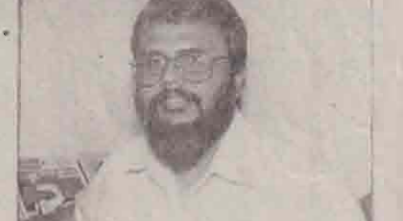
லண்டன், ஜூலை 2 இந்தியாவின் தலையீடு இன்றி இலங்கை இனப்பிரச்சினைக்குத் தீவு காணமுடியாது குறிப்பாக மனித உரிமைகள் விடயத்தில் இந்தியா கவனஞ்செலுத்தவதன் நேரடியாகவும் அதில் ஈடுபடவேண்டும்.

இந்தியாவின் தலையீடு இன்றி இலங்கை இனப்பிரச்சினைக்குத் தீவு காணமுடியாது குறிப்பாக மனித உரிமைகள் விடயத்தில் இந்தியா கவனஞ்செலுத்தவதன் நேரடியாகவும் அதில் ஈடுபடவேண்டும். இவ்வாறு தெரிவித்துள்ளார் ஈ.பி.டி.பி. அமைப்பின் செயலாளர் நாயகம் டக்ளஸ் தேவானந்தா.