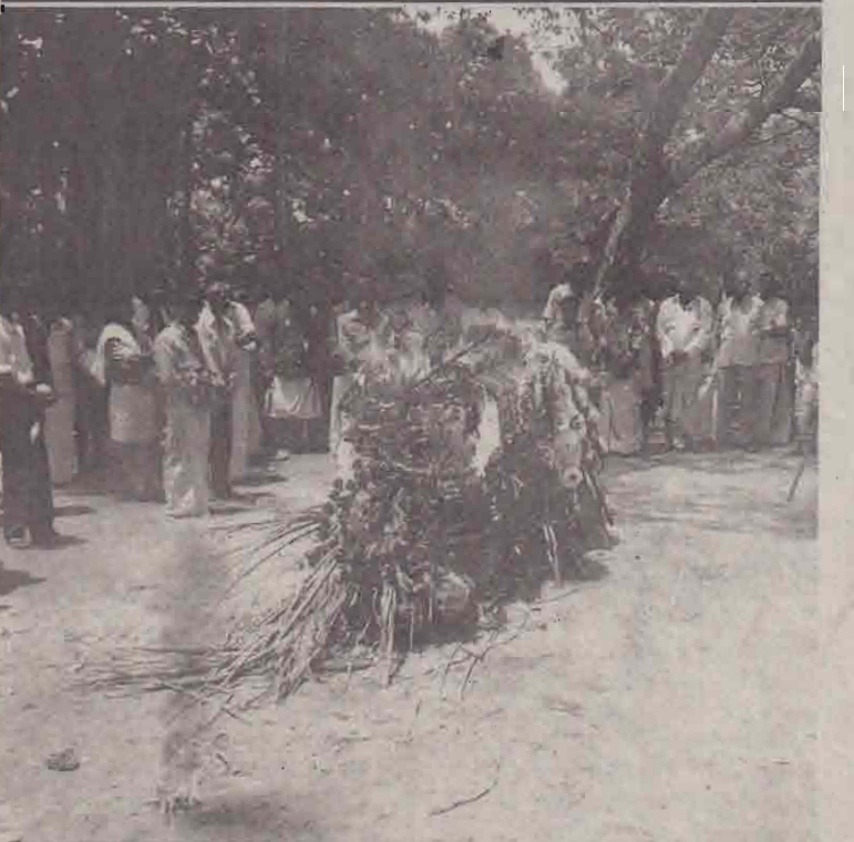
தீயுடன் சங்கமமாகும் என்.கே.பி.