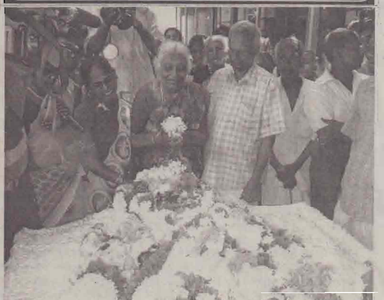
மலர் தூவி அஞ்சலிக்கும் மனையாள்.