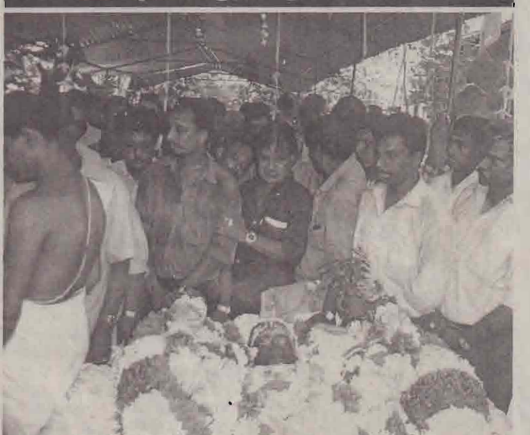
செவிக்கு இன்பம் சேர்த்தவருக்கு கரம் கூப்பி அஞ்சலி செலுத்தும் மக்கள்.