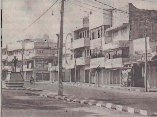
ஹர்த்தாலால் வெறிச்சோடிக் கிடக்கும் மட்டபுரகர் வீதிகளில் ஒன்று.

இவ்விரு மாவட்டங்களிலும் நேற்று அனுஷ்டிக்கப்பட்ட ஹர்த்தாலினாலேயே அவை செயலிழந்தன. படையினரின் கெடுபிடுகளை எதிர்த்தும், புரிந்துணர்வு ஒப்பந்தம் புரணமாக அமுல்படுத்தப்படாமையையும், தமிழலைத்தில் புலிகளின் ஆதரவாளர் கொலை செய்யப்பட்டதை கண்டித்தும், கறுப்பு ஜூலையை நினைவுகூர்தும் இந்தப் பூண ஹர்த்தால் அனுஷ்டிக்கப்பட்டது.