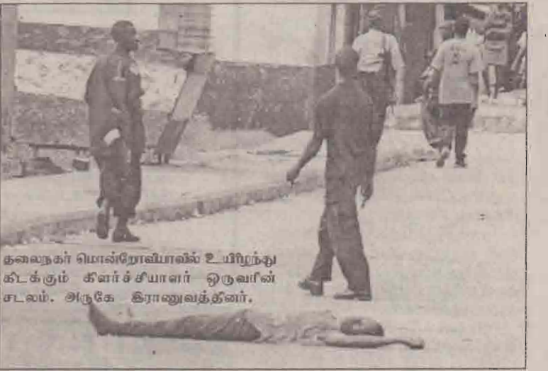
தலைநகர் மொன்ரோவியாவில் உயிரிழந்து கிடக்கும் கிளர்ச்சியாளர் ஒருவரின் சடலம். அருகே கிரானுவுக்கீனர்.

அரசு படையினர் கிளர்ச்சியாளர்களின் பகுதிகளை நோக்கி முன்னேறுவதைக் கைவிட்டு தலைநகரைத் தக்கவைக்கும் முயற்சியில் ஈடுபட்டுள்ளனர். அத்துடன் கிளர்ச்சியாளர்களிடம் பரிசோதனை இணைப்புகளையும் அவர்கள் மீட்டுள்ளனர்.