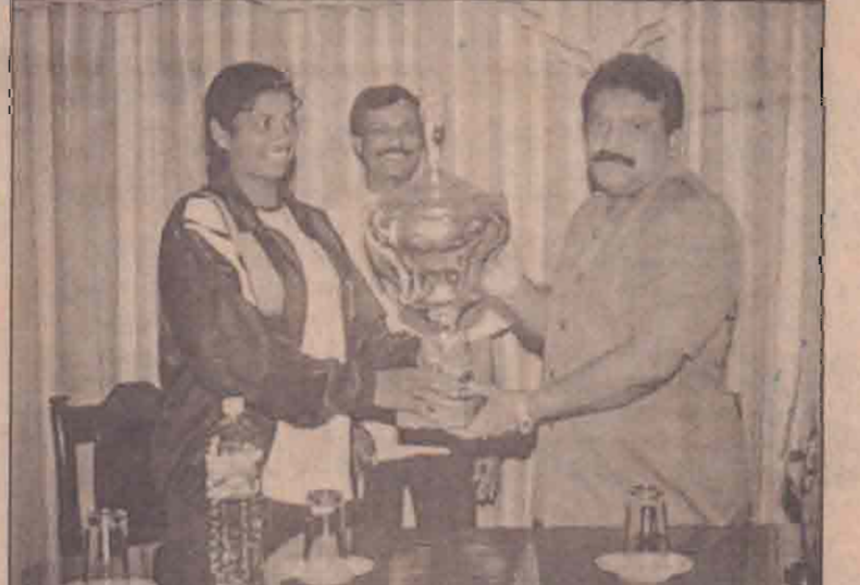
தமிழீழ வலைப்பந்தாட்ட அணி பிரிட்டனில் பெற்ற வெற்றிக்கின்னத்தை அந்த அணியின் தலைவி தேசியத் தலைவர் பிரபாகரன்மீட்கையளிக்கிறார். அரசியல்துறைப் பொறுப்பாளர் சு.ப.தமிழ்ச்செல்வனும் உடன் காணப்படுகிறார்.

திருகோணமலைத் துறைமுகத்தில் முவாயிரம் கோடி ரூபா பெறுகிறபடி உபகரணங்கள், கருவிகளை நாம் வைத்திருக்கிறோம். அங்கு புலிகள் (14ஆம் பக்கம் பார்க்க)