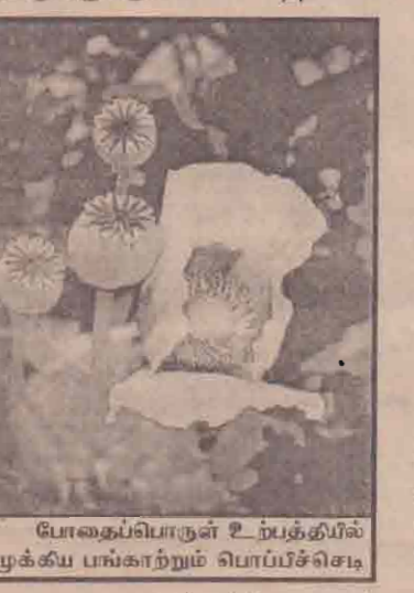
போதைப்பொருள் உற்பத்தியில் முக்கிய பங்காற்றும் பொப்ப்ச்செடி

நர். ஆனால், போதிய ஆதாரங்கள் இல்லாமையால் அவர்களைக் கைதுசெய்ய முடியாதுள்ளது. எச்சர்த்தப்பத்திலும் அவர்களிடம் போதைப்பொருள்களைக் காணமுடிவதில்லை என்றும் அவர்களின் அடியாளர்கள் கைதுகளுக்கு உட்பட்ட சந்தர்ப்பம்