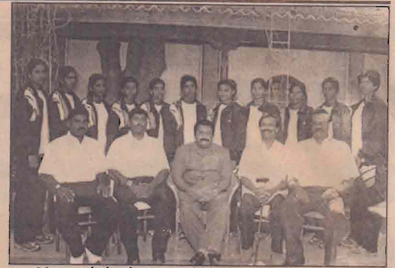
தமிழீழ வலைப்பந்தாட்ட அணியினர் தேசியத் தலைவர் பிரபாகரன் மற்றும் விடுதலைப் புலிகளின் பிரமுகர்களுடன் எடுத்துக் கொண்ட படம்.

துக்குப் பிரித்துக் கொடுத்திருக்கிறார்கள். அதனுடாக தொடர்ந்து நாட்டுக்குள் யுத்தம் ஒன்று உருவாகும் அறிகுறிகள் உள்ளன. பஸ்தீமை - இஸ்ரேல் போன்று பெரும் யுத்தமொன்று எதிர்காலத்தில் ஏற்படலாம் என்ற நிலையும் இருக்கிறது. வடக்கு - கிழக்கில் விடுதலைப் புலிகளைத் தவிர சகல இன மக்களுக்கும் ஆபத்தான நிலையே உள்ளது. அப்பிரதேச மக்கள் இன்று சுதந்திரமாக இரவில் உறங்க முடியவில்லை - என்றார் ஜனாதிபதி.