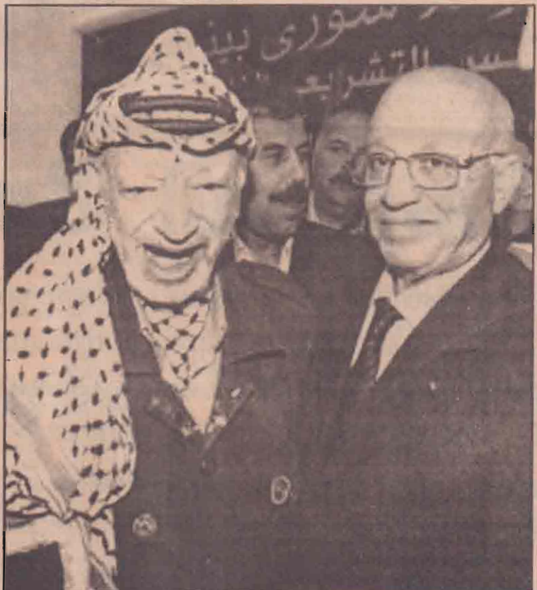
பதிலான புதிய பிரதமர் ஒருவரைத் தெரிந்தெடுக்குமாறும் அவர் நாடாளுமன்றத்தைக் கேட்டுள்ளார்.

அது, அரபாத்தை சமாதான முயற்சிகளில் இருந்து ஓரங்கட்டவே விரும்புகிறது. ஆனால், அரபாத்தை அடக்கி ஒடுக்கும் இஸ்ரேலின் முயற்சிக்கு முதல் தடவையாக எதிர்ப்புத் தெரிவித்துள்ள அமெரிக்கா, அபு மாஸான் இராஜினாமா செய்தாலும் தனது சமாதான முயற்சிகள் தொடரும் என்று அறிவித்துள்ளது. (ம)