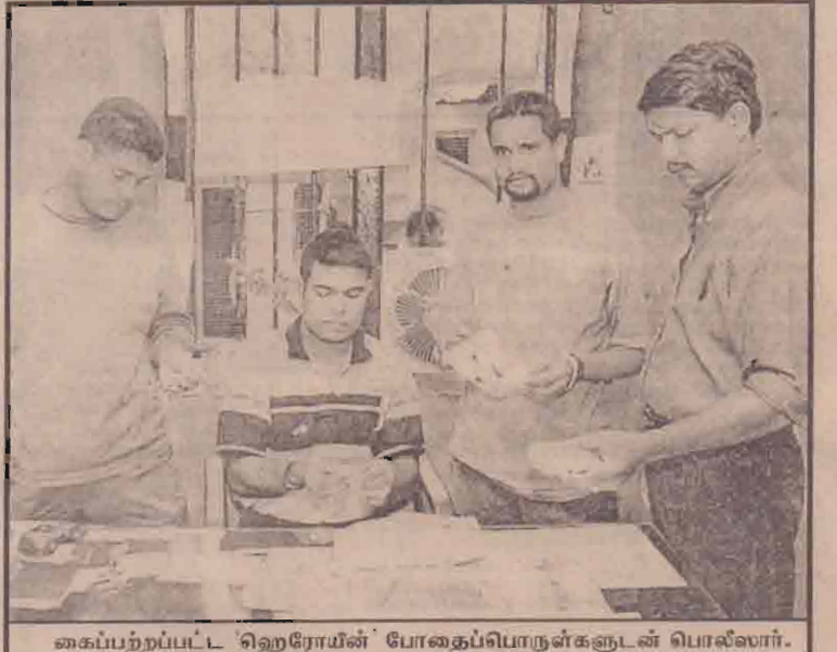
கைப்பற்றப்பட்ட ஹெரோயின் போதைப்பொருள்களுடன் பொலீஸார்.

சட்டவிரோதப் போதைப்பொருள் விற்பனையைத் தடுப்பதற்கு போதைப்பொருள் ஒழிப்புகள் விசேட பொலீஸ் பிரிவினரால் அநேகமான விசேட செயல் திட்டங்கள் ஏற்கனவே நடைமுறைப்படுத்தப்பட்டுள்ளன. போலைஸ் அதிகாரிகள் ஆலோசனைக்கமைய பல விசேட பொலீஸ் குழுக்கள் இதற்காக நியமிக்கப்பட்டுள்ளன. போதைப்பொருள் கடத்தல் சம்பந்தமான இரகசிய உறவுகள் மற்றும் தகவல்களைச் சேகரிப்பதற்காக விசேட உளவாளிகள் நாடு யூராகவும் அமர்த்தப்பட்டுள்ளனர்.