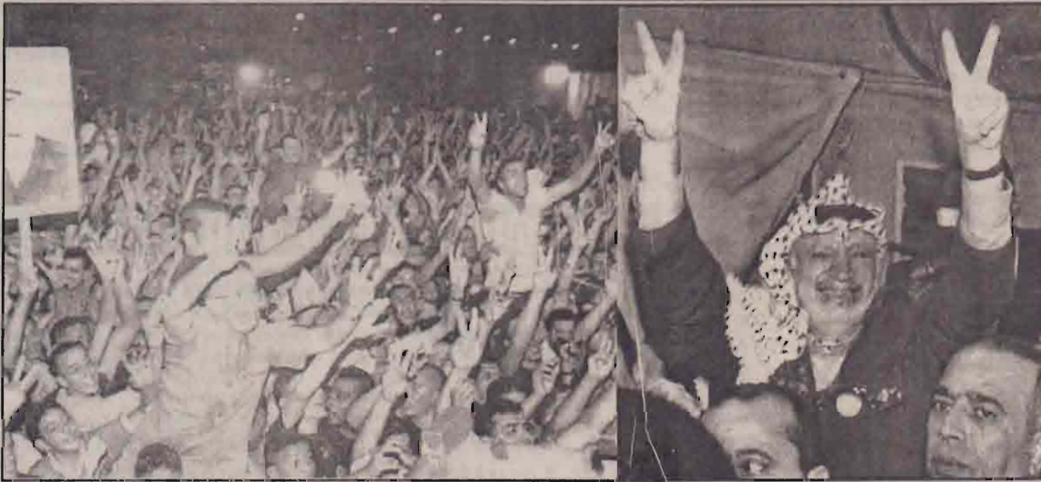
யஸீர் அரபாத்தை பாதுகாப்பதற்காக ரமழாவில் கூடியுள்ள பலஸ்தீனர்களையும் அவர்களுக்கு மகிழ்ச்சியுடன் கையசைக்கும் அரபாத்தையும் படங்களில் காணலாம்.

யஸீர் அரபாத்தின் தலைமையகத்தை சுற்றி பலஸ்தீனர்கள் 24 மணித்தியாலமும் கரும் காவல் போடப்பட்டிருக்கிறது.