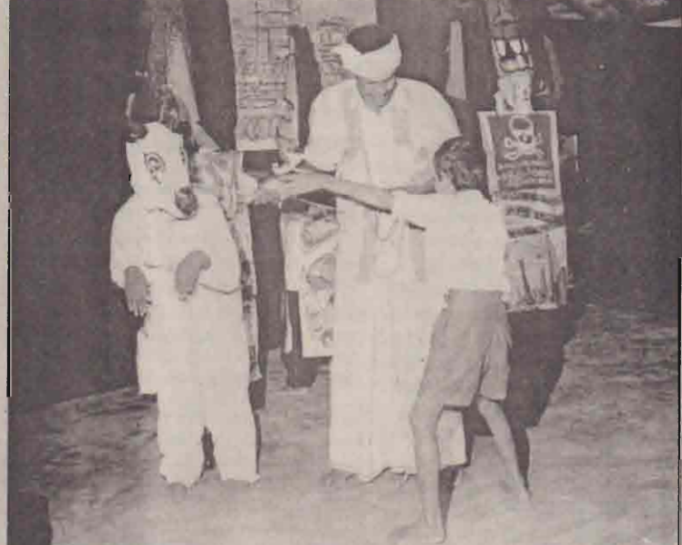
மதிவெடி விழிப்புணர்வு தொடர்பான ஆற்றுகை ஒன்று பாடசாலையில் நிகழ்த்தப்பட்ட சமயம் அதில் கிடம்பெற்ற காட்சி.

அவர்களின் பெற்றோர் மனவிரக்தி அடைந்து அசாதாரண முடிவுகளை மேற்கொள்ளும் சந்தர்ப்பம்