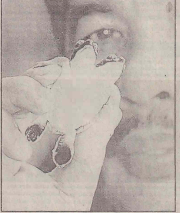
எஸ்ட் கோஸ்ட் தீவில் உள்ள அமைகள் சரணாலயத்தில் கிருதலைகளுடன் கூடிய பச்சைநிற ஆமைகளைப் படத்தில் காணலாம். முட்டையிலிருந்து கடந்த செவ்வாய்க்கிழமை கிடைக்கப்பட்டன.

பி.பி.சேஷுகிரி கூறியதாவது: ஜெல்லி மீன்களில் காணப்படும் பச்சை 'புளோரோசெண்ட்' புரோட்டீனைக் கொண்டு பச்சை எலி உருவாக்கப்பட்டுள்ளது. எதிர்காலத்தில் கல் மற்றும் ஆராய்ச்சிகளுக்கு இது மூன் னோடியாக இருக்கும். இந்த முறையில் உருவாக்கப்பட்ட பச்சைநிற எலிகளின் உள்ளுறுப்புக்களை நாம் வெளிப்படுத்திவிருந்தே காணமுடியும் - இவ்வாறு அவர் கூறினார்.