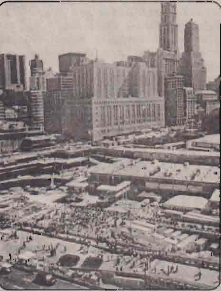
2001 செப்டெம்பர் 11 வந்ததக மையம் தகர்க்கப்பட்ட கருப்பு தினம் அந்தப் பயங்கரம்