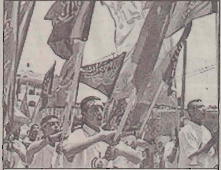
'ஹமாஸ்' அமைப்பின் கொடியுடன் ஊர்வலம் செல்லும் பலஸ்தீன மாணவர்கள்.

நியாயபூர்வமான உரிமைகளை மதிக்காமல் இஸ்ரேல் விடாப்பிடியாக மேற்கொண்டு வரும் குடியேற்றங்களுக்கும் பழிவாங்குவதற்கு "ஹமாஸின்" போராட்ட நடவடிக்கைகளே சரியான பதிலடி என்று பெரும்பாலான பலஸ்தீனர்கள் நம்புகிறார்கள்.