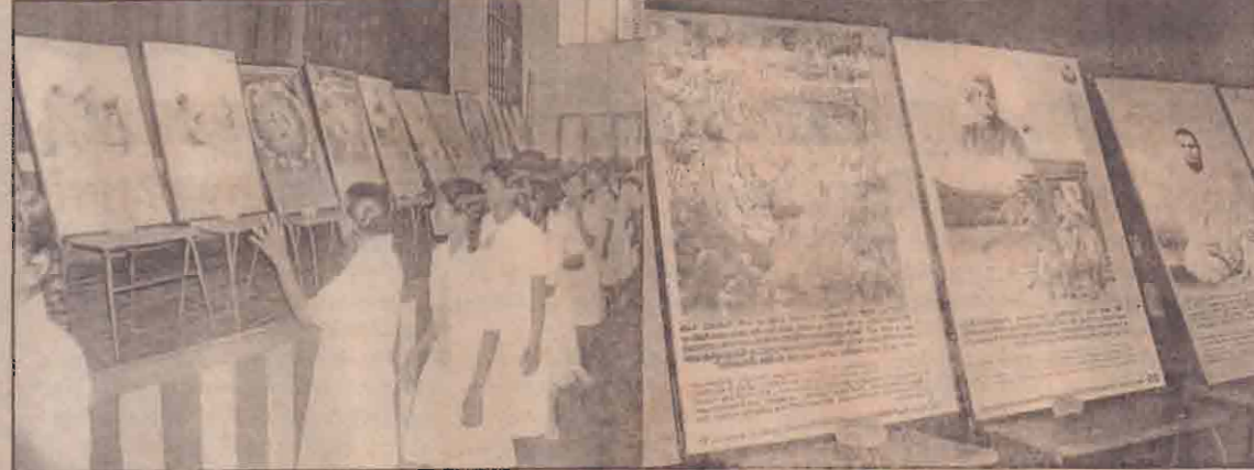
நேற்று யாழ். இந்து மகளிர் கல்லூரியில் கிடம்பெற்ற கலாமி விவேகானந்தரின் வரலாற்றைச் சித்தரிக்கும் புகைப்படக் கண்காட்சியினை பார்வையிடும் அப்பாடசாலை மாணவிகள்.

கல்லூரி என்பவற்றில் நடத்தப்பட்டுள்ளன. ஏனைய பாடசாலைகளிலும் இணை நடத்துவதற்குத் திட்டமிடப்பட்டுள்ளது.