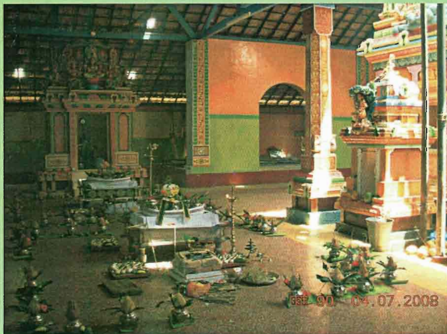
முதிதாக அமைக்கப்பட்ட மஹாலக்ஷ்மி, தக்ஷிணா மூர்த்தி சந்திதானங்களின் முன்னே மண்டல பூர்த்தி நாளில் அஷ்டோத்தரசத சங்காபிலேக மண்டபம்