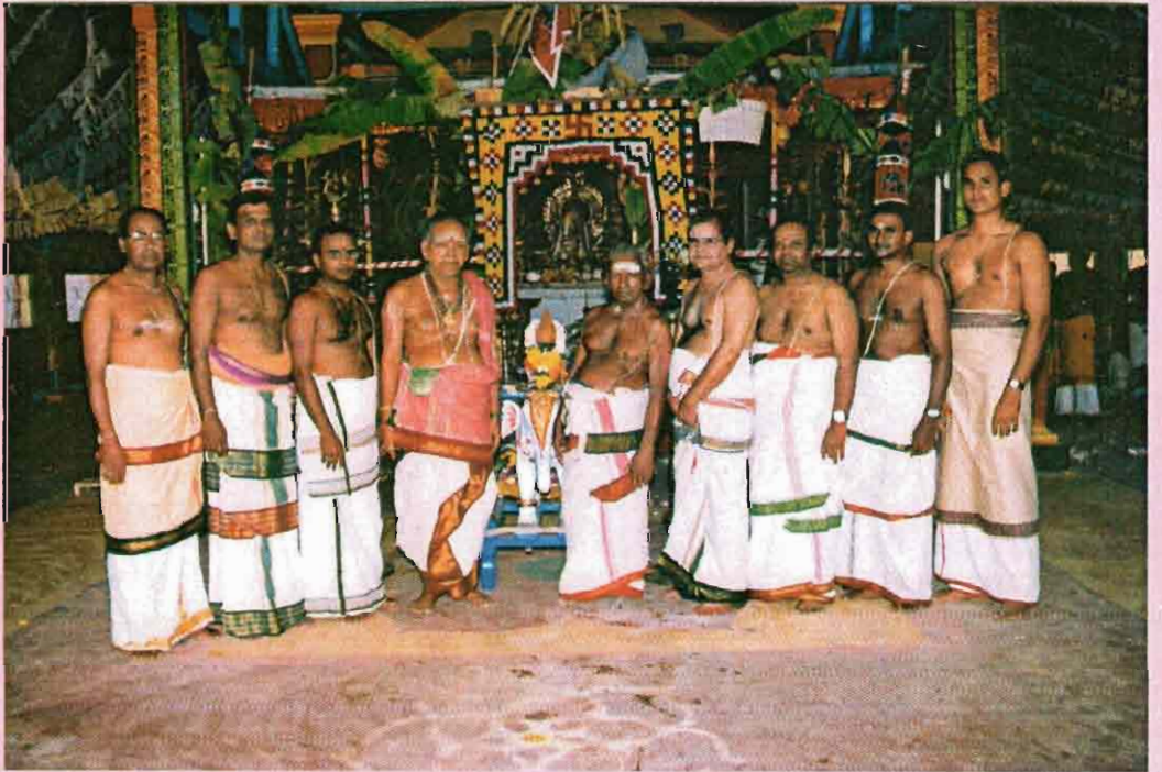
ஆதீன கர்த்தர்களுடன் வேதபாராயண வித்தகர்கள்