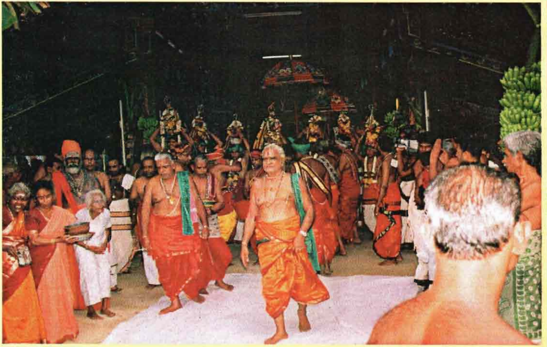
பிரதான கும்பங்கள் வீதிவலம் வரும் காட்சி