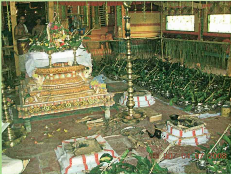
மண்டல பூர்த்திநாளில் பஞ்சகுண்ட சகித சஹஸ்ரகலச சங்காபிலேக யாகம்