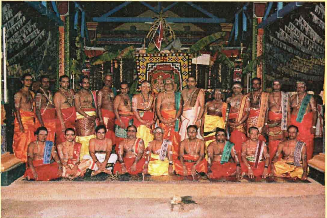
கும்பாபிஷேகத்தில் கலந்துகொண்ட சிவாசார்ய மணிகள்