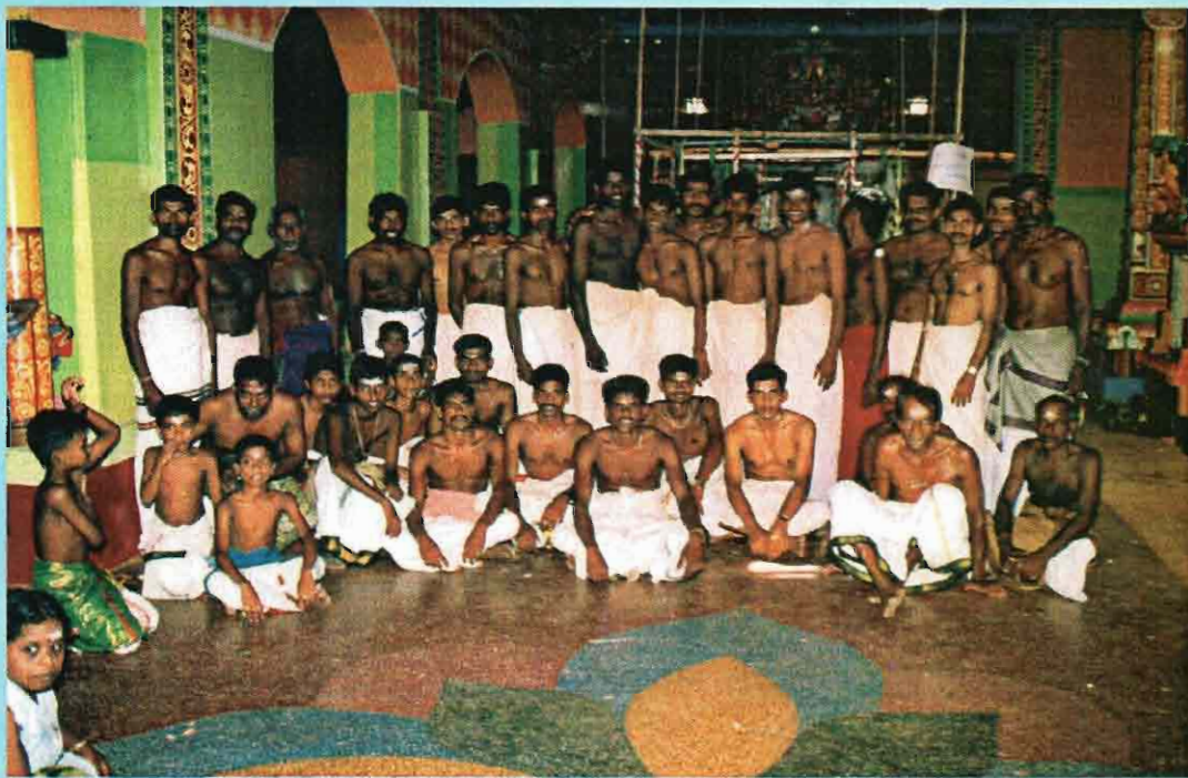
பக்தராய்ப் பணிசெய்யும் தொண்டர் குழாம்