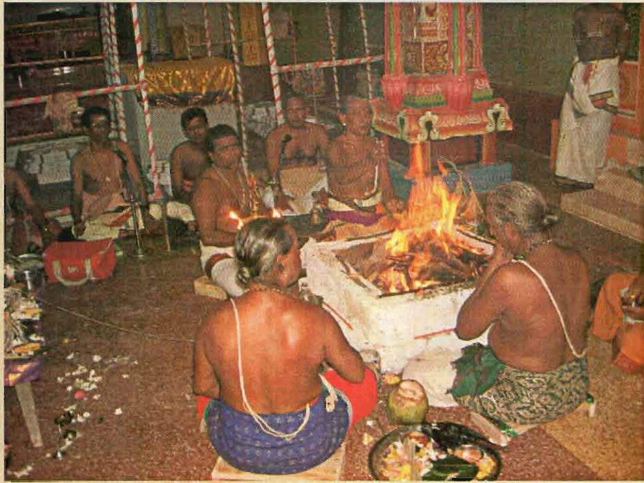
கும்பாபிஷேக கர்மாரம்பத்தில் மஹாகணபதி ஹோமம்