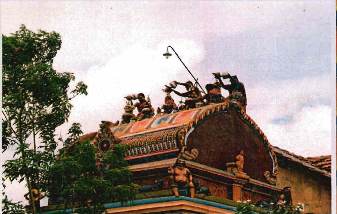
வசந்தமண்டப ஸ்தூபி அபிஷேகம்