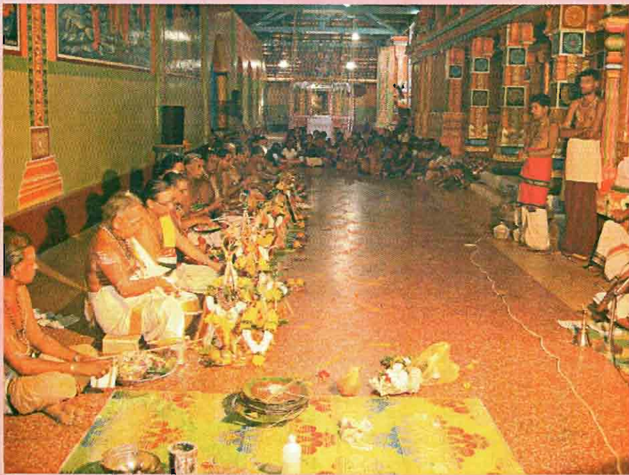
கடஸ்தாபனம் செய்யும் சிவாசார்யர்கள்