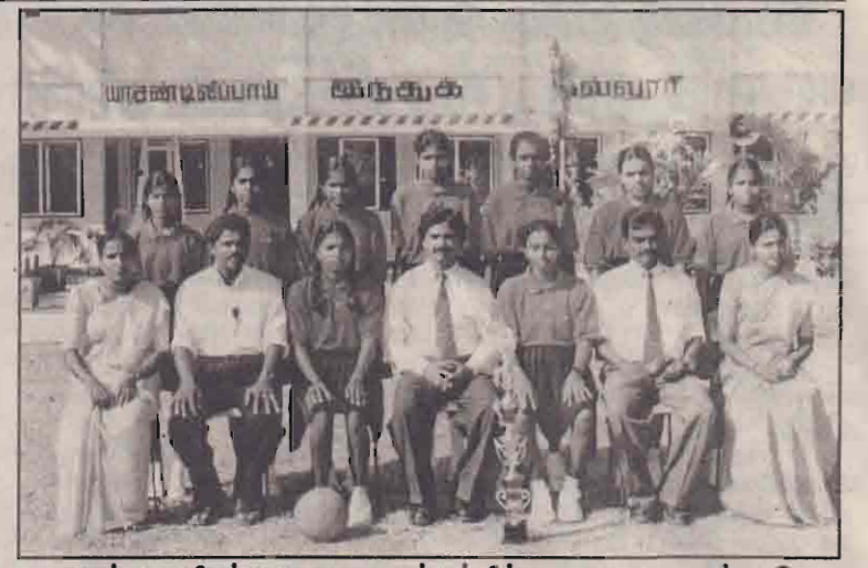
வடக்கு - கிழக்கு மாகாண மட்டத்தில் பாடசாலைகளுக்கு கிடை யில் நடத்தப்பட்ட 19வயதுப் பிரிவு வலைப்பந்தாட்டப் போட்டியில் சம்பியனாக தேசிய மட்டப் போட்டிக்குத் தெரிவுசெய்யப்பட்ட சண்டிலிப்பாய் கிந்துக்கல்லூரி வலைப்பந்தாட்ட அணியினரைப் படத்தில் காணலாம்.