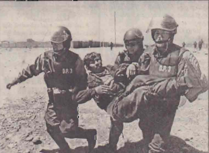
பொலீவியாவில் கொக்ஹெயின் பயிற்சியைக்கையில் ஈடுபடும் விவசாயிகள் அரசுக்கு எதிராக கடந்த ஒரு மாதமாக ஆர்ப்பாட்டம் நடத்தி வருகின்றனர். அவ்வாறு, நேற்று, சிடம்பெற்ற ஆர்ப்பாட்டத்தில் காயமடைந்த ஒருவரை பொலீவியா தூக்கிச் செல்கின்றனர்.

இப்போது விண்வெளி ஆராய்ச்சியில் தீவிரம் காட்டி தொடங்கியிருக்கிறது. 1999ஆம் ஆண்டு நவம்பர் 4ஆம் திகதி முதல் இஸ்ரேல் விண்வெளிக்கு சீனா விண்வெளிக்கு அனுப்பியது. இதில் கிடைத்த வெற்றியைத் தொடர்ந்து விண்வெளிக்கு மனிதனை அனுப்பும் முயற்சியில் சீனா ஈடுபட்டுள்ளது. எதிர்பாரும் 15ஆம் திகதி சென் ஹை - 05 என்ற ரோக்கெட்டை சீனா விண்வெளிக்கு அனுப்புகிறது. சீனா ரோக்கெட்டில் விண்வெளி வீரர் ஒருவர் அனுப்பப்படுகிறார். இதற்காக 3 பேருக்கு ஏற்கனவே பயிற்சி கொடுக்கப்பட்டுள்ளது. விண்வெளிக்கு மனிதனை அனுப்பும் முயற்சி வெற்றிபெறாமல் அமல்படும் போது, ரஷியாவை நோக்கி சீனாவும் இந்த வரிசையில் 3ஆவது இடத்தைப் பிடிக்கும். விண்வெளி ஆய்வுக்காக சீனா கடந்த 1992ஆம் ஆண்டு முதல் 105 கோடி டொலர் செலவில் இறங்கியிருக்கிறது. (ஐ)