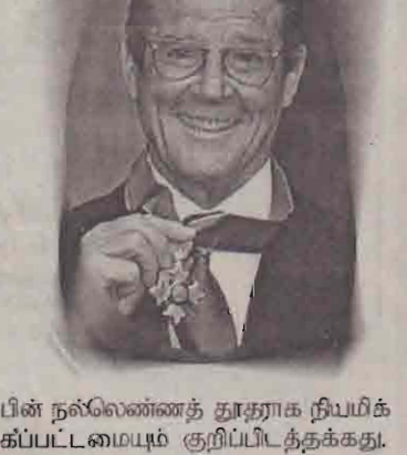
பின் நல்லெண்ணைத் தூதராக நியமிக்கப்பட்டமையும் குறிப்பிடத்தக்கது.

முன்னாள் "ஜேம்ஸ் பொண்ட்" நடிகர் ரொஜர் மூர் (வயது 75) பிரிட்டிஷ் மகாராணியால் 'சேர்' பட்டம் வழங்கிக் கௌரவிக்கப்பட்டார். பக்கிஷ்ஹாம் அரண்மனையில் இடம் பெற்ற விசேடநிகழ்ச்சியில் பிரிட்டிஷ் மகாராணி இரண்டாம் எலிசபெத் ரொஜர் மூர்க்கு 'சேர்' பட்டத்தை வழங்கினார். "ஜேம்ஸ் பொண்ட்" திரைப்படங்களின் வரிசையில் நடிகர் சேர்சன் கொனரிக்கு பின்னர் 'ஜேம்ஸ் பொண்ட்' பாத்திரத்தை தாங்கி நடத்தவர் ரொஜர் மூர். இவர் ஏழு ஜேம்ஸ் பொண்ட் திரைப்படங்களில் நடித்தார். ரொஜர் மூரின் சமூக சேவைகளுக்கு மதிப்பளிக்கவும் வகையில் 'யுனிசெவ்' அமைப்