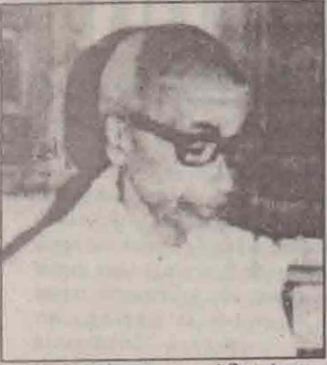
"நாமார்க்கும் குடியல்லோம்; நமையைஞ்சோம்" என்று உண்மையாகவே கருதுகின்ற சிலரில் நானும் ஒருவன்.

ஆயினும் - எமக்கு மிகவும் வேண்டிய ஒருவர் மீது அந்த எம்ன் பாசக்கயிறை வீசும் போது கலங்கித்தான் போகின்றோம்.