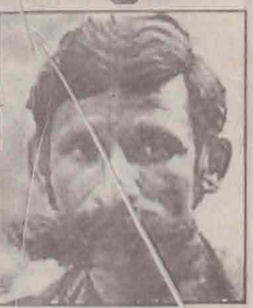
என்ற ஏந்தல்களின் பேரில் சத்தியமங்கலம் கைப்பகுதியிலும், சற்று பின்பு கிராமத்திலும் பொலீஸ் பாதுகாப்புப் பல்படுத்தப்பட்டது. ஆனால், பொலீஸார் நினைத்தது போல் எதுவும் நடக்க

கர்நாடக, ஓக். 11 கர்நாடக - தமிழ்நாடு எல்லையில் பலசரக்குக்கடை நடத்திவரும் வாலிபரை, சந்தனக் கடத்தில் வீரப்பன் கடத்தினான் என்று வெளியான தகவல்கள் 'வெறும் வதந்தி' என கர்நாடக முதல்வர் கிருஷ்ணாவும், அதிரடிப்படை பொலீஸாரும் மறுத்துள்ளனர். பொதுவாக வீரப்பன் அட்டகாசம் செப்டெம்பர் மாதத்தில் நடப்பது வழக்கம். அந்த மாதத்தில் வரும் மழையே அமாவாசை வீரப்பனுக்குப் பிடித்த நாள். அமாவாசையில் ஆள்களைக் கடத்துவது பிடித்தமான ஒன்று. மழையே அமாவாசை காலத்தில் ஆள்களைக் கடத்தினால், பின்னர் மண்டலம் ஆறும் பித்துவிடும், பொலீஸாரால் தன்னை நேருக்க முடியாது என்பது வீரப்பனின் கணிப்பு. கடந்த செப்டெம்பர் மழையே அமாவாசை தினத்தில் விஜயபுக்கல் யாராவது ஒருவரை வீரப்பன் கடத்தலாம்